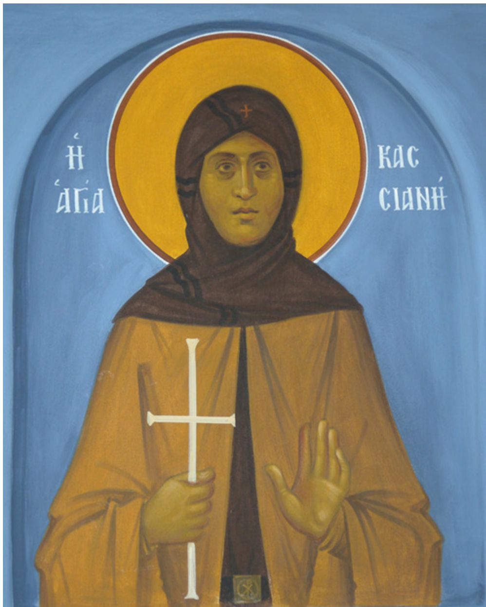
Οσία Κασσιανή – Ι. Ν. Οσίων Παρθενίου και Ευμενίου των εν Κουδουμά, δια χειρός Παναγιώτη Μόσχου (2006 μ.Χ.)