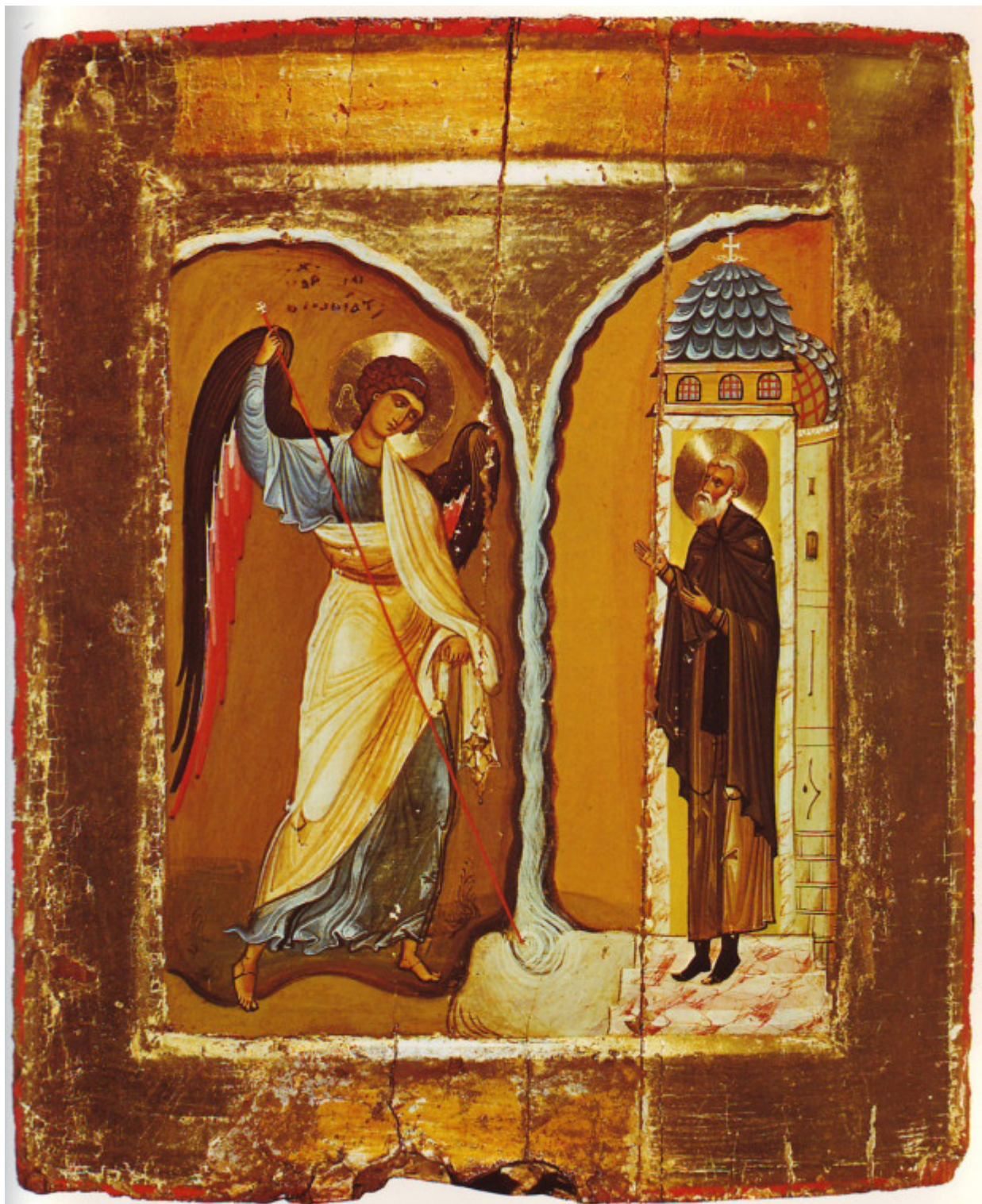
Το θαύμα του Αρχαγγέλου Μιχαήλ στις Χωναίς (ή Κολασσαίς) - α' μισό 12ου αι. μ.Χ.