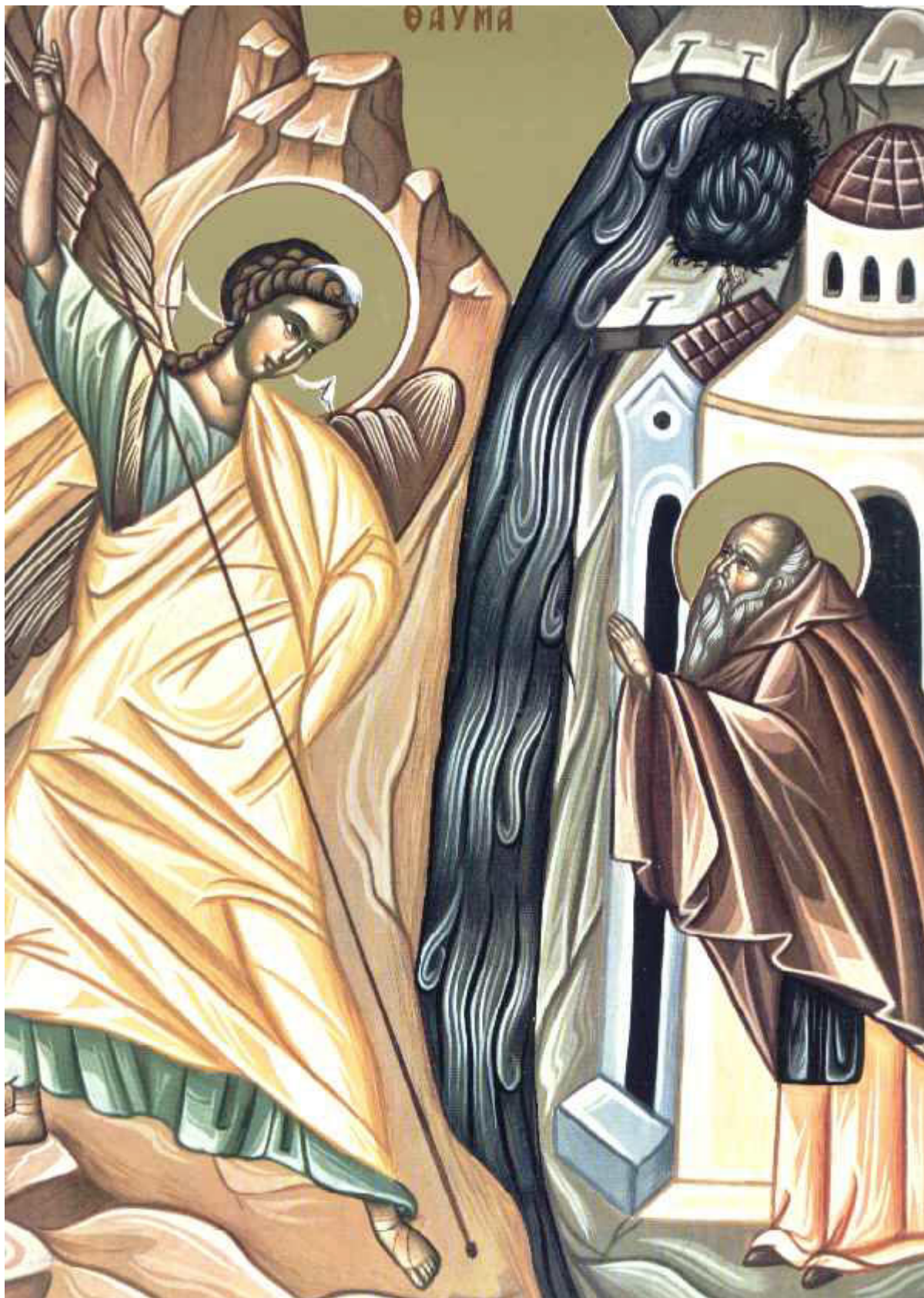
Το θαύμα του Αρχαγγέλου Μιχαήλ στις Χωναίς (ή Κολασσαίς)