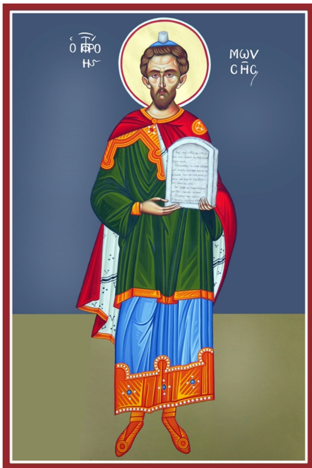
Προφήτης Μωσής ο Θεόπητος - Καζακίδου Μαρία© (byzantineartkazakidou.blogspot.com)