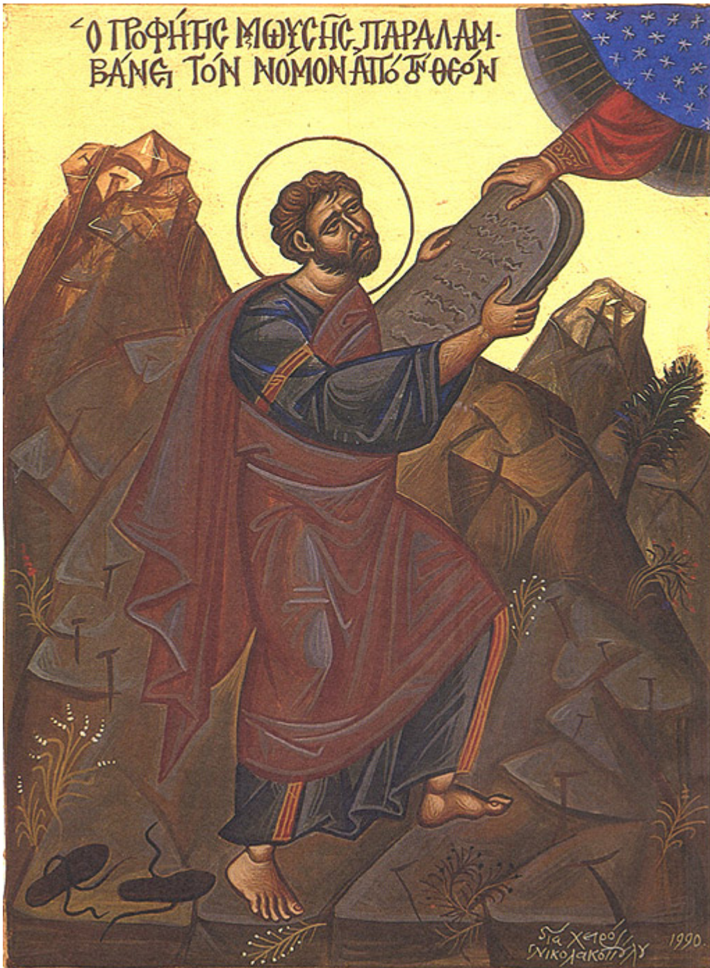
Προφήτης Μωυσής ο Θεόπτης

Ορθοδοξία και Ορθοπραξία / Συναξαριακές Μορφές