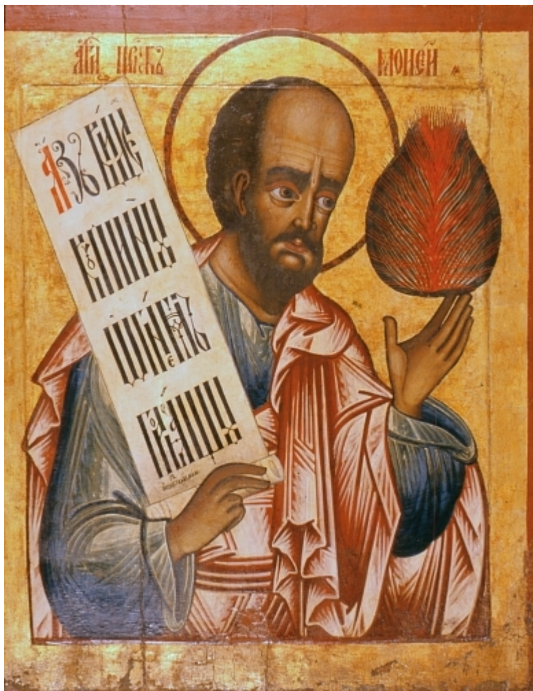
Προφήτης Μωυσής ο Θεόπτης