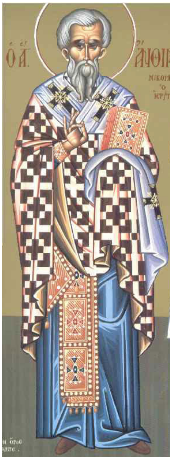
Άγιος Άνθιμος Ιερομάρτυρας επίσκοπος Νικομήδειας