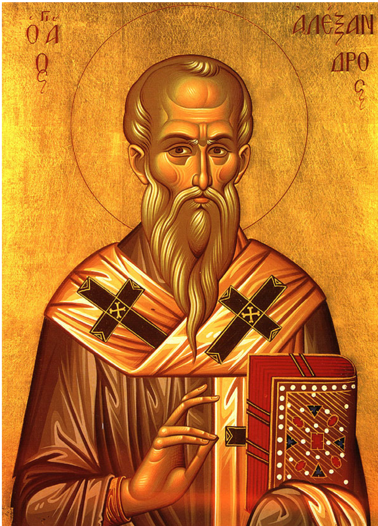
Άγιος Αλέξανδρος Πατριάρχης Κωνσταντινούπολης

Εορτάζει στις 30 Αυγούστου εκάστου έτους.