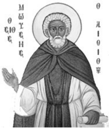
Όσιος Μωσής ο Αιθίοπας