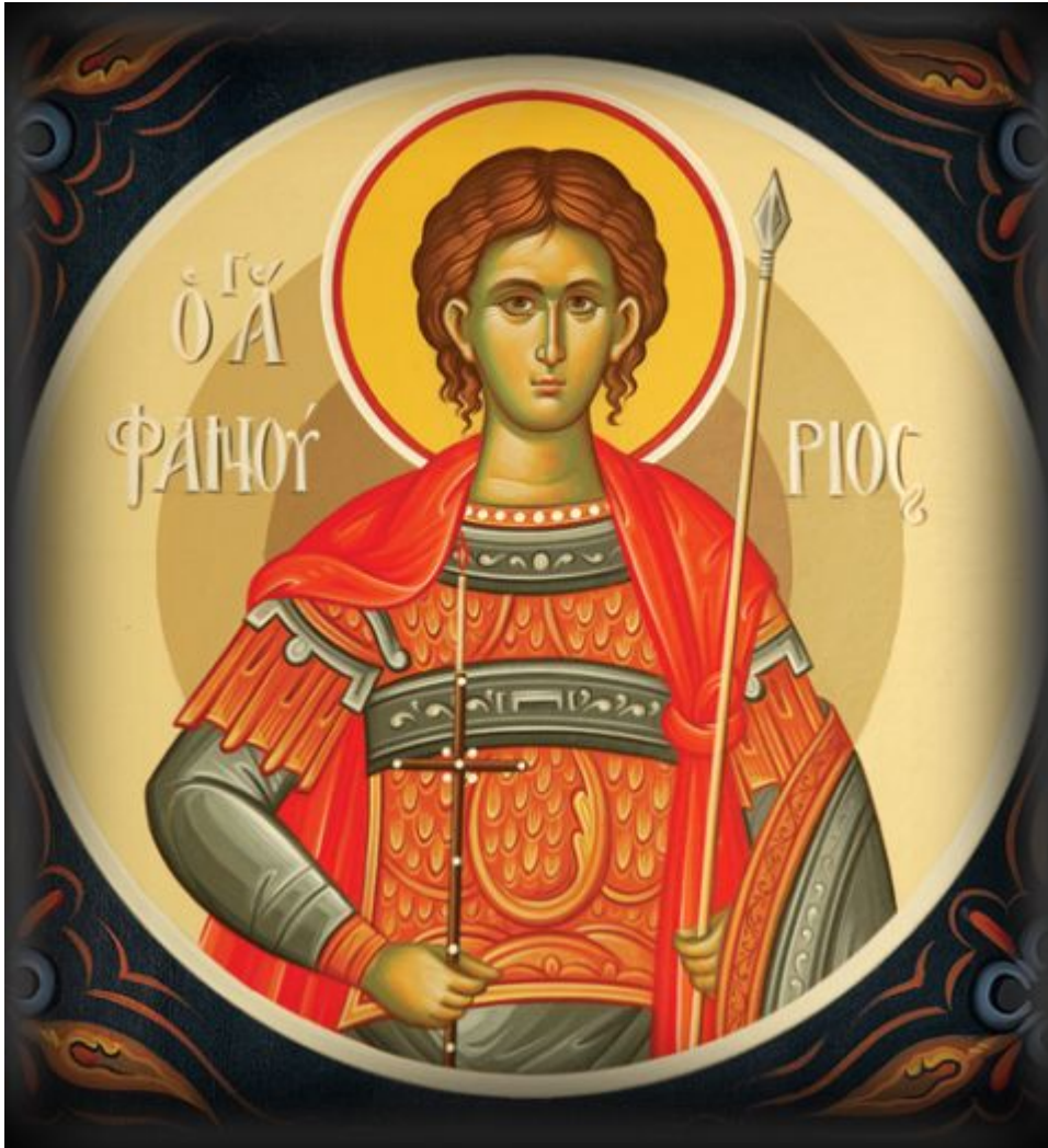
Άγιος Φανούριος ο Νεοφανής, ο Μεγαλομάρτυρας

Ορθοδοξία και Ορθοπραξία / Συναξαριακές Μορφές