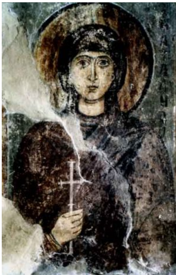
Παλιές τοιχογραφίες των Αγ. Ανδριανού και Ναταλίας, ΑΠΟ ΤΟ Ι.Ν. ΤΗΣ ΑΓΙΑΣ ΣΟΦΙΑΣ ΚΙΕΒΟΥ (ΠΕΡ. 1040-1050)