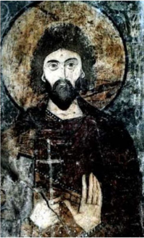
Παλιές τοιχογραφίες των Αγ. Ανδριανού και Ναταλίας, ΑΠΟ ΤΟ Ι.Ν. ΤΗΣ ΑΓΙΑΣ ΣΟΦΙΑΣ ΚΙΕΒΟΥ (ΠΕΡ. 1040-1050)