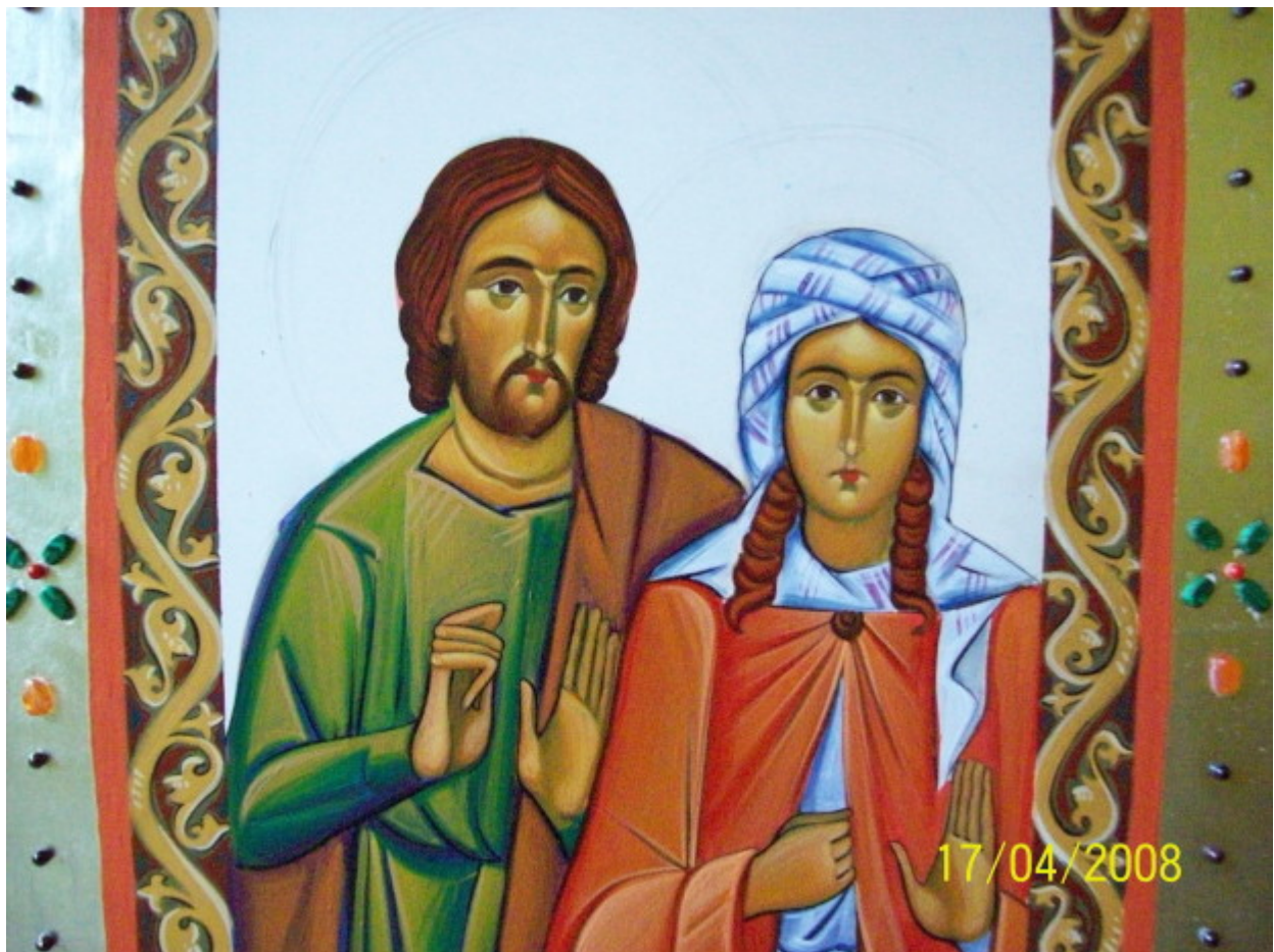
Άγιοι Ανδριανός και Ναταλία