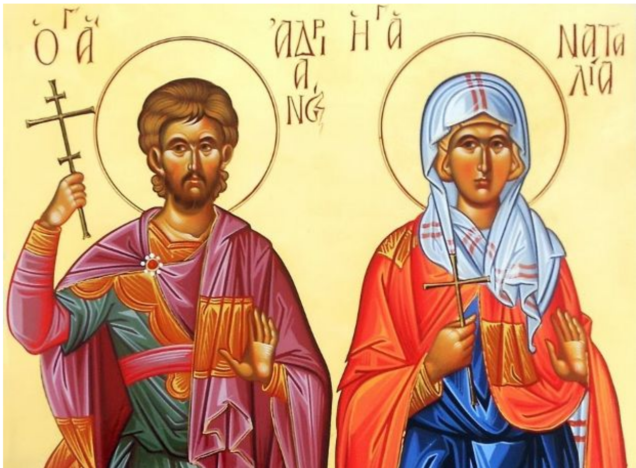
Ἅγιοι Ἀνδριανός και Ναταλία