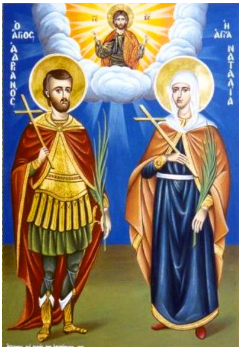
Άγιοι Ανδριανός και Ναταλία