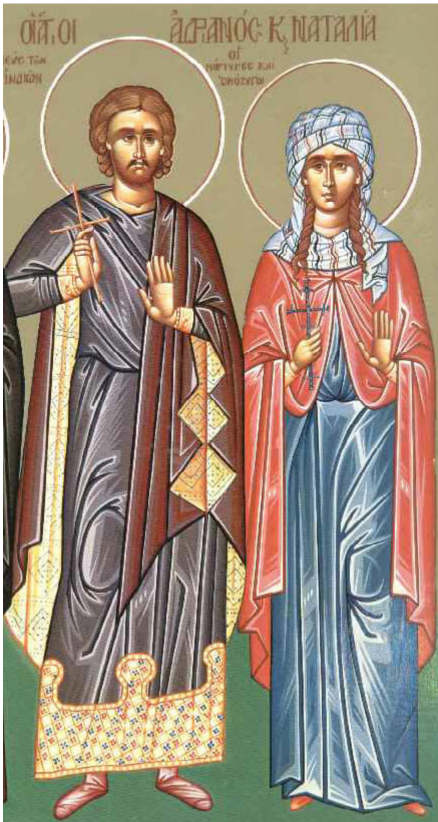
Άγιοι Ανδριανός και Ναταλία

Εορτάζει στις 26 Αυγούστου εκάστου έτους.