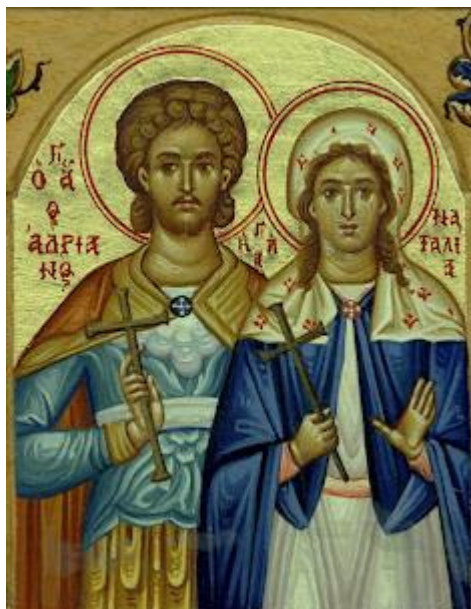
Άγιοι Ανδριανός και Ναταλία