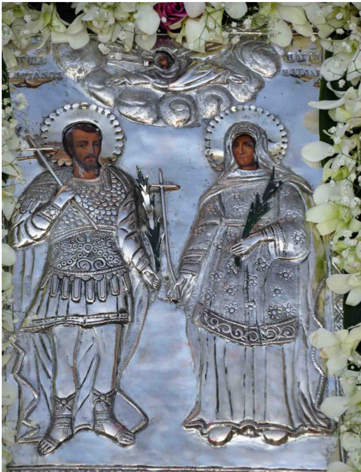
Άγιοι Ανδριανός και Ναταλία