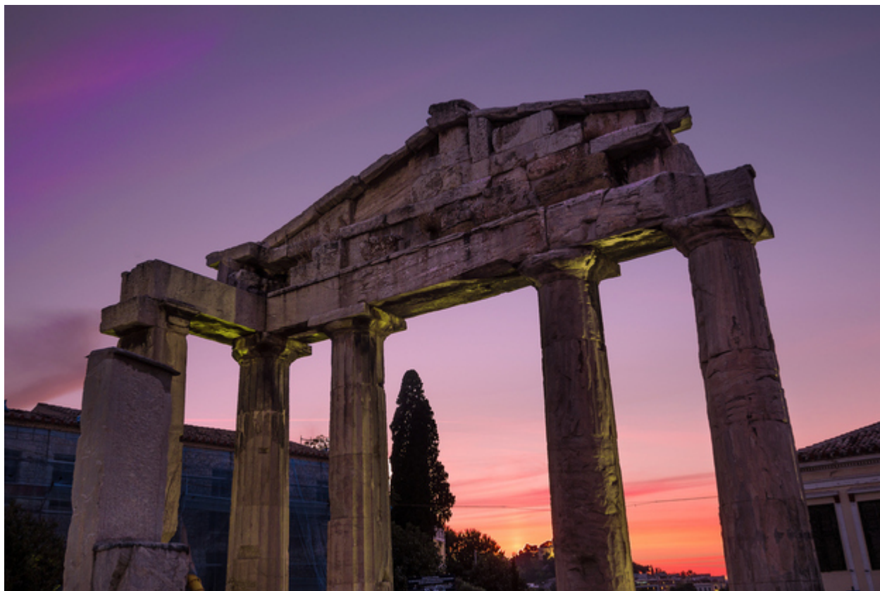
9. Το ίδιο και οι Σταυροφόροι