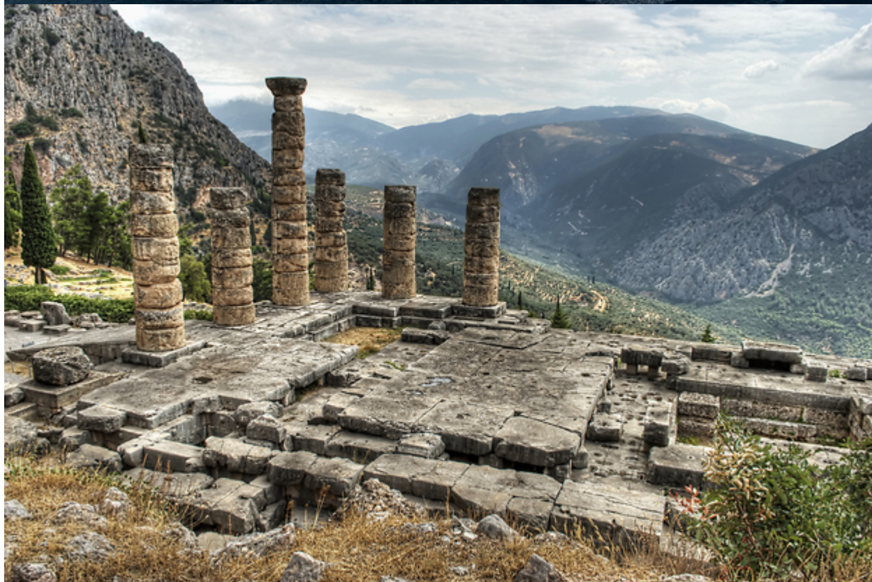
45. Και ο Ποσειδῶνας μέσα από το Αιγαίο