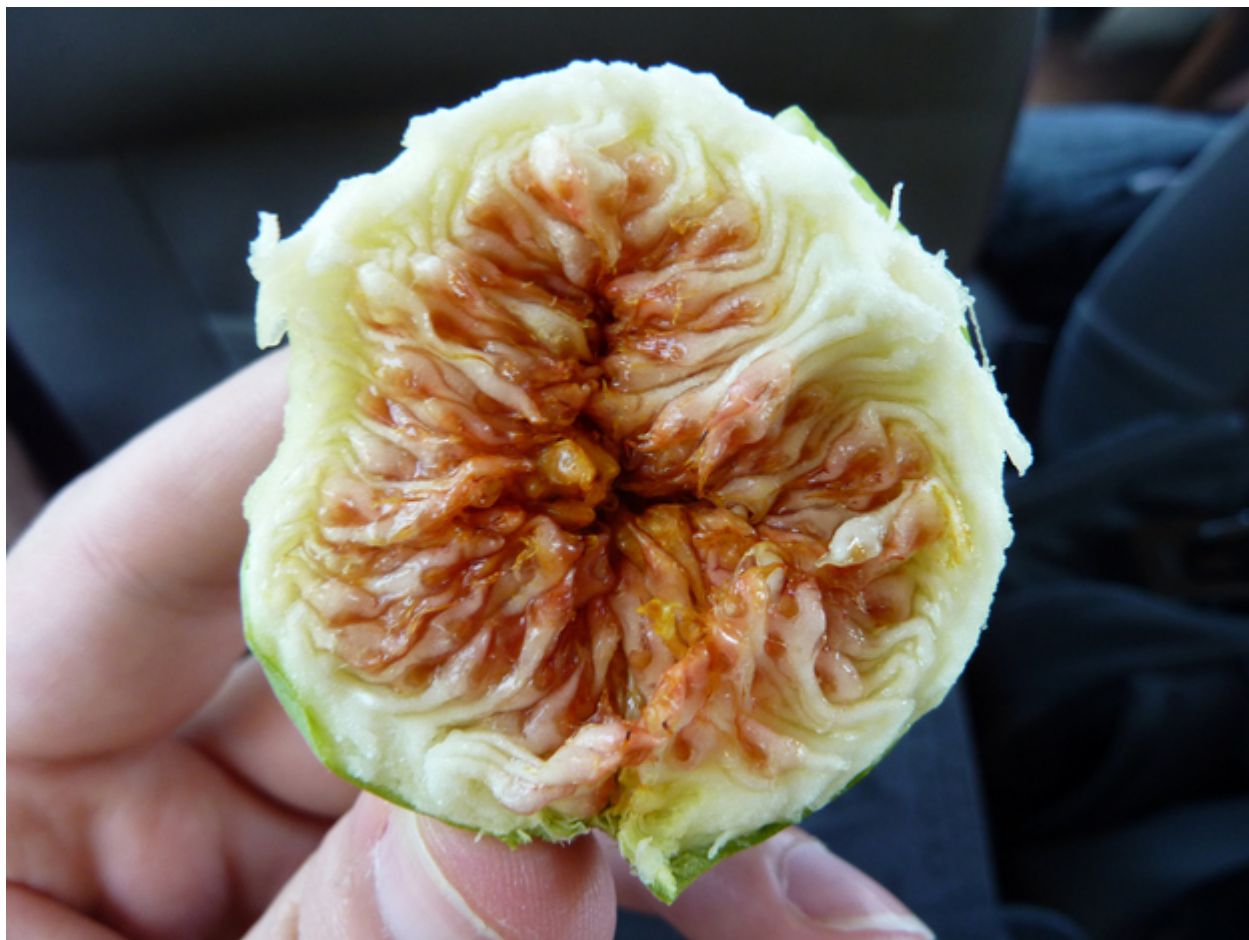
19. Το πρωινό στην Ελλάδα είναι ιδιαίτερο