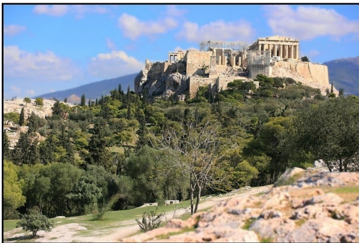
49. Η δημοκρατία «γεννήθηκε» σε αυτόν τον βράχο