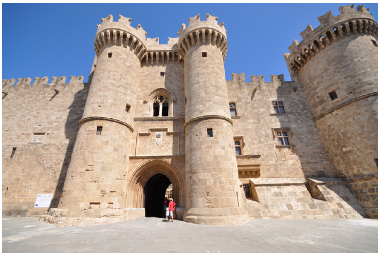
10. Το ίδιο και οι Ενετοί