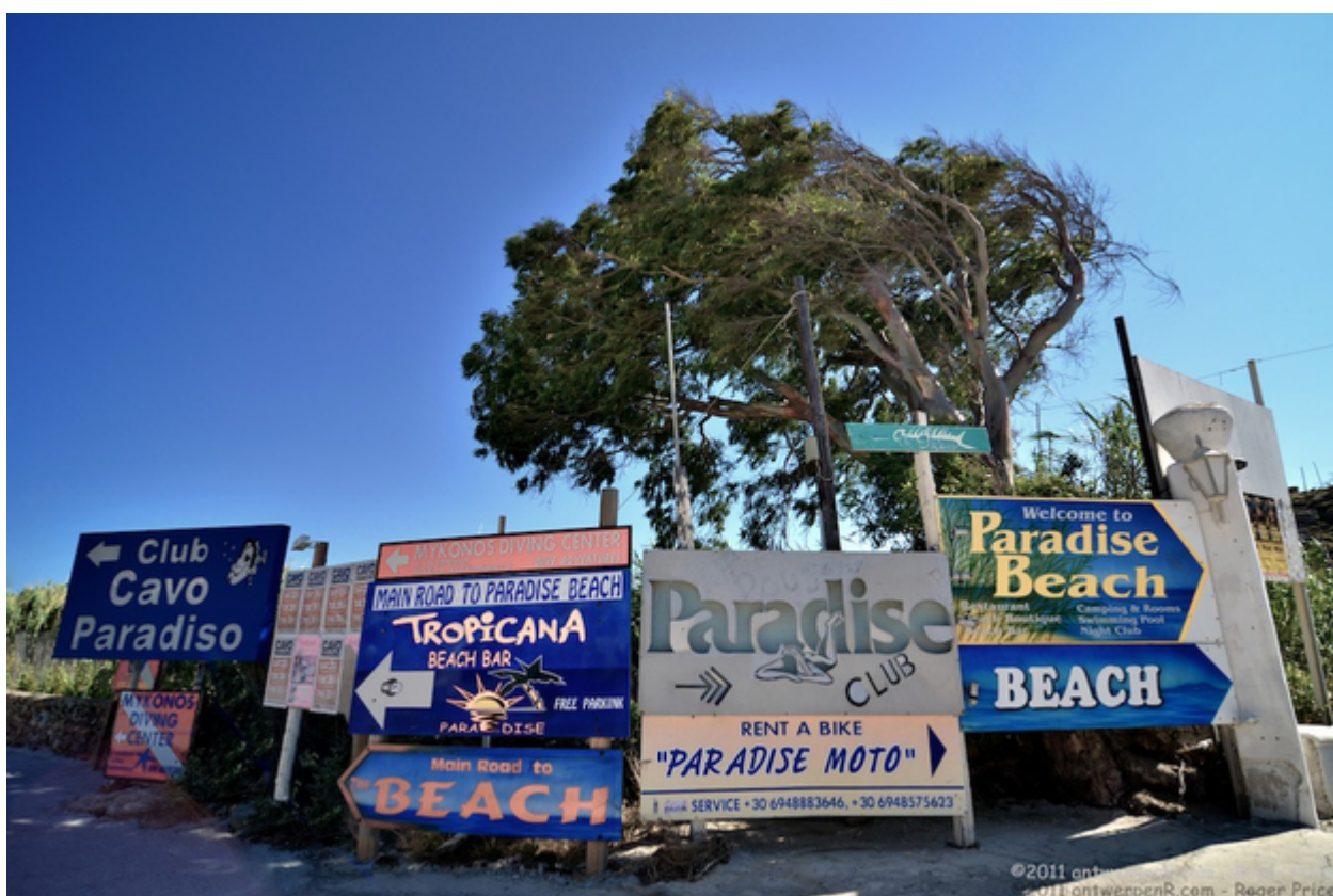
31. Αλλά η Μύκονος δεν είναι μόνο πάρτι