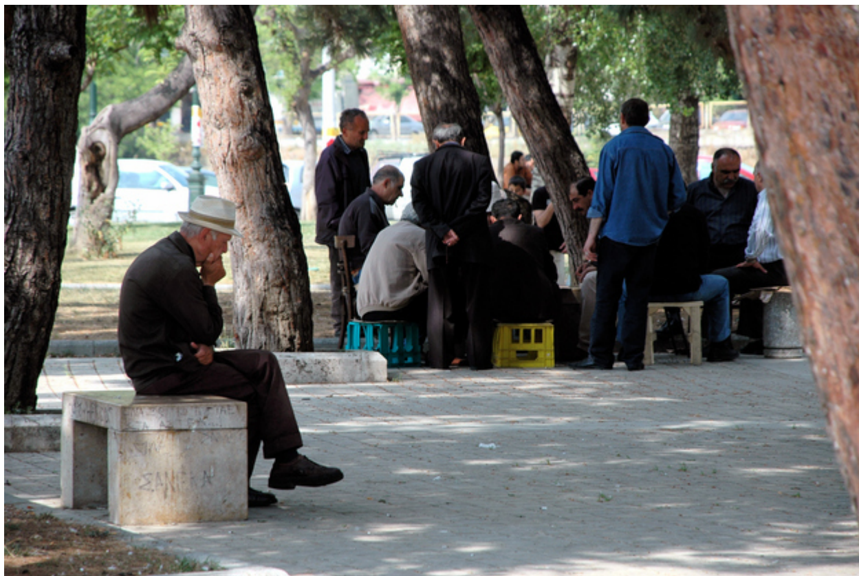
5. Ζουν κοντά στη φύση