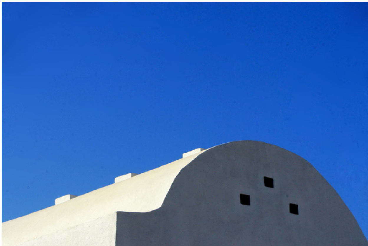
30. Η Μύκονος είναι το μεγαλύτερο beach party του καλοκαιριού