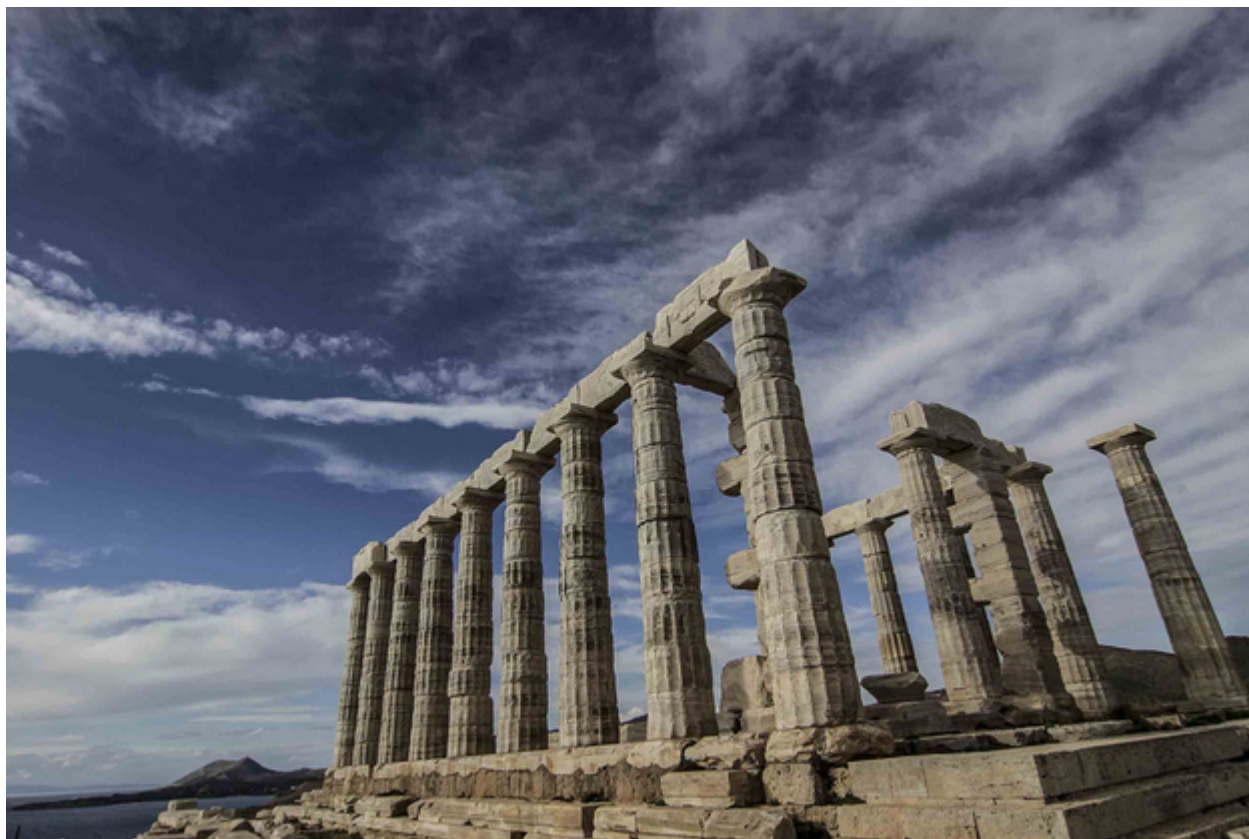
46. Ο Ίκαρος είδε αυτόν τον υπέροχο τόπο από ψηλά