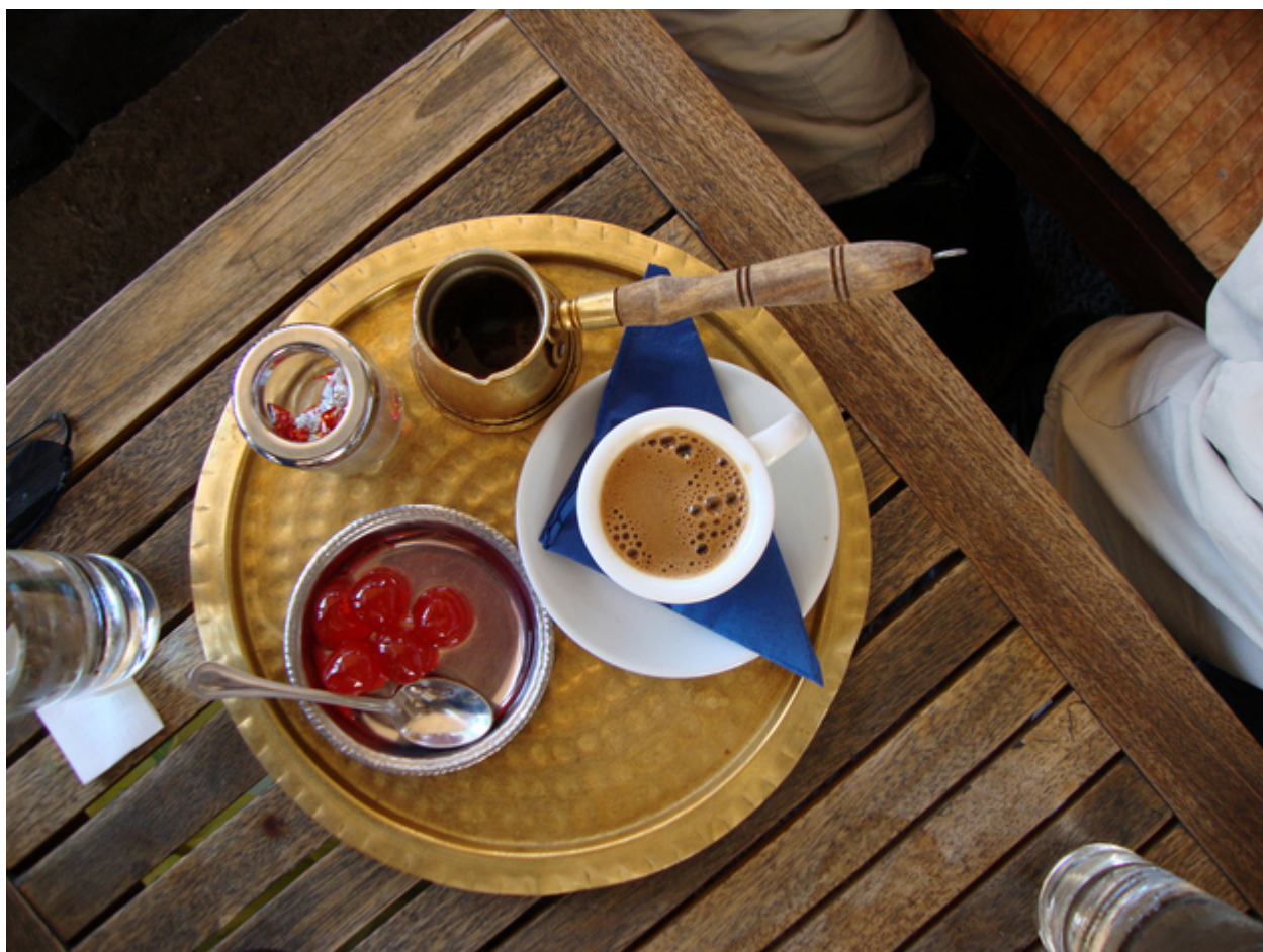
21. Φτιάχνουν τη δική τους μύρα