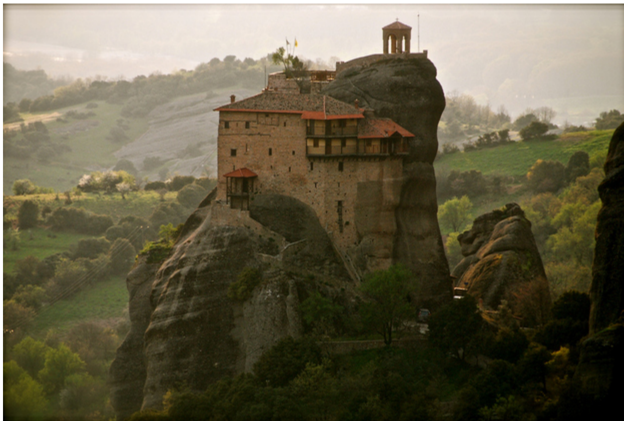
40. Οι Έλληνες έσωσαν τον Δυτικό Πολιτισμό στη χώρα τους