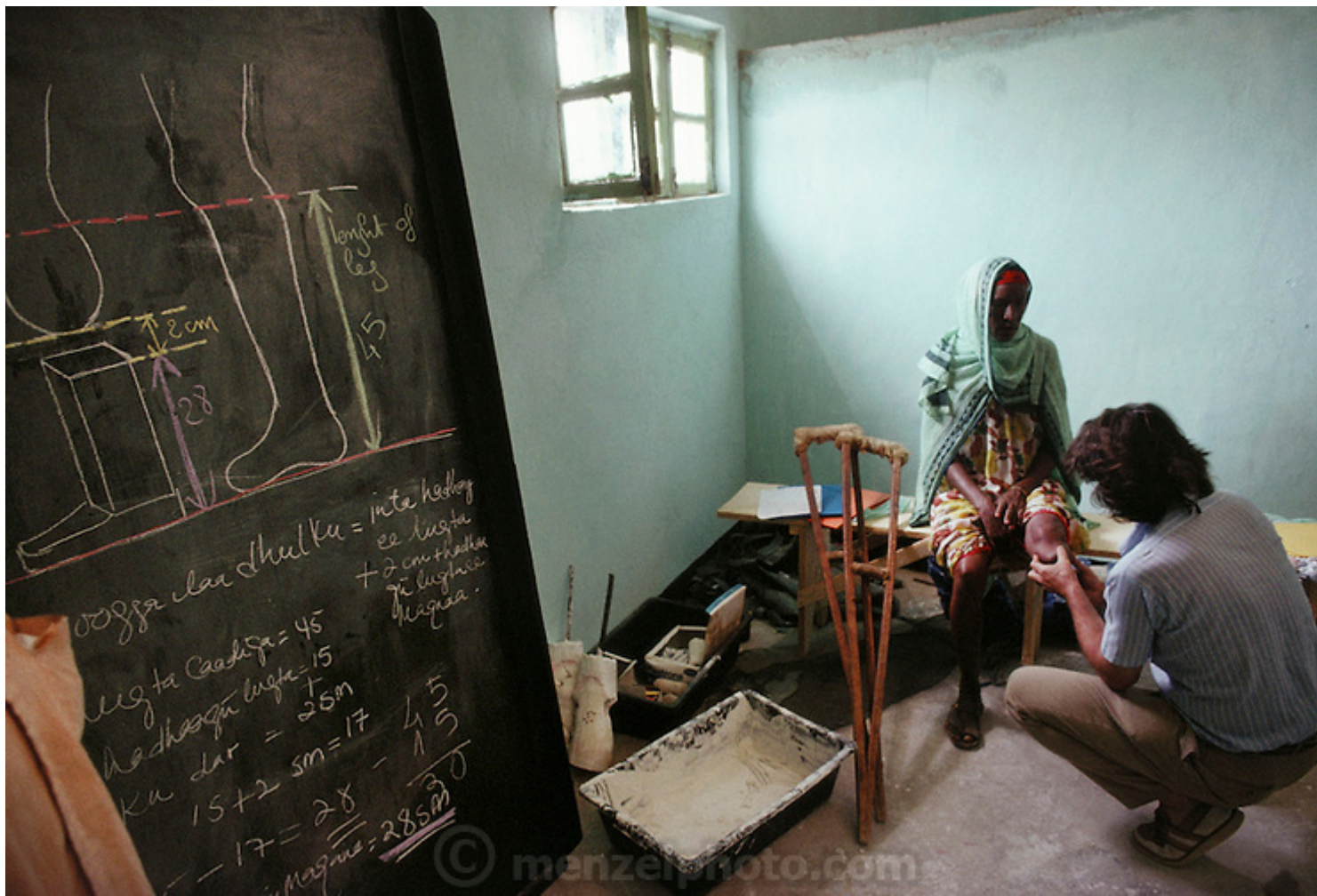
Εξετάζοντας μια 50χρονη γυναίκα από τη Σομαλία που έχασε το πόδι της