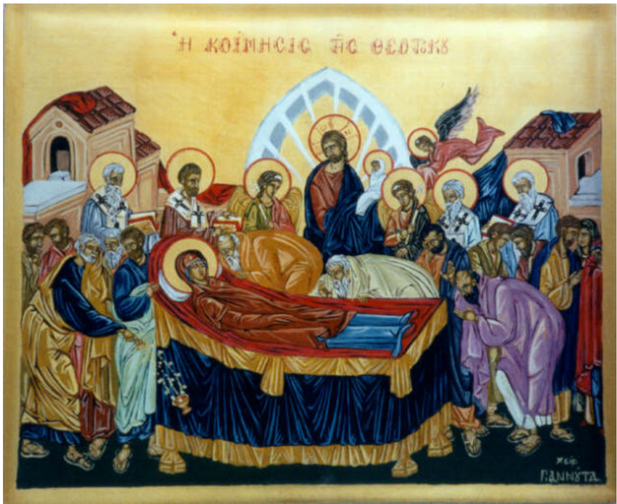
Κοίμηση της Θεοτόκου