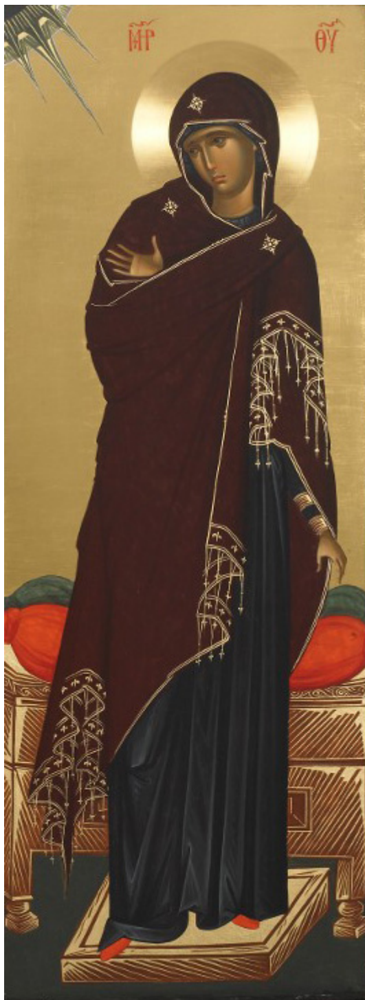
Η Υπεραγία Θεοτόκος - Εικόνα από το Αγιογραφείο της Μονής Βατοπαιδίου