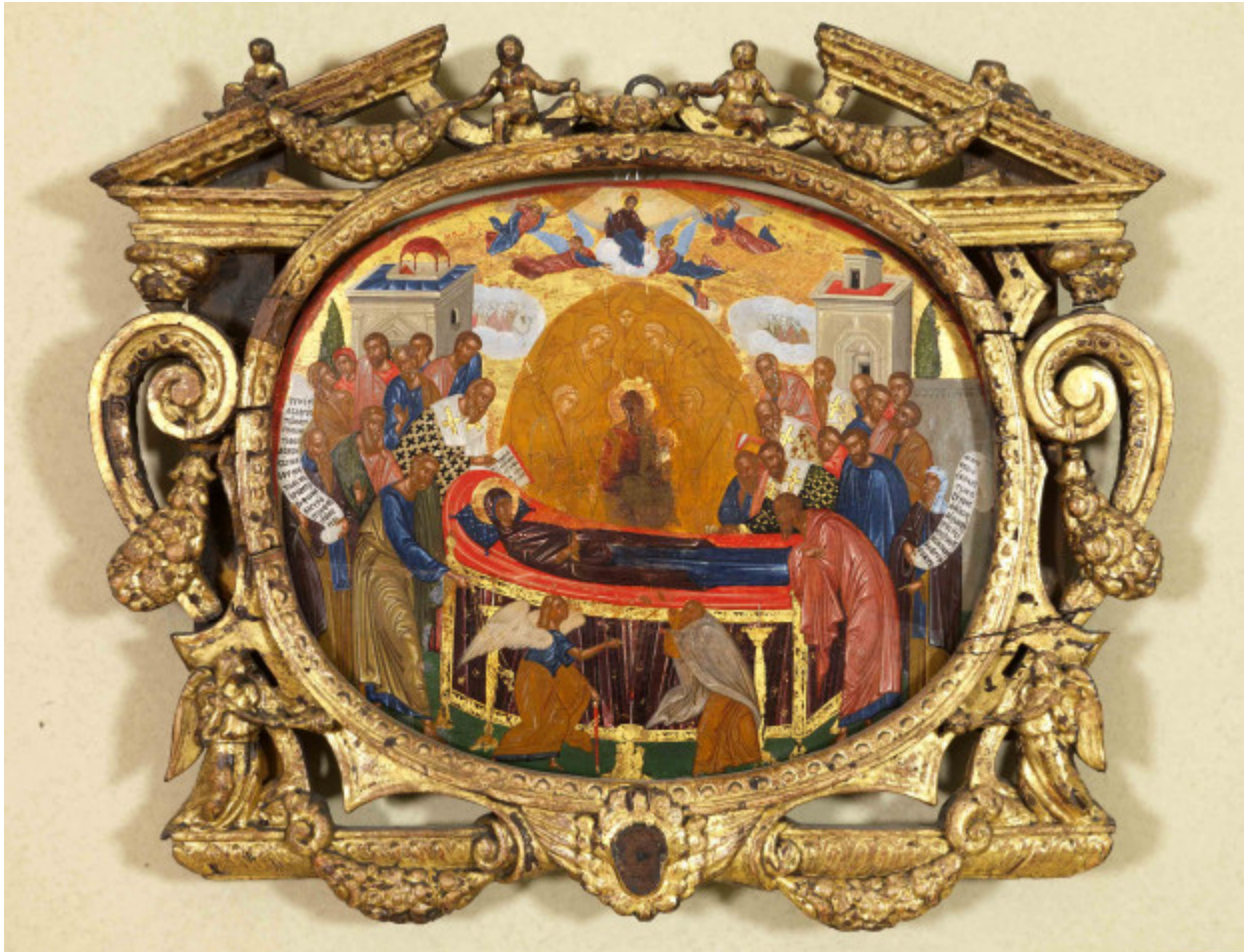
Κοίμηση της Θεοτόκου - άγνωστος ζωγράφος από την Κρήτη, γύρω στο 1600 μ.Χ.