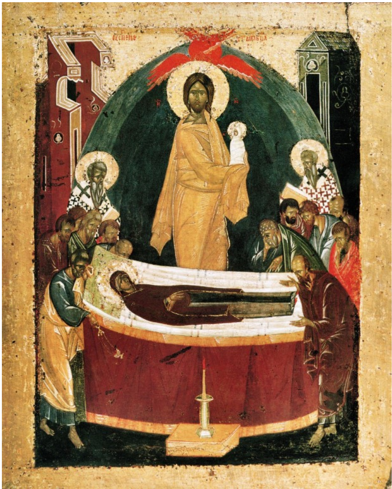
Κοίμηση της Θεοτόκου - Θεοφάνης ο Έλληνας (1392 μ.Χ.)