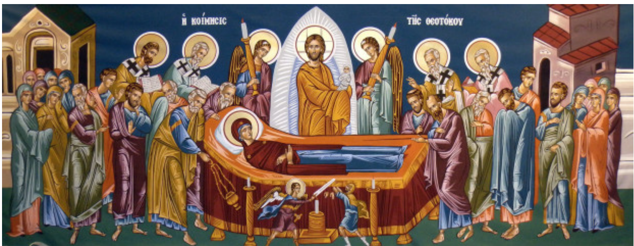
Κοίμηση της Θεοτόκου