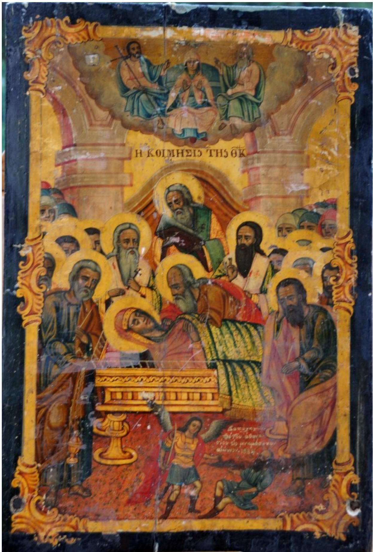
Κοίμηση της Θεοτόκου - Ι.Ν. Ζωοδόχου Πηγής, Λαρίσης