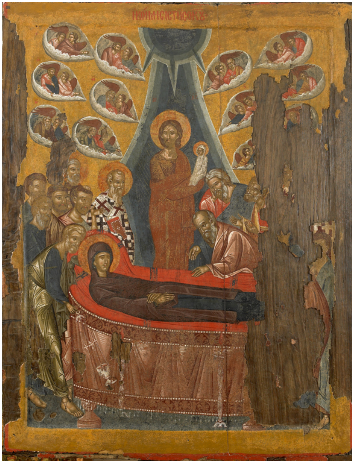
Κοίμηση της Θεοτόκου - Φορητή εικόνα Ι.Μ. Βατοπαιδίου, 15ος αι.