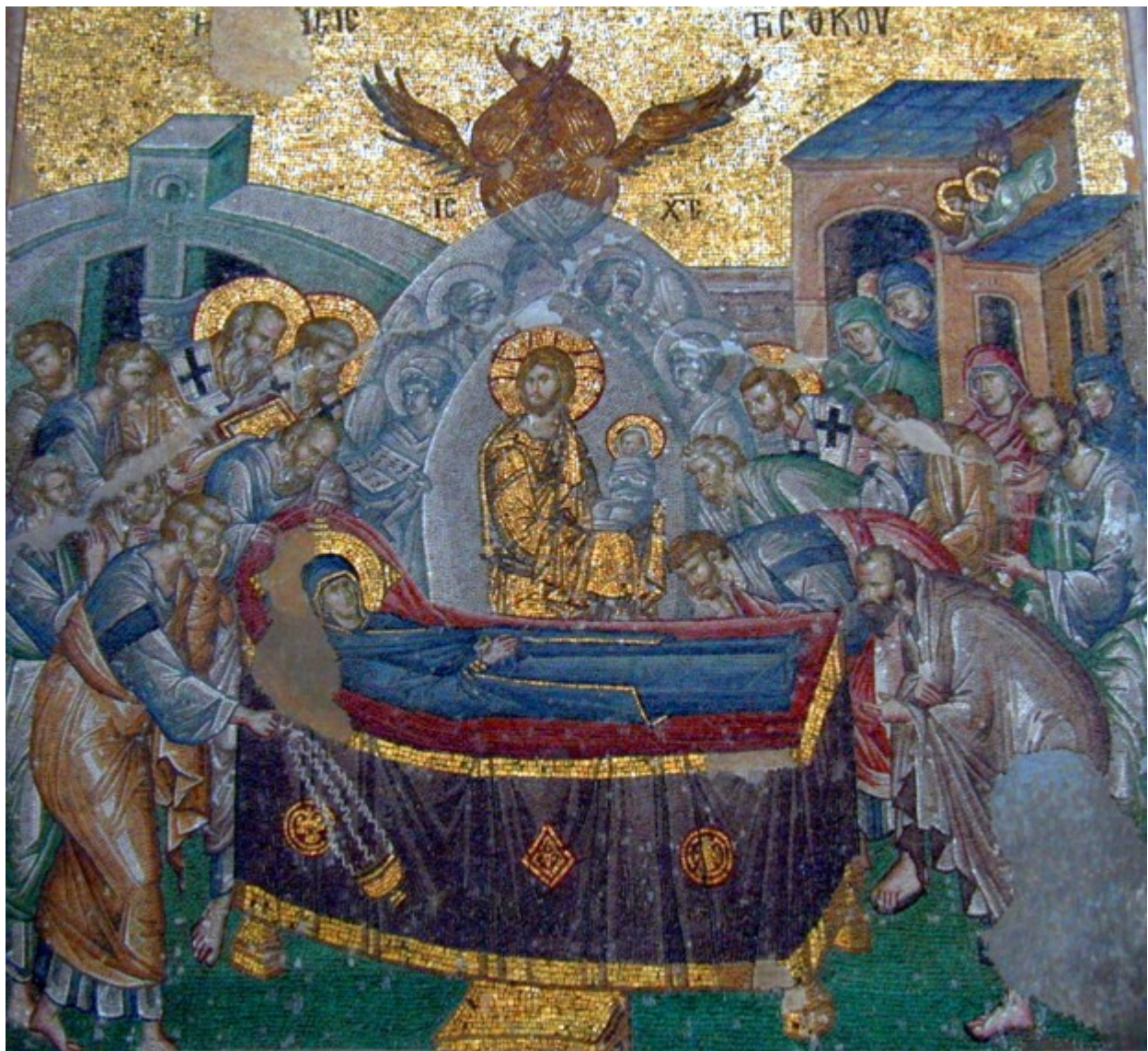
Κοίμηση της Θεοτόκου - Ψηφιδωτό από τη Μονή της Χώρας στην Κωνσταντινούπολη