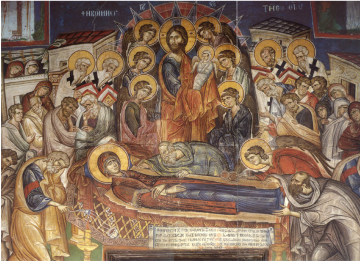
Κοίμηση της Θεοτόκου - Τοιχογραφία καθολικού Ι.Μ. Βατοπαιδίου (1312 μ.Χ.)

Ορθοδοξία και Ορθοπραξία / Συναξαριακές Μορφές