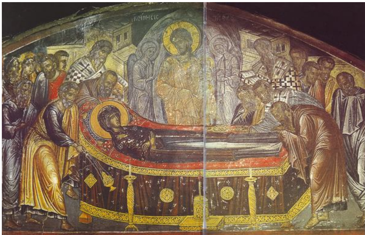
Κοίμηση της Θεοτόκου