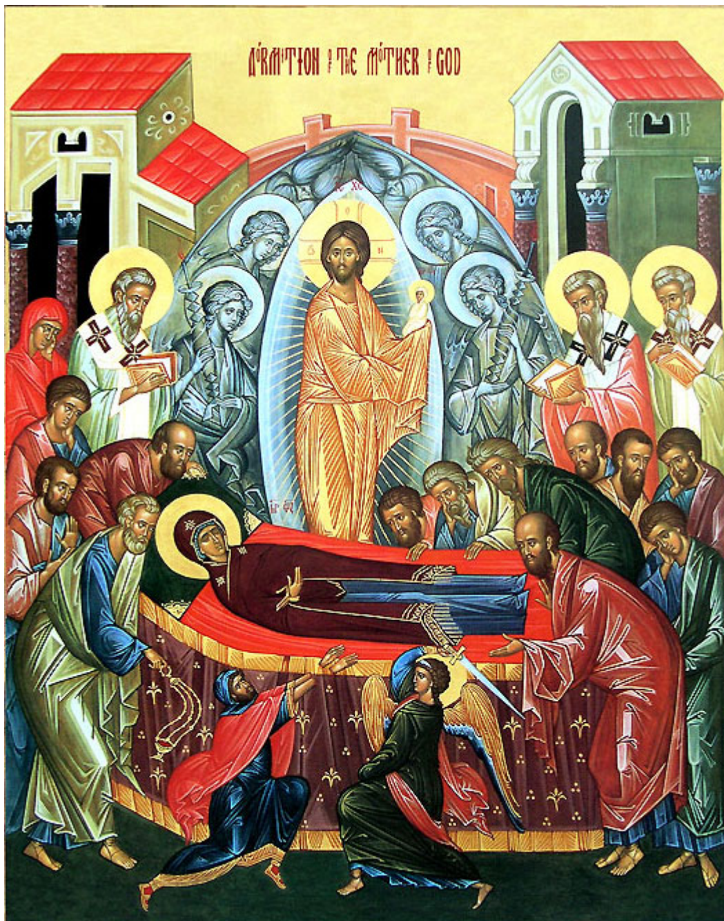
Κοίμηση της Θεοτόκου