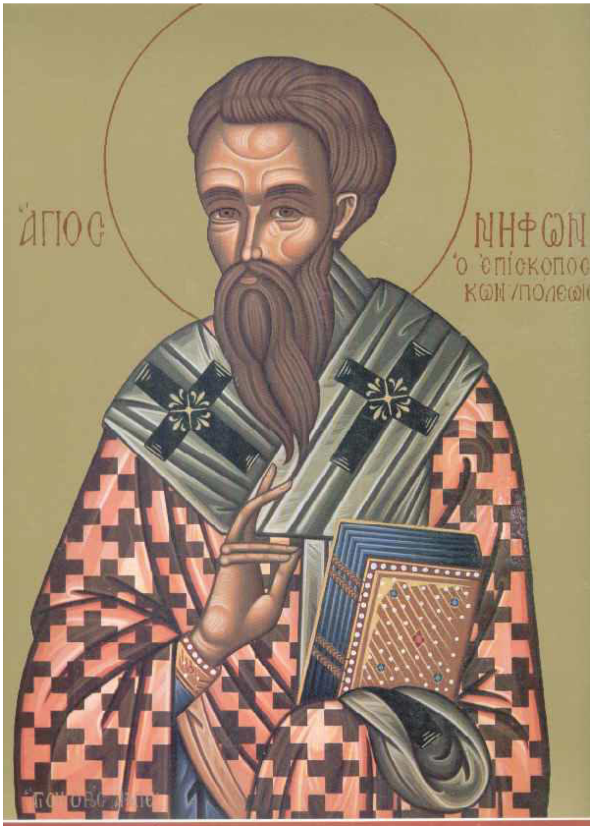
Άγιος Νήφων Πατριάρχης Κωνσταντινούπολης