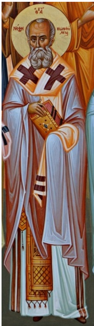
Άγιος Νήφων Πατριάρχης Κωνσταντινούπολης