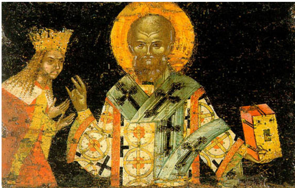
Ο Άγιος Νήφων Πατριάρχης Κωνσταντινούπολης και ο βοεβόδας της Βλαχίας Νεάγκοε Μπασαράμπ (1512 - 1521 μ.Χ.), κτήτορας της Μονής Διονυσίου - α' τέταρτο 16ου αι. μ.Χ. - Μονή Διονυσίου, Άγιον Όρος