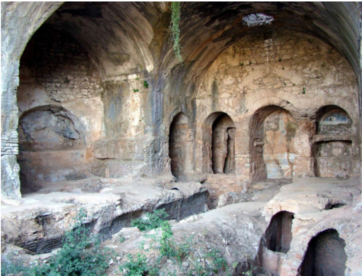
Το σπήλαιο των Επτά Παίδων στην Ἐφεσο