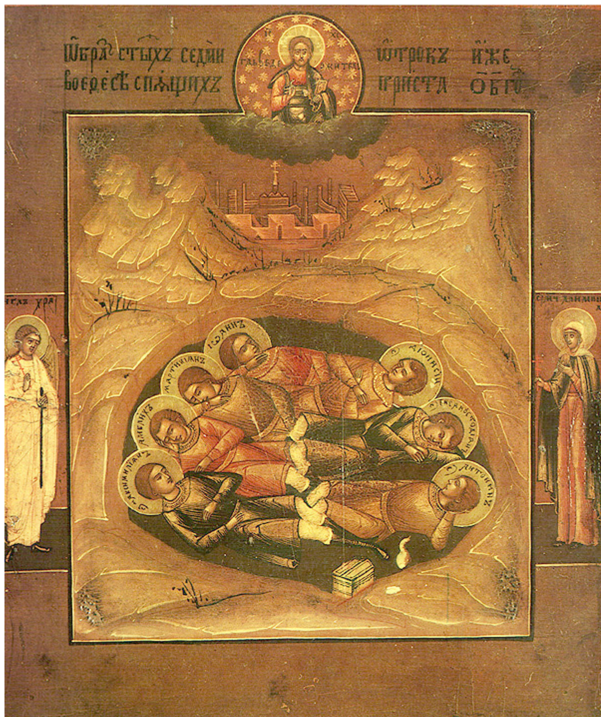
Άγιοι Επτά Παῖδες εν Εφέσω