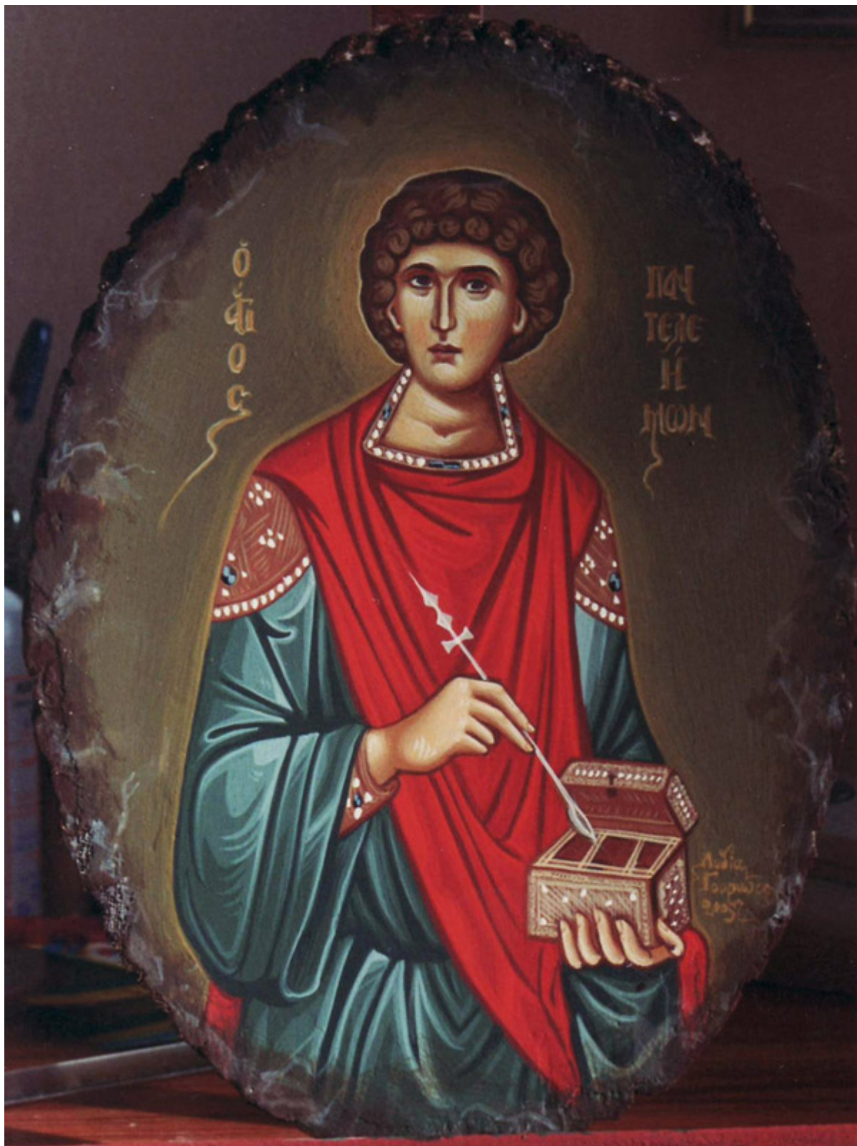
Άγιος Παντελεήμων ο Μεγαλομάρτυς και Ιαματικός - Λυδία Γουριώτη© ( lydiagourioti-iconography.blogspot.gr )

Άγιος Παντελεήμων ο Μεγαλομάρτυς και Ιαματικός Άγιος Παντελεήμων ο Μεγαλομάρτυς και Ιαματικός