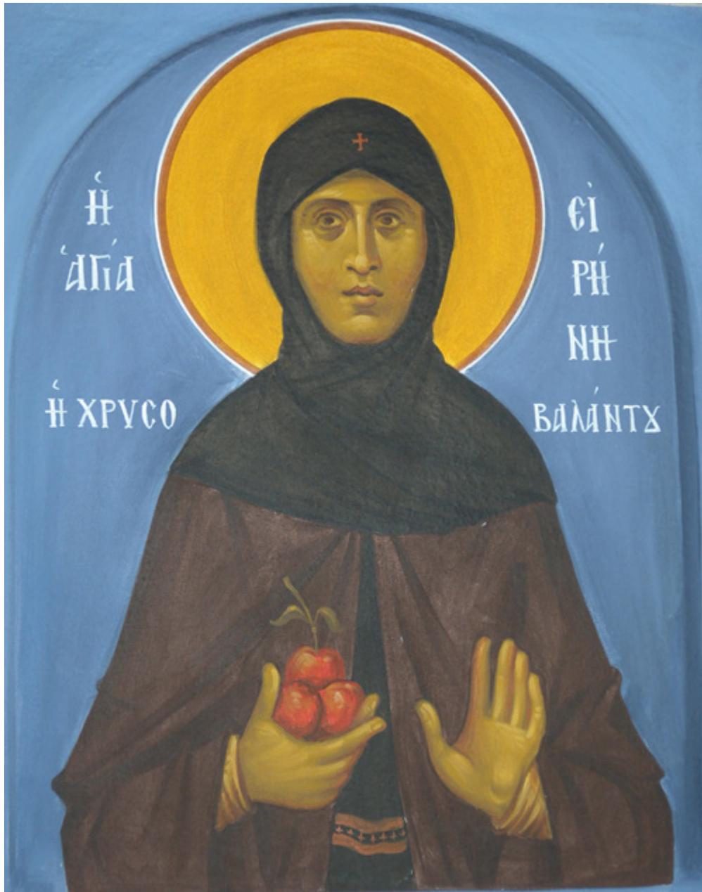
Οσία Ειρήνη η Χρυσοβαλάντου - Ι. Ν. Οσίων Παρθενίου και Ευμενίου των εν Κουδουμά, δια χειρός Παναγιώτη Μόσχου (2006 μ.Χ.)