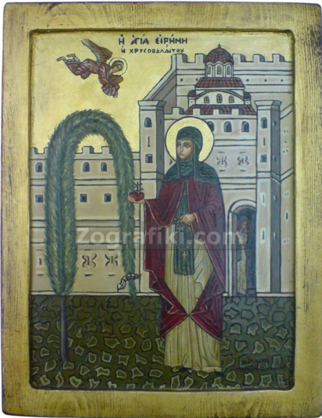
Οσία Ειρήνη η Χρυσοβαλάντου