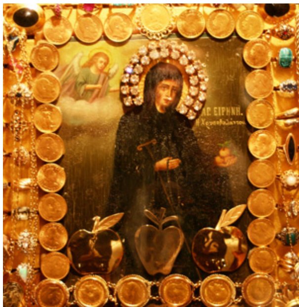
Η θαυματουργική εικόνα της Αγίας Ειρήνης Χρυσοβαλάντου στην Αστόρια της Νέας Υόρκης