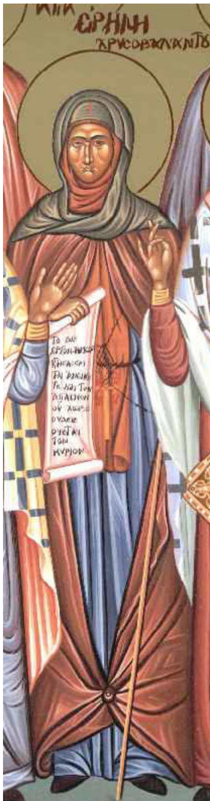
Οσία Ειρήνη η Χρυσοβαλάντου