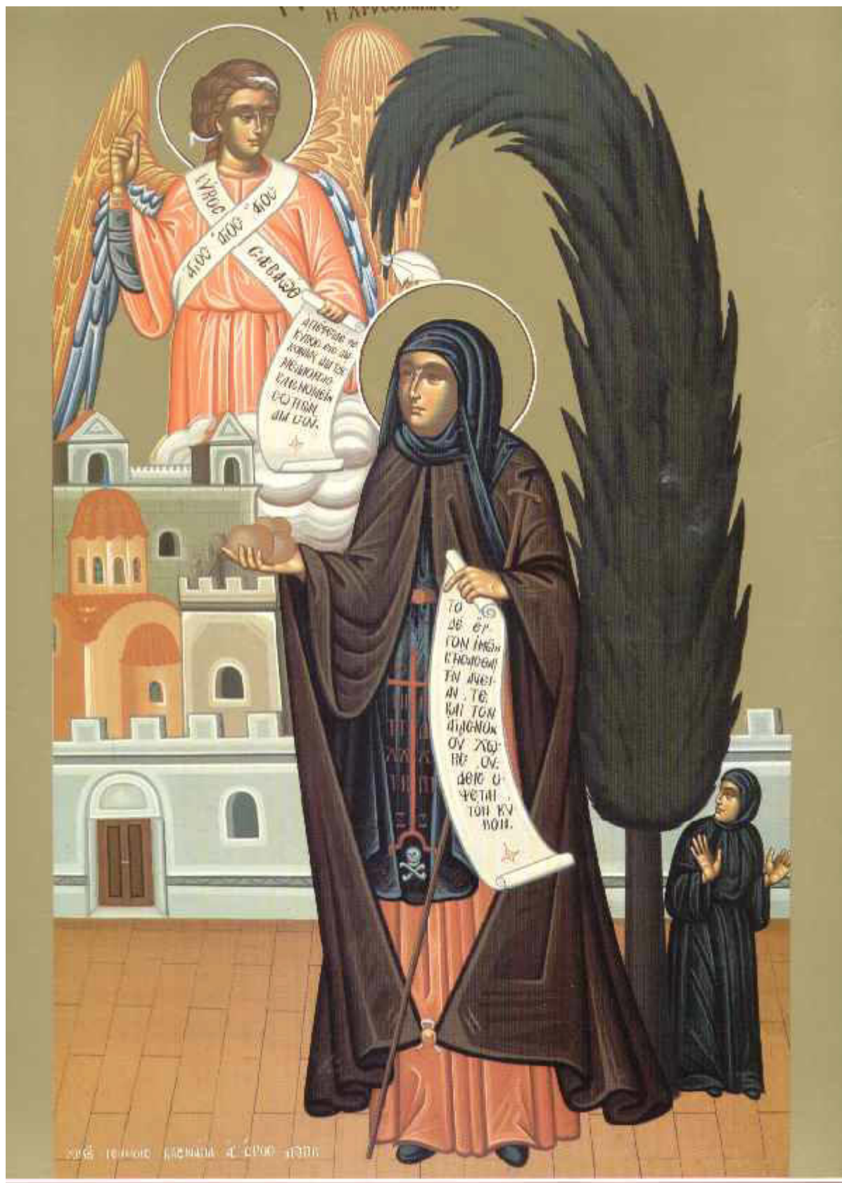
Οσία Ειρήνη η Χρυσοβαλάντου