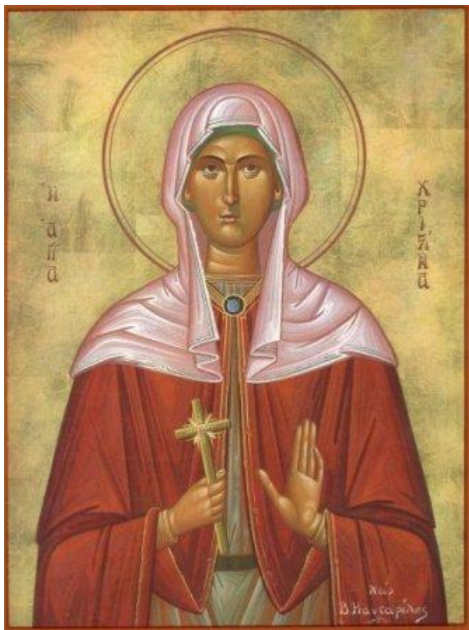
Αγία Χριστίνα η μεγαλομάρτυς