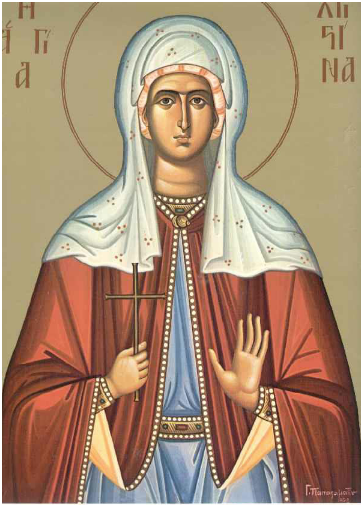
Αγία Χριστίνα η μεγαλομάρτυς