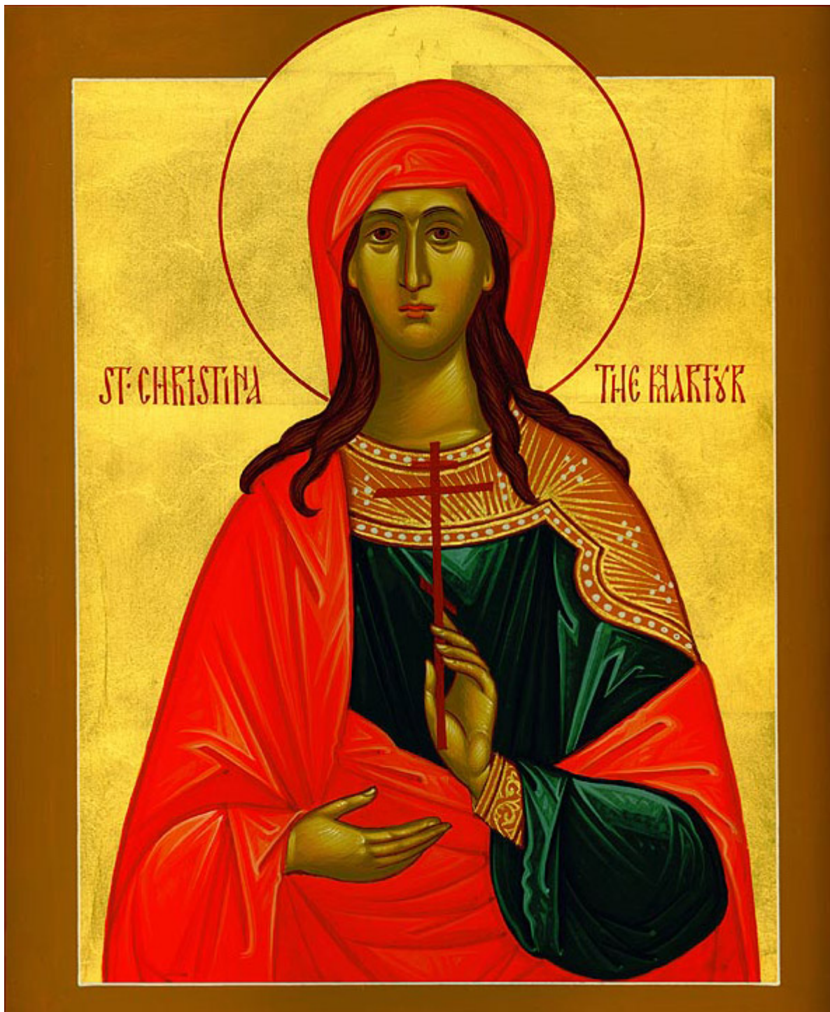
Αγία Χριστίνα η μεγαλομάρτυς