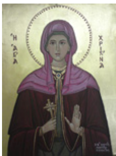
Αγία Χριστίνα η μεγαλομάρτυς -