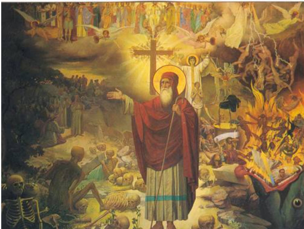
Το Ὁραμα του Προφήτη Ἰεζεκιήλ