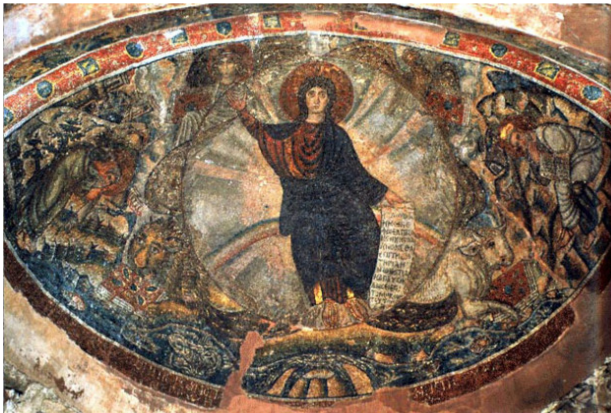
Το Όραμα του Προφήτη Ιεζεκιήλ, ψηφιδωτό στον Όσιο Δαβίδ της Θεσσαλονίκης, β΄ μισό 5ου αι. μ.Χ. – Το ψηφιδωτό απεικονίζει το όραμα του Ιεζεκιήλ, με το Χριστό Εμμανουήλ (νεαρό) στο κέντρο να κάθεται σε πολύχρωμο τόξο. Γύρω του εικονίζονται τα σύμβολα των τεσσάρων Ευαγγελιστών και στην αριστερή γωνία ο προφήτης Ιεζεκιήλ στις όχθες του ποταμού Χοβάρ και στη δεξιά ο προφήτης Αββακούμ ή ο Ησαΐας.