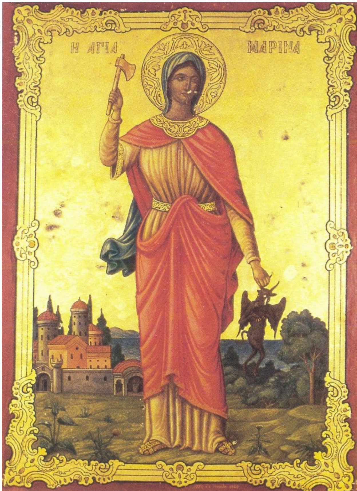
Η παλαιά εφέστια εικόνα της Αγίας Μαρίας από τον ναόν του Θησείου χωρίς το σφυρήλατο, χρυσό κάλυμμα της