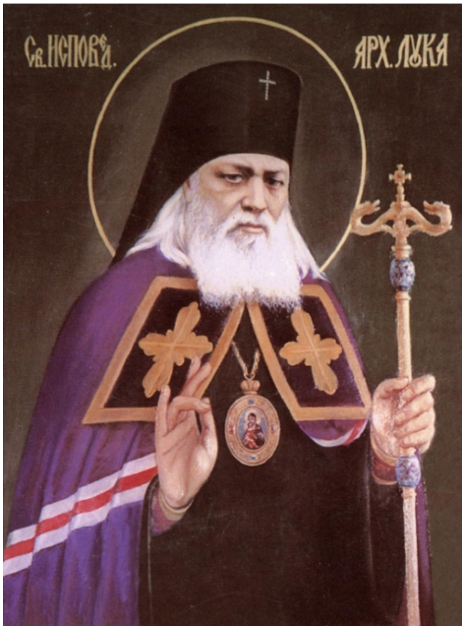
Ο άγιος Λουκάς ο Ιατρός Επίσκοπος Συμφερουπόλεως της Κριμαίας