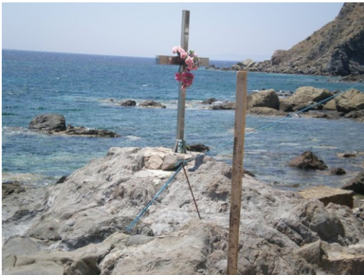
Αγία Μαρκέλλα. Ο βράχος του μαρτυρίου στη Χίο.

οφειλόμενο σεβασμό στο μεγαλείο και τον ηρωισμό της, αλλά και για να ζητήσουν τη θαυματουργική της χάρη για την επίλυση σωματικών και ψυχικών ασθενειών. Η Αγία Μαρκέλλα γεννήθηκε και μεγάλωσε στη Βολισσό, στο ιστορικό αυτό κεφαλοχώρι της βορειοδυτικής Χίου. Για τον χρόνο της γέννησης, της ζωής και του μαρτυρίου της Αγίας υπάρχει σύγχυση και ασάφεια μεταξύ των βιογράφων. Σύμφωνα με τον βιογράφο της, Όσιο Νικηφόρο τον Χίο, η Αγία Μαρκέλλα έζησε και ήκμασε περί το 1500. Ο πατέρας της ήταν ειδωλολάτρης και η χριστιανή μητέρα της απεβίωσε σε νεαρά ηλικία. Η Μαρκέλλα διακρίθηκε από νωρίς για τη βαθιά της πίστη και αγάπη στον Χριστό, την καλοσύνη και αγνότητά της, τη σεμνότητα και την ευγένεια της ψυχής της. Προικισμένη με θεϊκή σοφία και αμέτρητα ψυχικά χαρίσματα επικοινωνούσε αδιάκοπα με τον Θεό. Αυτόν τον «επίγειο άγγελο» φθόνησε ο εωσφόρος και θέλησε να την πολεμήσει με κάθε μέσο.