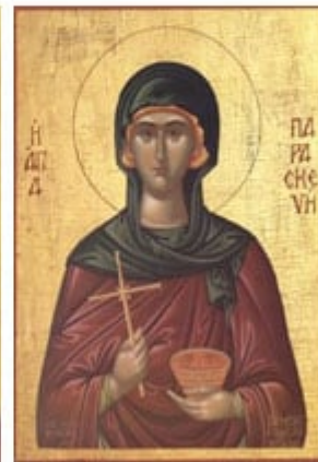
ΑΓΙΑ ΠΑΡΑΣΚΕΥΗ 26 Ιουλίου