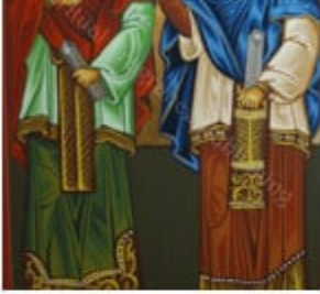
ΑΓ. ΚΟΣΜΑΣ & ΔΑΜΙΑΝΟΣ 1 Ιουλίου