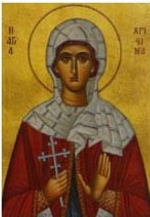
ΑΓΙΑ ΧΡΙΣΤΙΝΑ 24 Ιουλίου