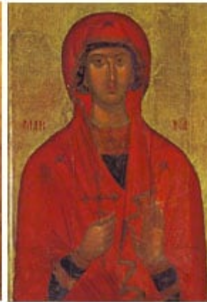
ΑΓΙΑ ΜΑΡΙΝΑ 17 Ιουλίου