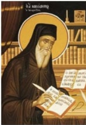
ΑΓ. ΝΙΚΟΔΗΜΟΣ ΑΓΙΟΡΕΙΤΗΣ 14 Ιουλίου