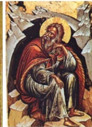
ΠΡΟΦΗΤΗΣ ΗΛΙΑΣ 20 Ιουλίου