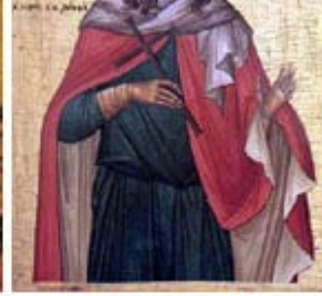
ΑΓΙΑ ΚΥΡΙΑΚΗ 7 Ιουλίου