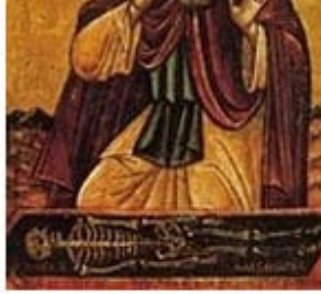
ΑΓΙΟΣ ΣΙΣΩΗΣ 6 Ιουλίου