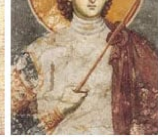
ΑΓΙΟΣ ΠΡΟΚΟΠΙΟΣ 8 Ιουλίου