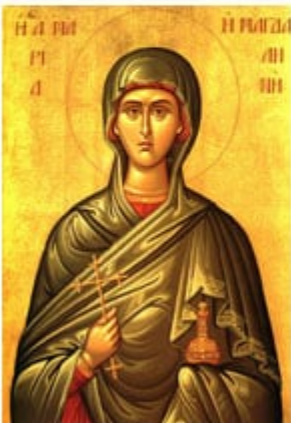
ΑΓ. ΜΑΡΙΑ ΜΑΓΔΑΛΗΝΗ 22 Ιουλίου