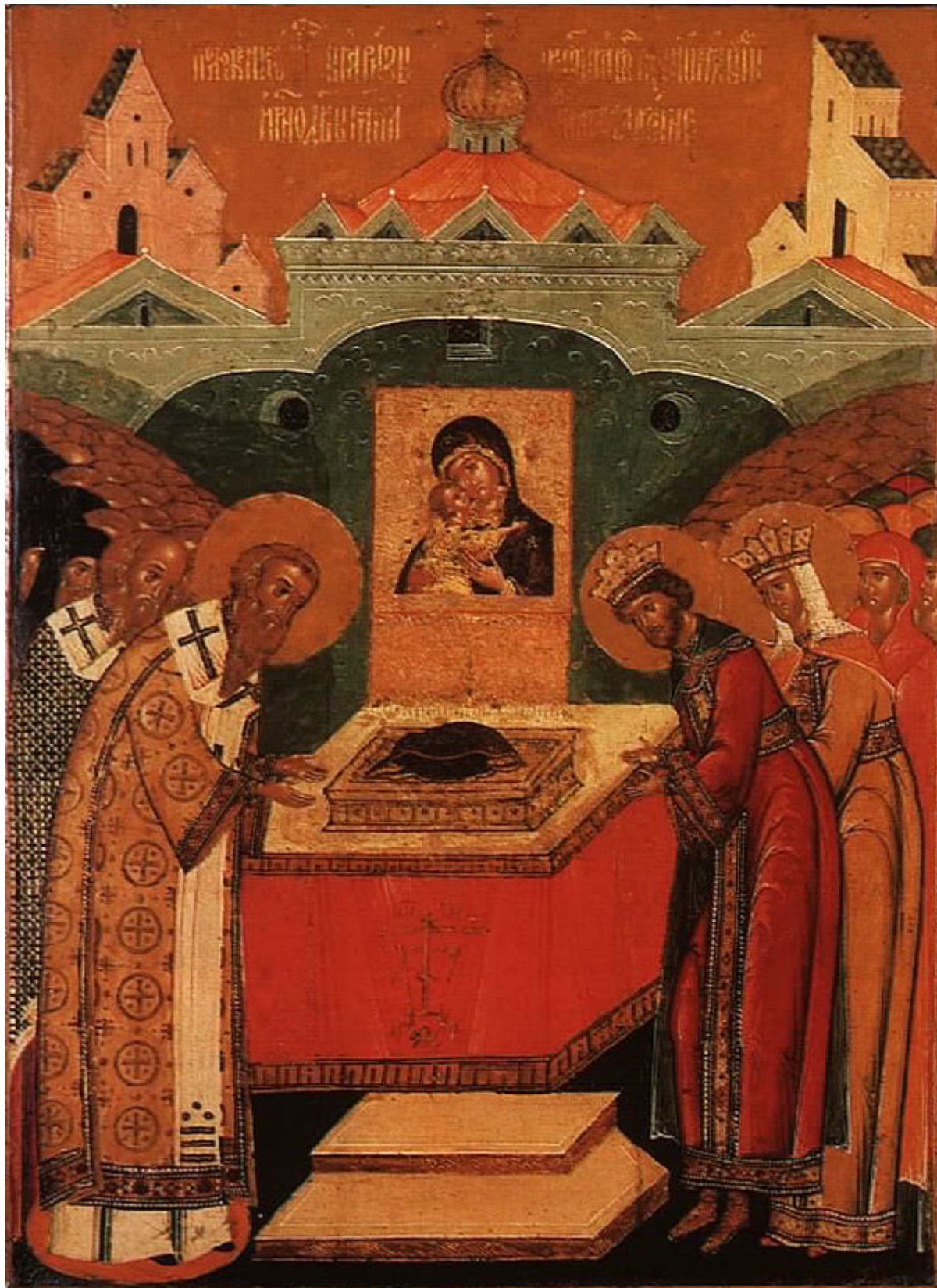
Κατάθεσις της Τιμίας Εσθήτος της Θεοτόκου