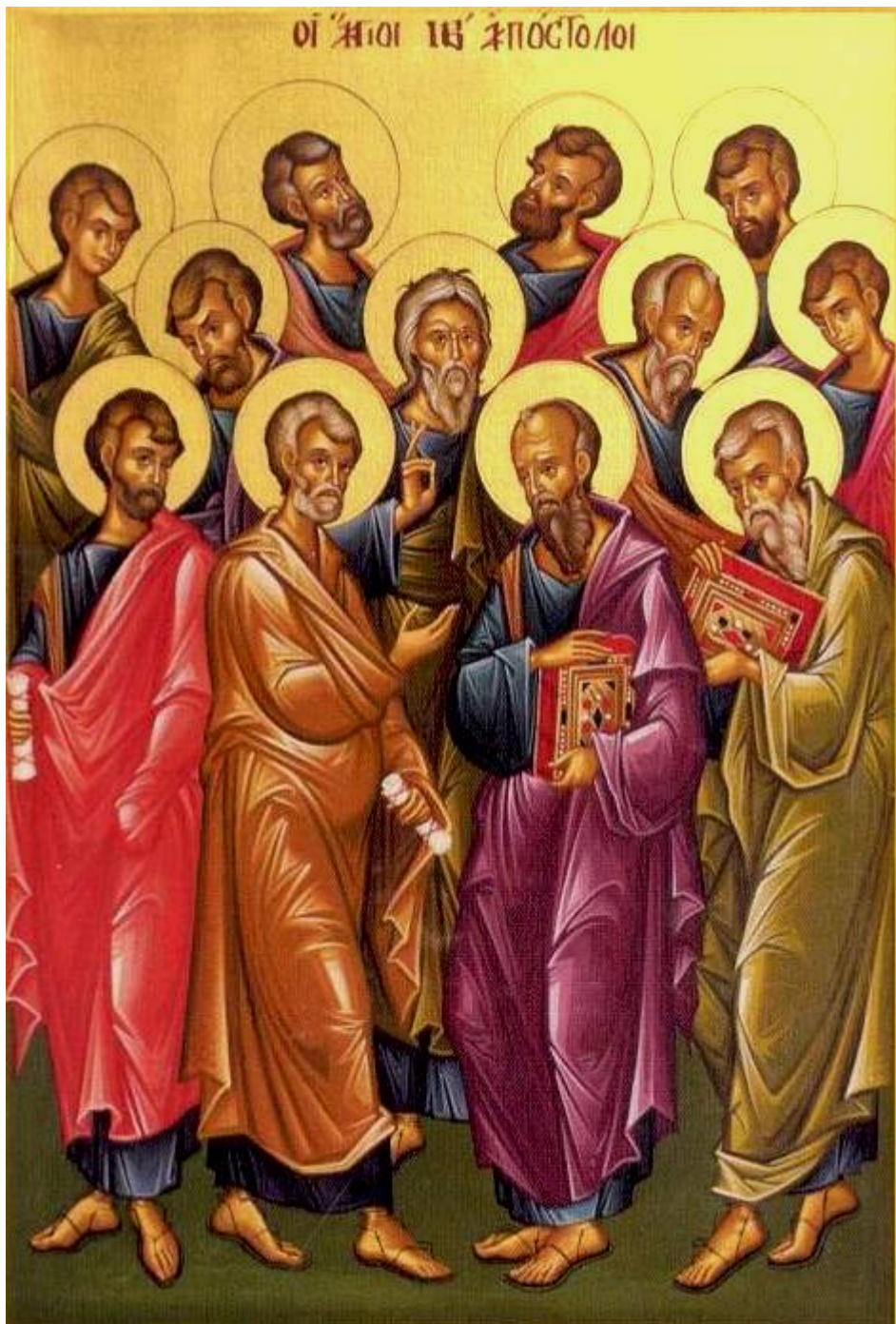
Οι Ἅγιοι Δώδεκα Ἀπόστολοι