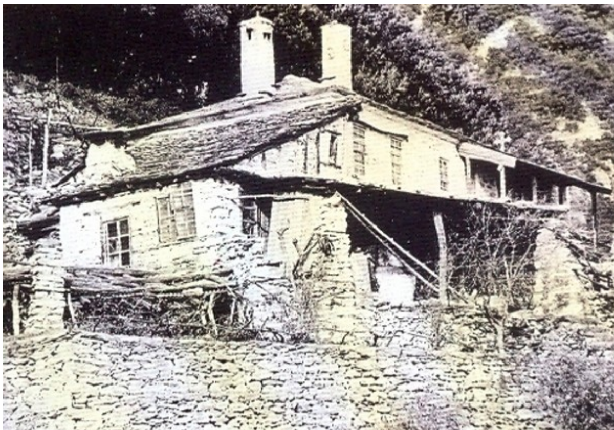
Η Καλύβη του Αγίου Γεωργίου Καυσοκαλυβίων στην οποία έζησε τα πρώτα χρόνια της μοναχικής του αφιερώσεως ο Γέροντας Πορφύριος και στην οποία και εκοιμήθη στις 2 Δεκεμβρίου 1991.