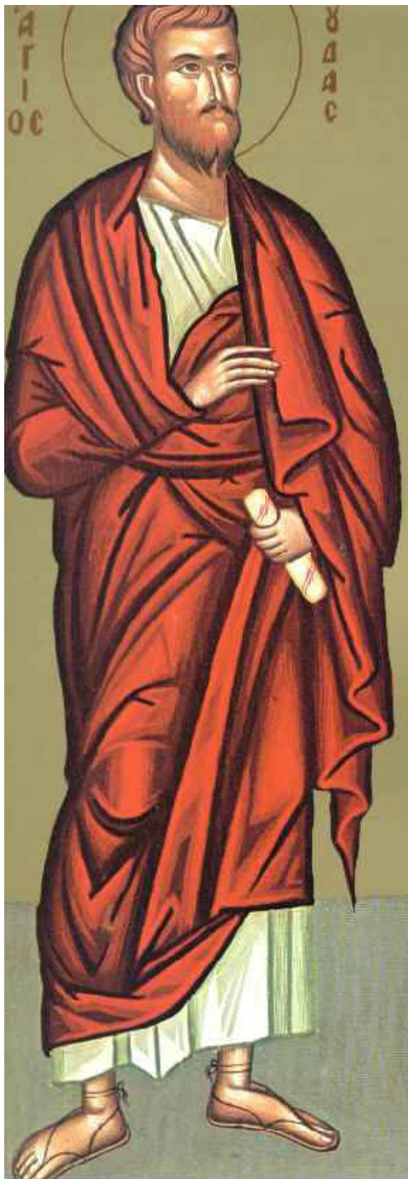
Άγιος Ιούδας ο Απόστολος