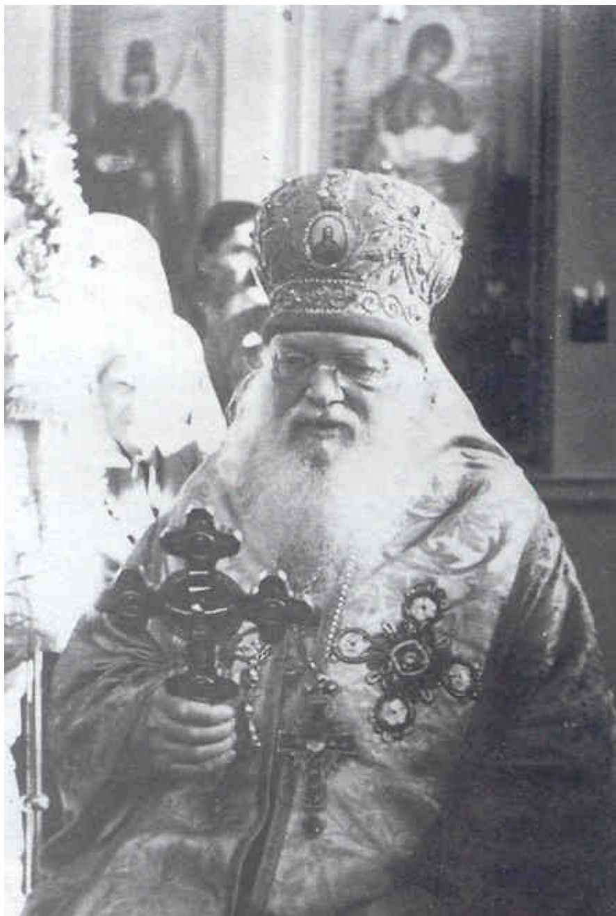
Άγιος Λουκάς Αρχιεπίσκοπος Συμφερουπόλεως και Κριμαίας