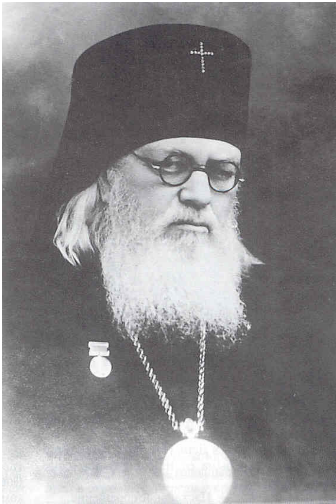
Άγιος Λουκάς Αρχιεπίσκοπος Συμφερουπόλεως και Κριμαίας