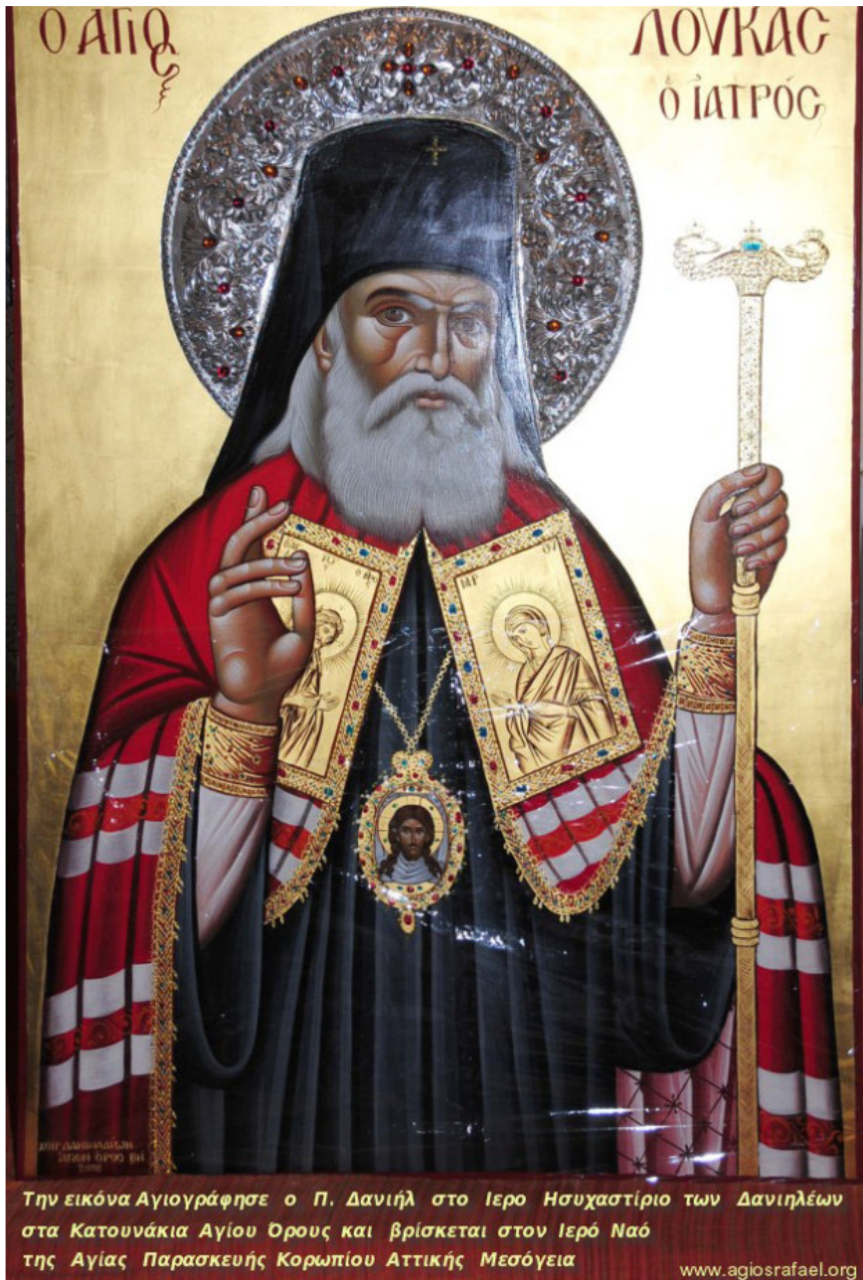
Άγιος Λουκάς Αρχιεπίσκοπος Συμφερουπόλεως και Κριμαίας