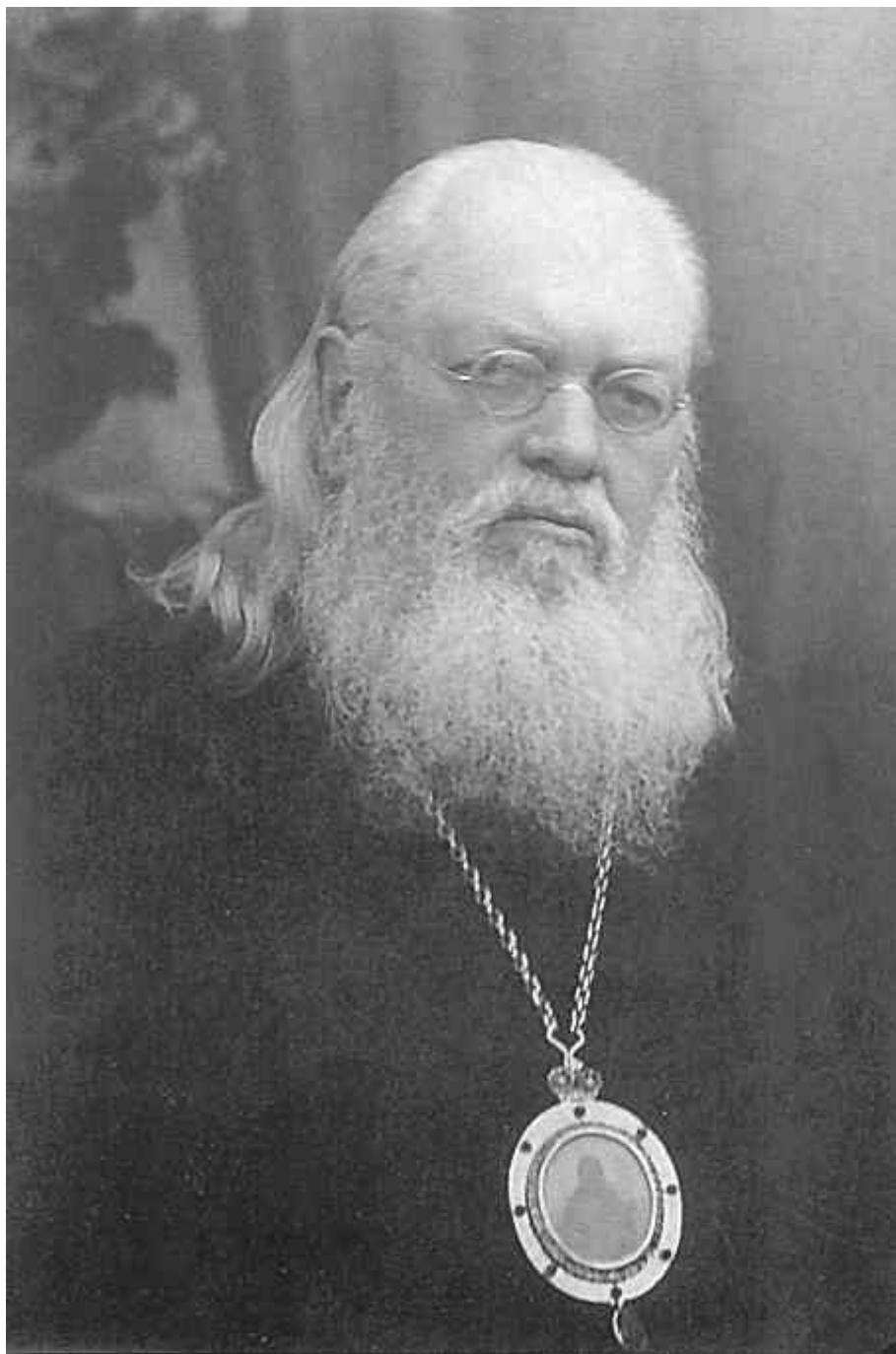
Άγιος Λουκάς Αρχιεπίσκοπος Συμφερούπολεως και Κριμαίας