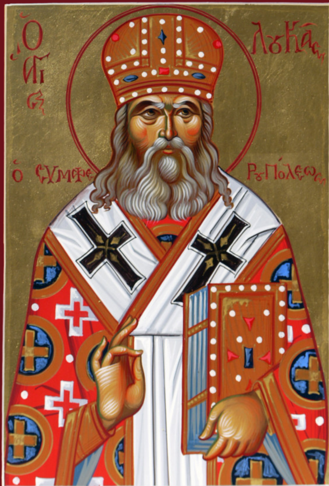
Άγιος Λουκάς Αρχιεπίσκοπος Συμφερουπόλεως και Κριμαίας - Μιχαήλ Χατζημιχαήλ