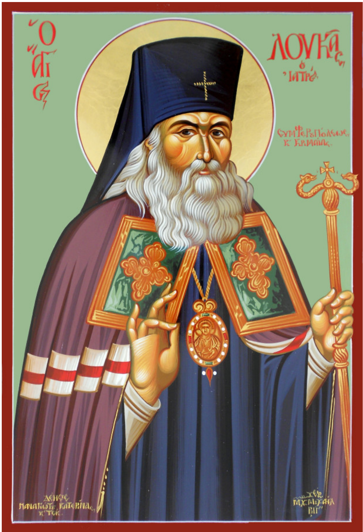
Άγιος Λουκάς Αρχιεπίσκοπος Συμφερουπόλεως και Κριμαίας - Μιχαήλ Χατζημιχαήλ ©