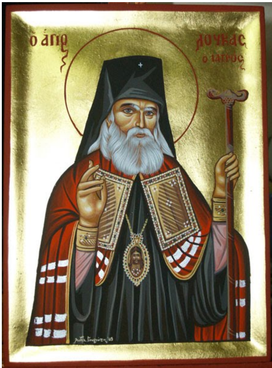
Άγιος Λουκάς Αρχιεπίσκοπος Συμφερουπόλεως και Κριμαίας - Λυδία Γουριώτη© (lydiagourioti-