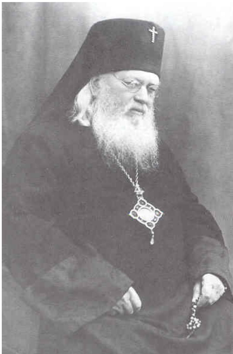
Άγιος Λουκάς Αρχιεπίσκοπος Συμφερουπόλεως και Κριμαίας