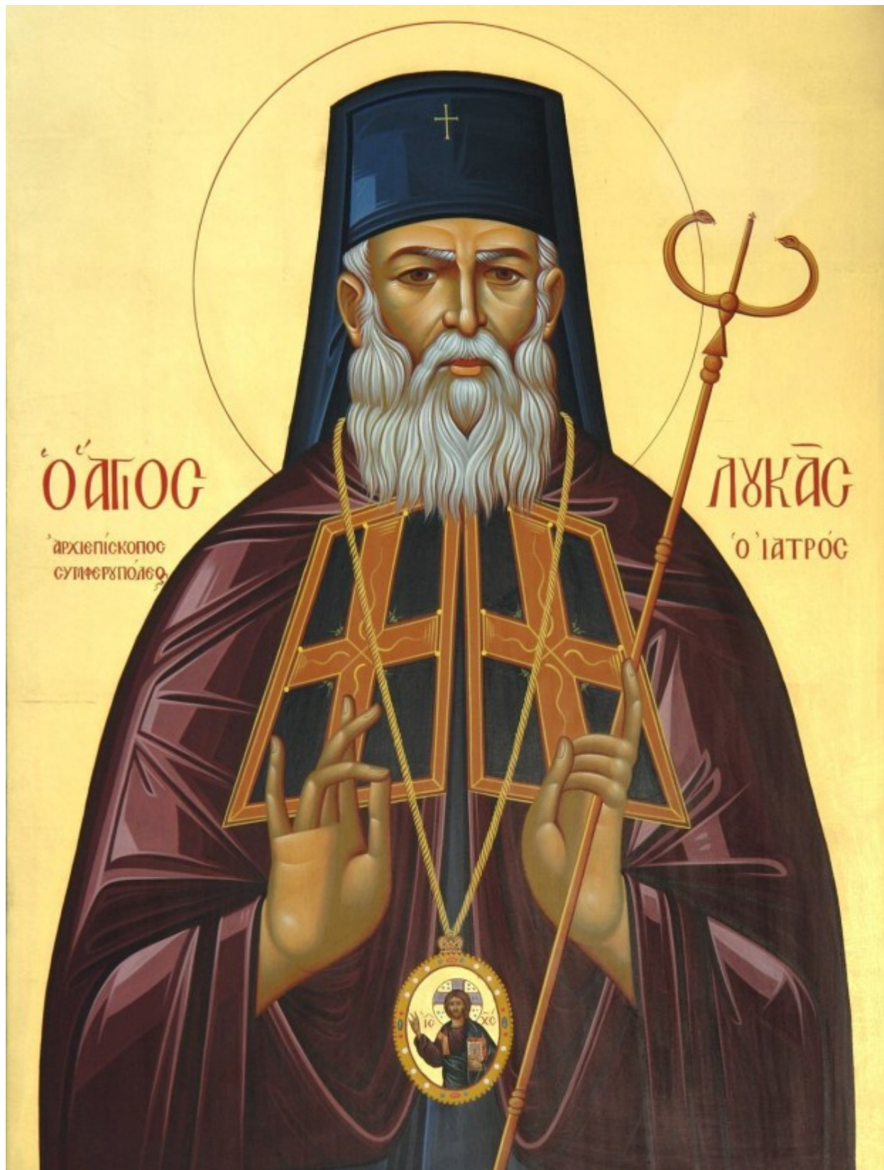
Άγιος Λουκάς Αρχιεπίσκοπος Συμφερουπόλεως και Κριμαίας