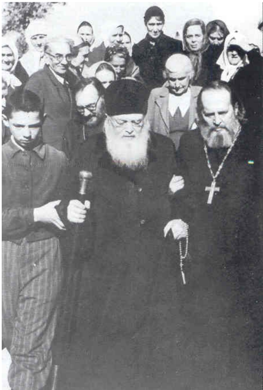
Άγιος Λουκάς Αρχιεπίσκοπος Συμφερουπόλεως και Κριμαίας