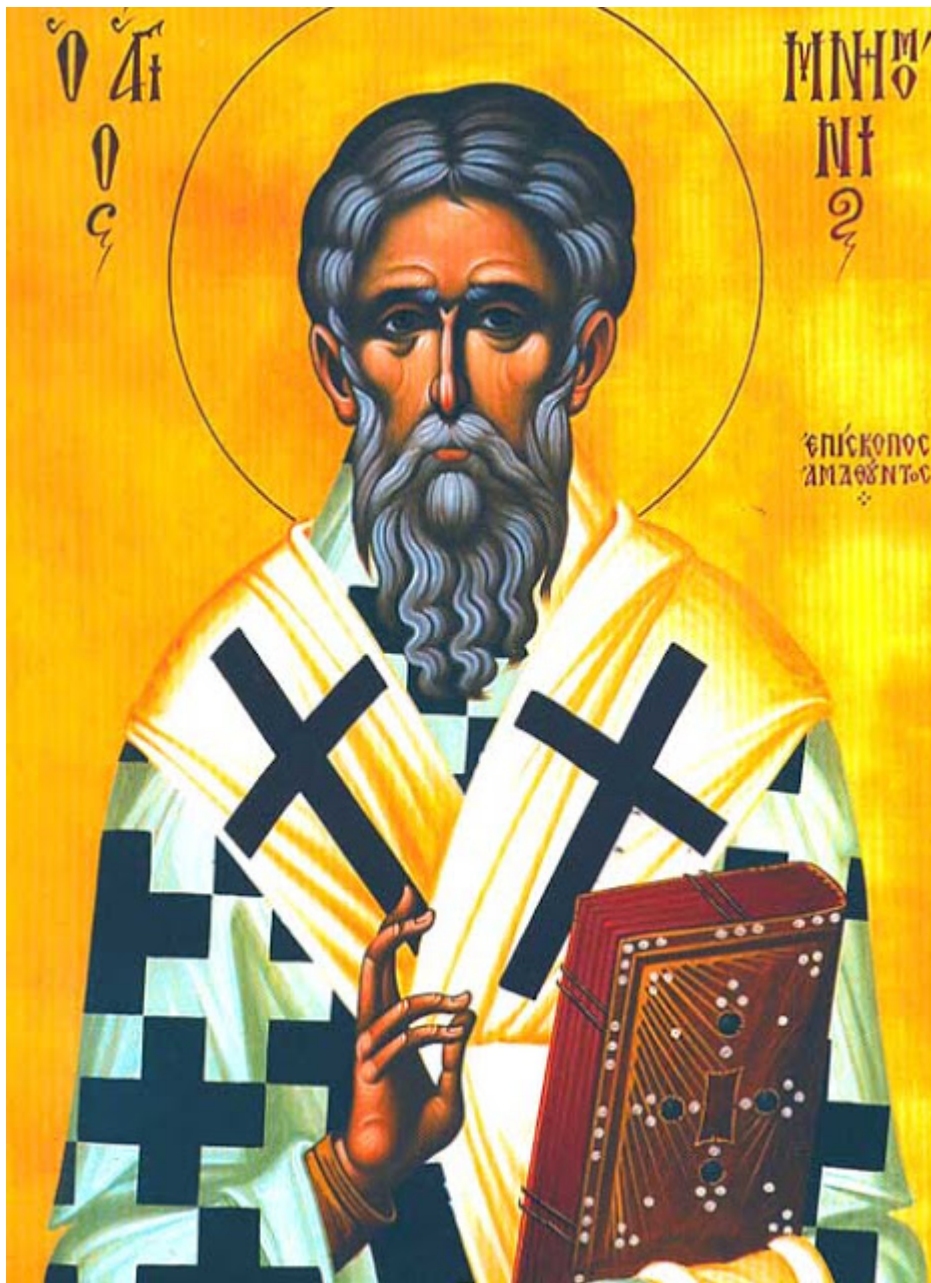
Εικόνα Αγίου Μνημονίου Επισκόπου Αμαθούντας Icon of Saint Mnemonios Bishop of Amathus