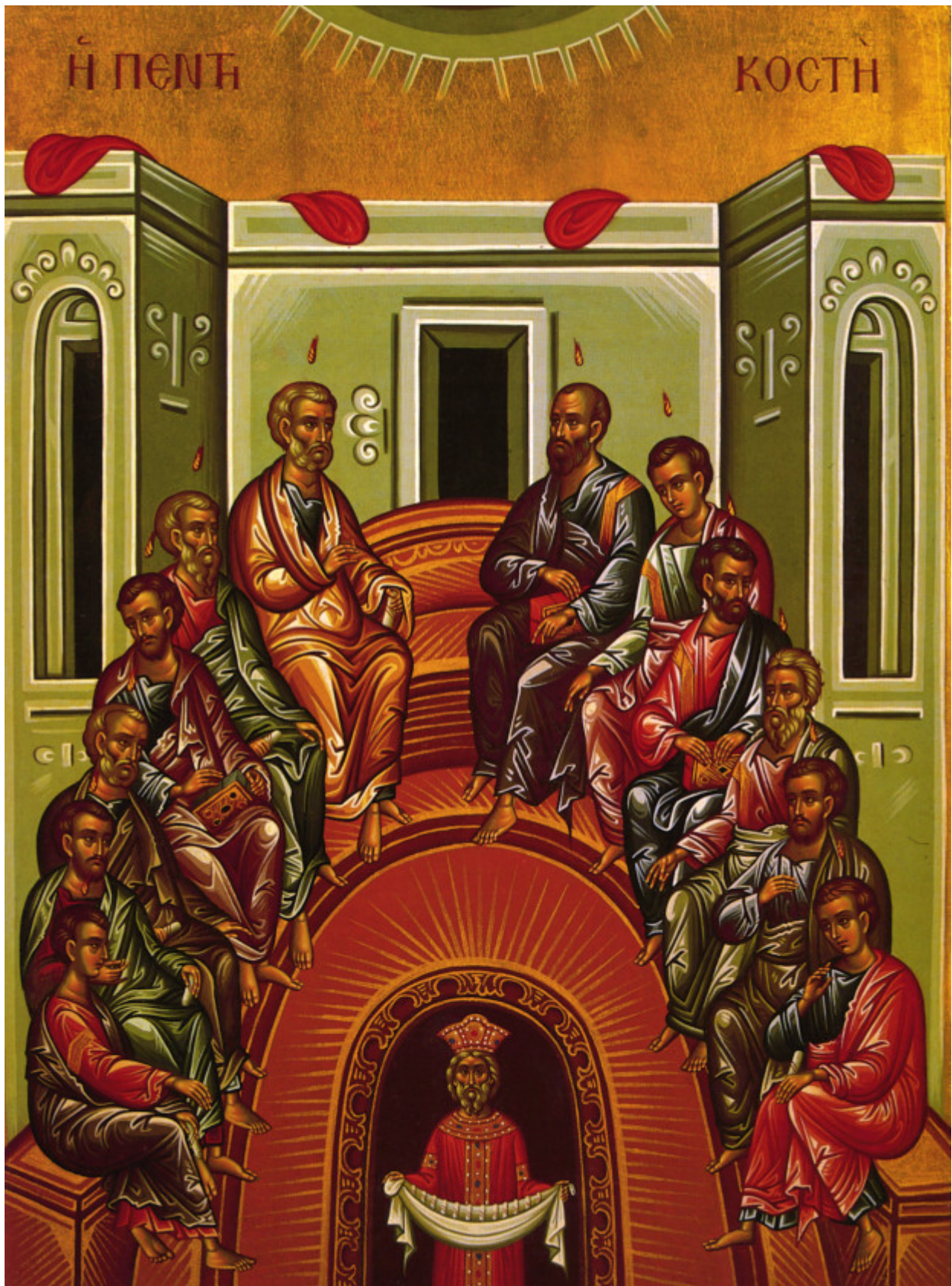
Κυριακή της Πεντηκοστής