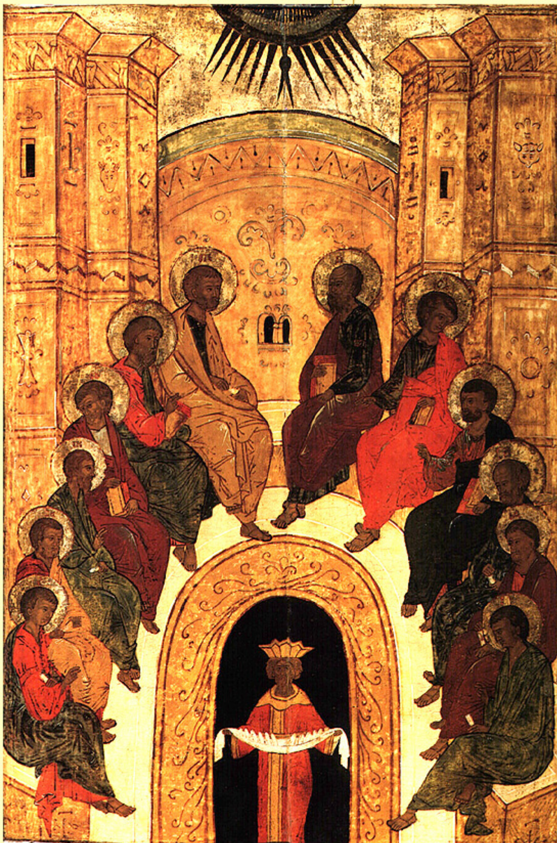
Κυριακή της Πεντηκοστής