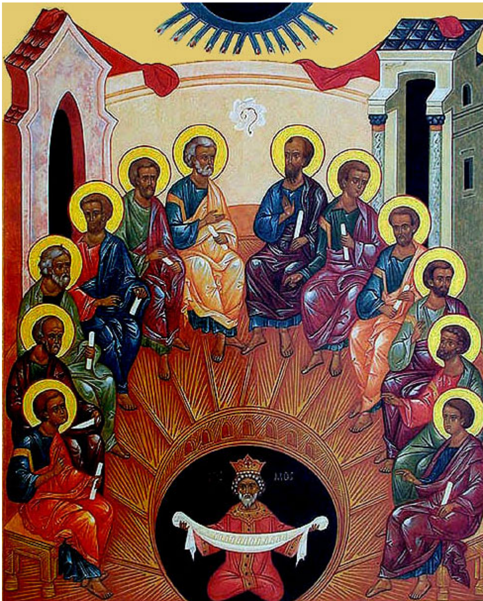
Κυριακή της Πεντηκοστής