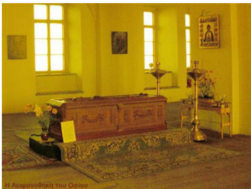
Η Λειψανοθήκη του Οσίου

Ύστερα από πολύχρονους ασκητικούς αγώνες, παρέδωσε στον Κύριο την καθαρή του ψυχή, ο θαυματουργός όσιος, στις 12 Ιουνίου του 1447, ημέρα των μεγάλων οσίων Ονουφρίου και Πέτρου του Αθωνίτου, το παράδειγμα των οποίων ακολούθησε.