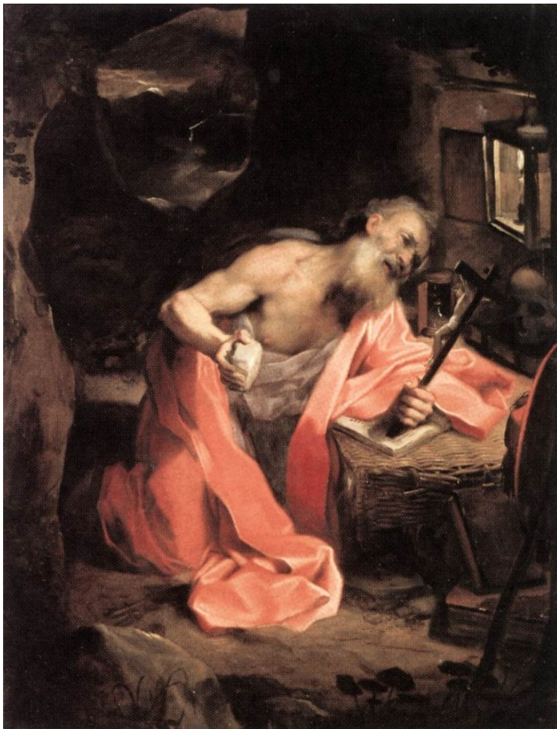
Ο Άγιος Ιερώνυμος. Έργο του Federico Barocci c. 1598

Τα αμαρτήματα σας είναι μεγάλα και φοβερά. Τίποτε όμως δεν υπερβαίνει την άπειρη ευσπλαχνία του Θεού. Η άφεση των αμαρτιών δεν δίνεται σύμφωνα με την αξία μας, αλλά σύμφωνα με το έλεος του φιλάνθρωπου Θεού. Ο Θεός είναι έτοιμος να συγχωρήσει, όταν υπάρχει ειλικρινής μετάνοια. Αυτό που κάνει τον άνθρωπο ανάξιο να συγχωρηθεί δεν είναι το μέγεθος και το πλήθος των αμαρτιών, αλλά η αμετανοησία του.