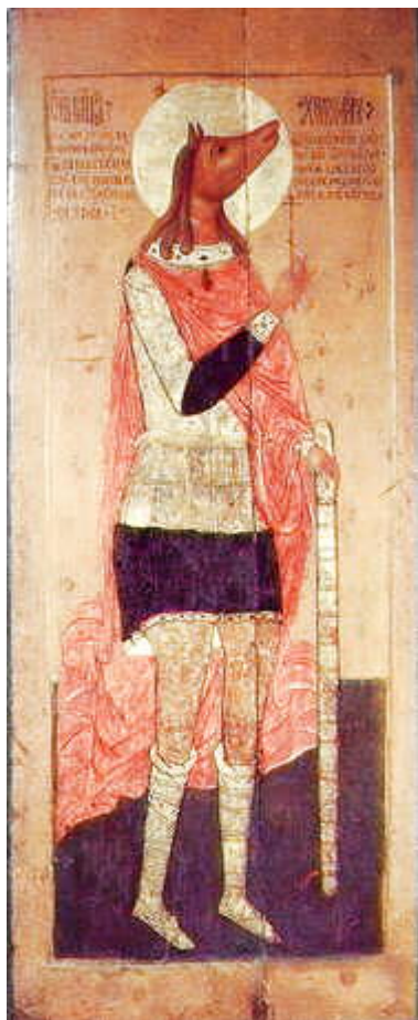
Άγιος Χριστόφορος ο Μεγαλομάρτυρας