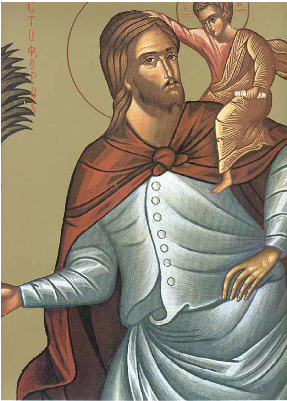
Άγιος Χριστόφορος ο Μεγαλομάρτυρας