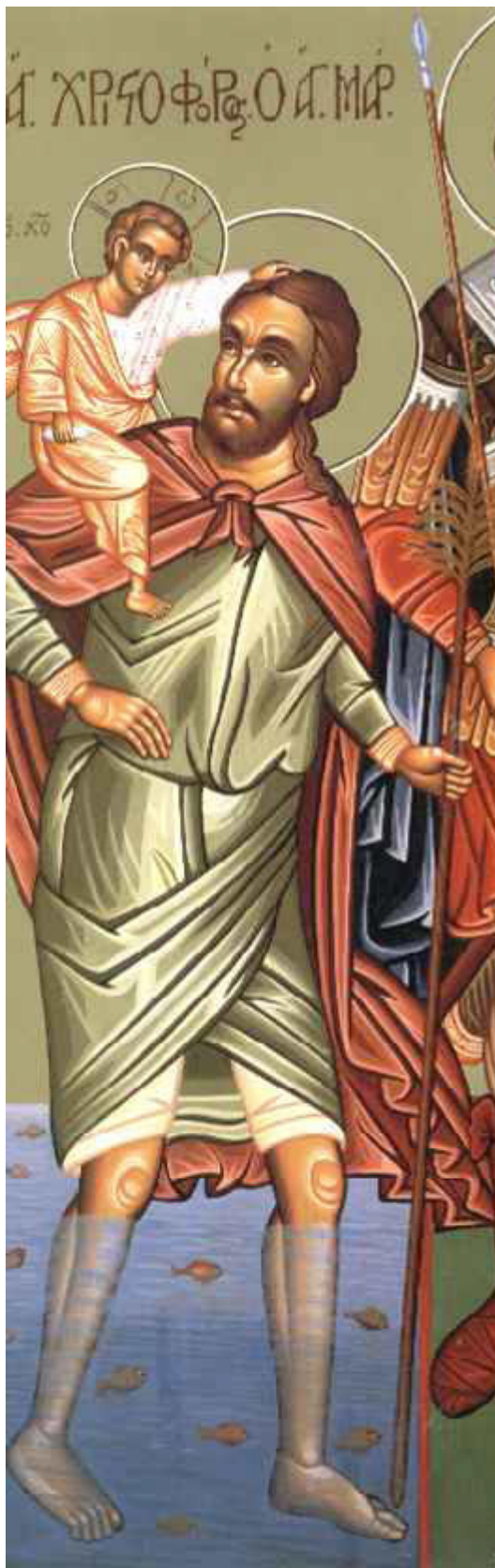
Άγιος Χριστόφορος ο Μεγαλομάρτυρας