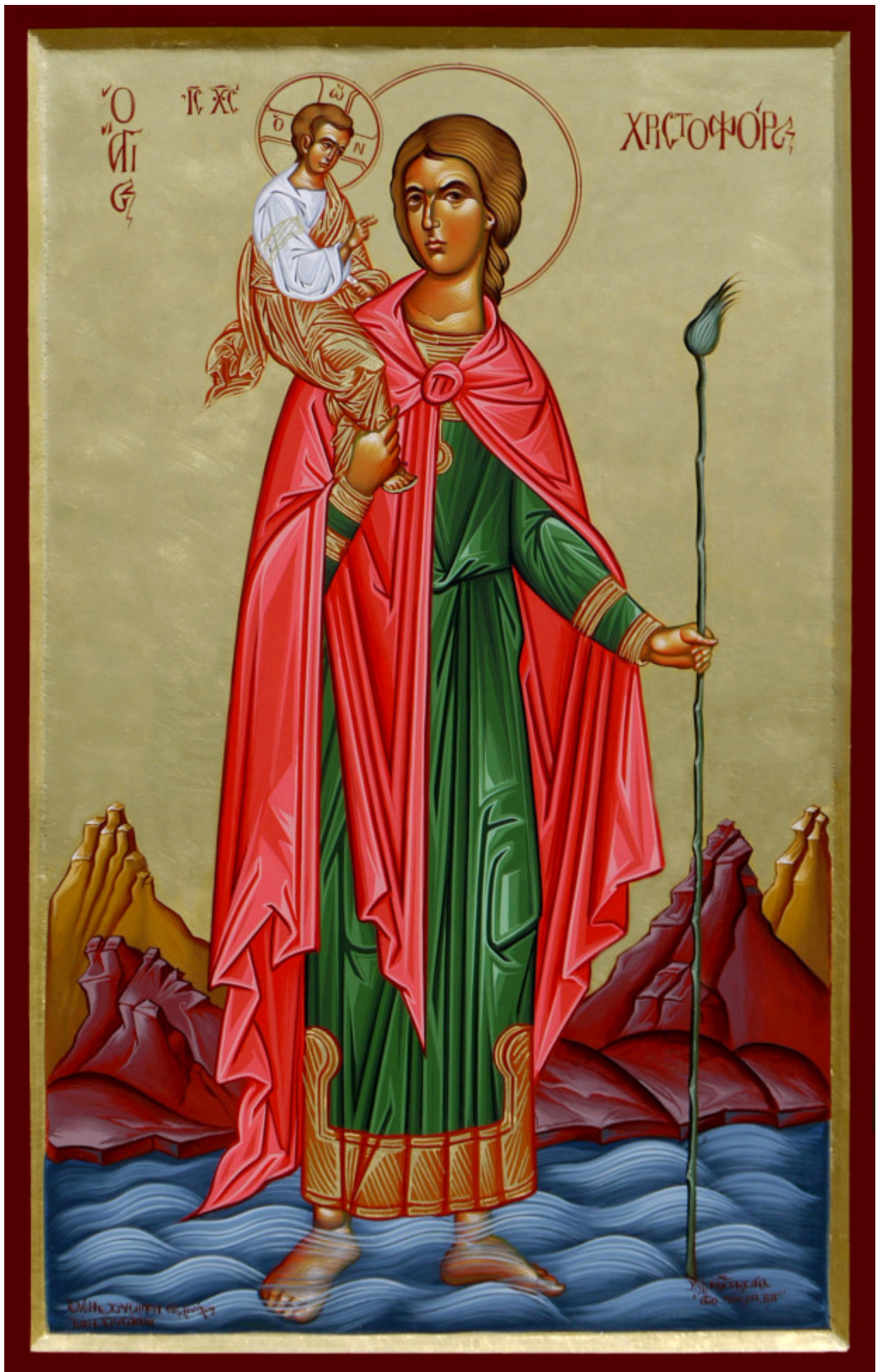
Άγιος Χριστόφορος ο Μεγαλομάρτυρας - Μιχαήλ Χατζημιχαήλ © www.michaelhadjimichael.com