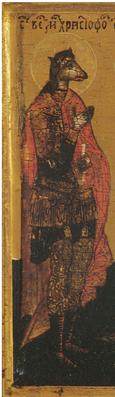
Άγιος Χριστόφορος ο Μεγαλομάρτυρας