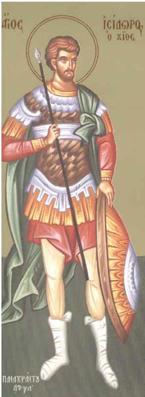
Άγιος Ισίδωρος που μαρτύρησε στη Χίο