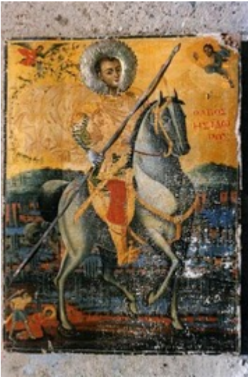
Άγιος Ισίδωρος που μαρτύρησε στη Χίο