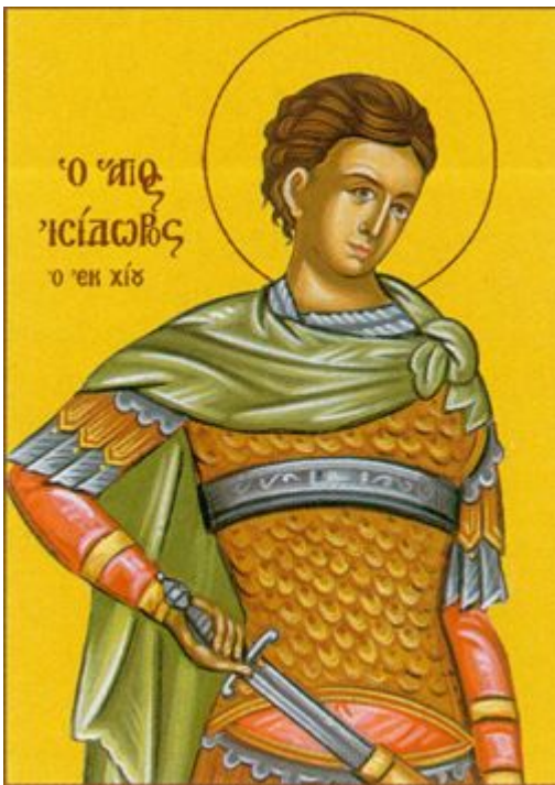
Ἅγιος Ἰσίδωρος που μαρτύρησε στη Χίο