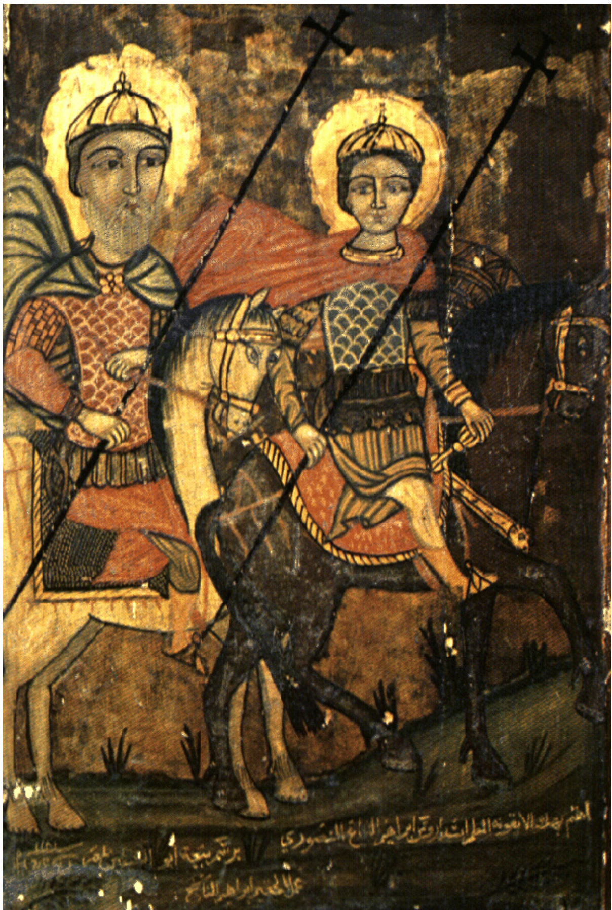
Άγιος Ισίδωρος που μαρτύρησε στη Χίο