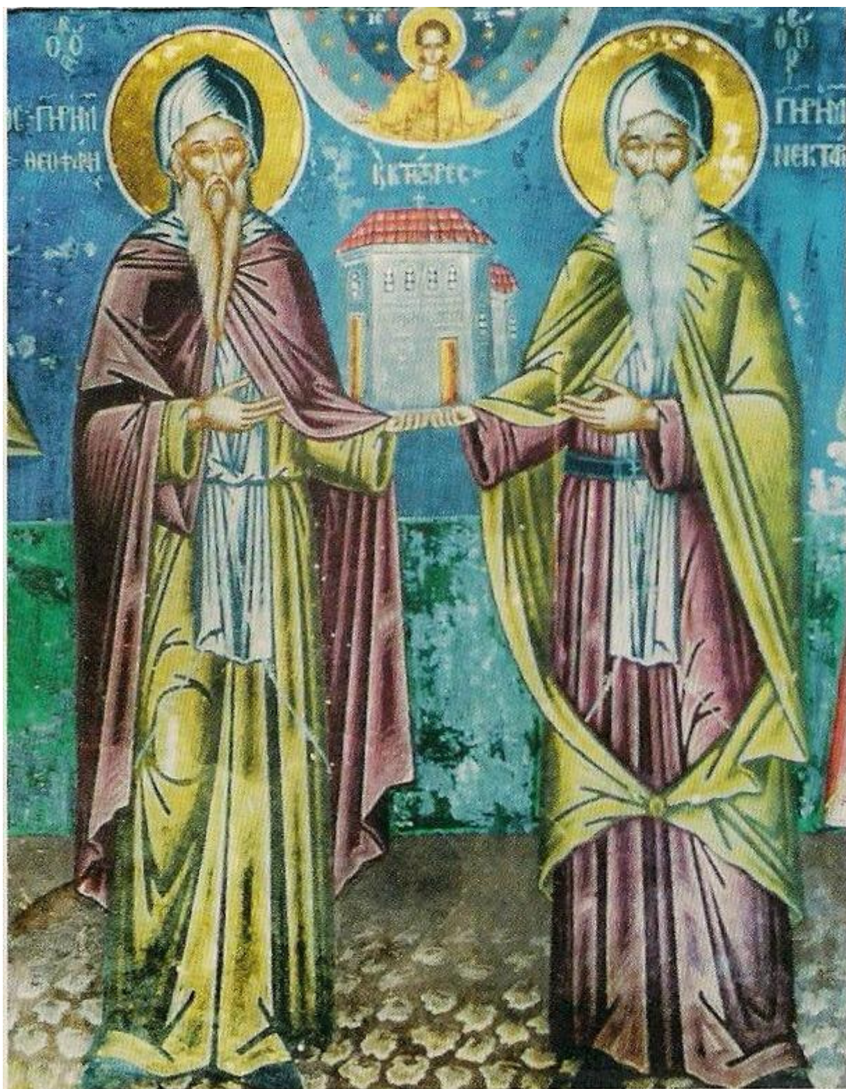
Οί ὄσιοι Θεοφάνης καὶ Νεκτάριος. Τοιχογραφία Ἰ. Μ. Βαρλαάμ Μετεώρων (16ος αἰ.).