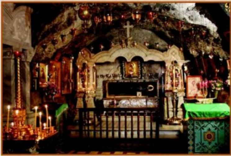
Μοϋμι преп. Ιοβα Почаевского, находящиеся в Пещерной меркви