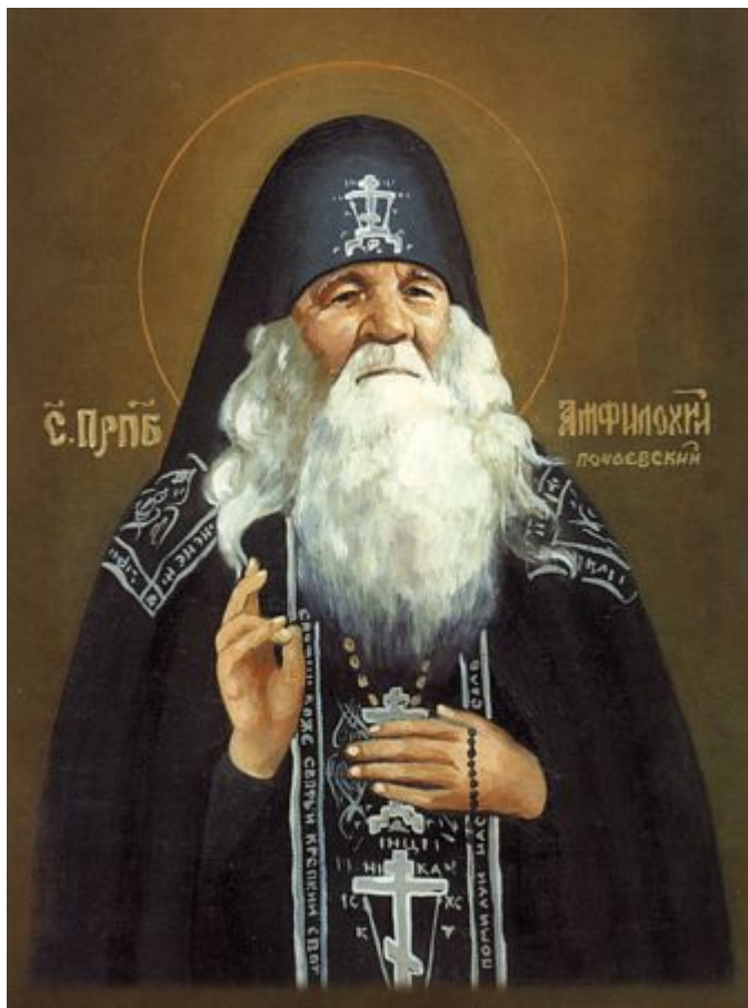
Ο βίος του Αγίου Αμφιλοχίου του Ποτσάεβ