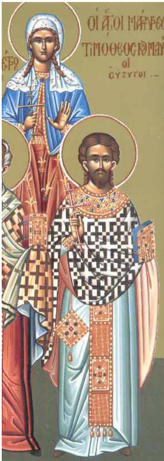
Άγιοι Τιμόθεος και Μαύρα