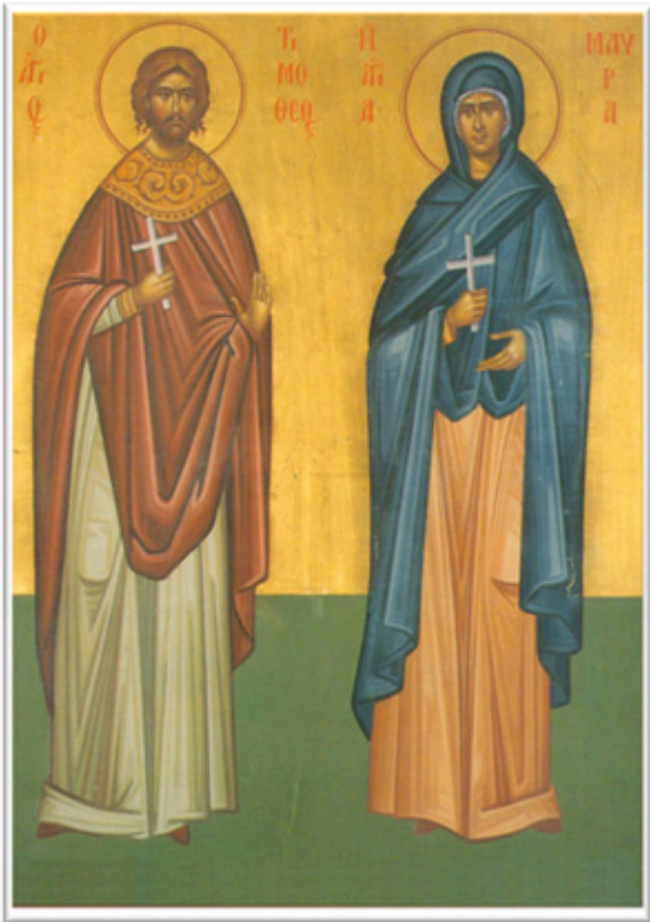
Ἅγιοι Τιμόθεος και Μαύρα