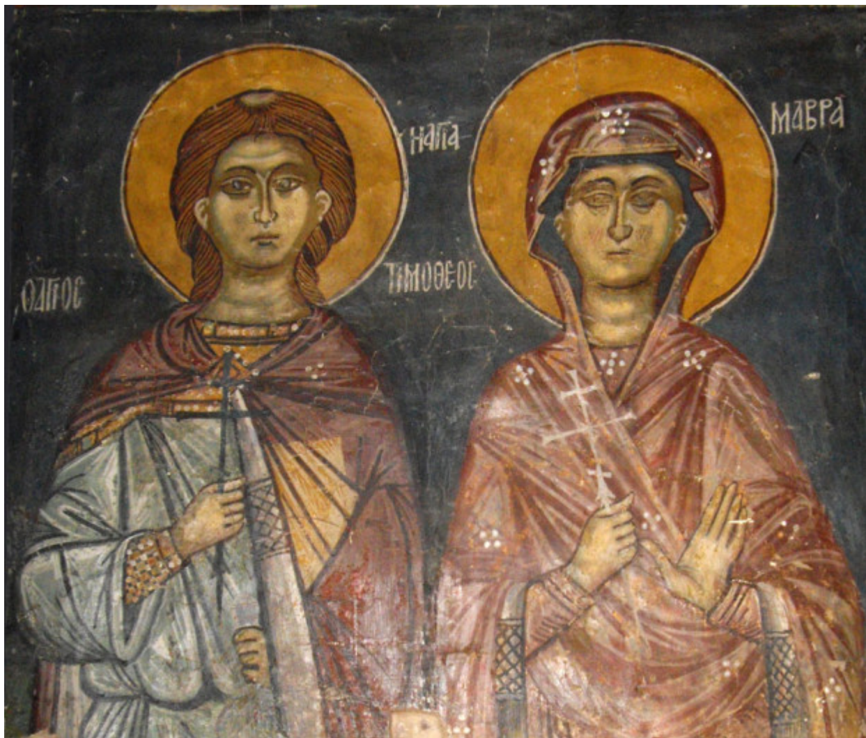
Οι άγιοι Τιμόθεος και Μαύρα. Τοιχογραφία του 15ου αιώνα στην Μονή Αγίας Μαύρας στο Κοιλάνι της Λεμεσού (Κύπρος).