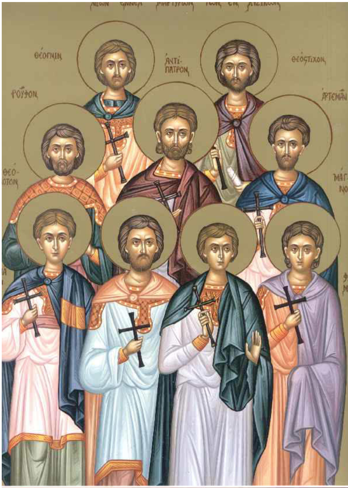
Άγιοι Εννέα Μάρτυρες εν Κυζίκω

Εορτάζει στις 28 Απριλίου εκάστου έτους.