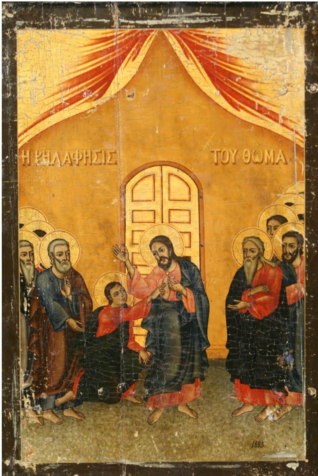
Κυριακή του Θωμά - Ι.Ν. Ζωοδόχου Πηγής, Λαρίσης ( http://www.panagialarisis.gr )