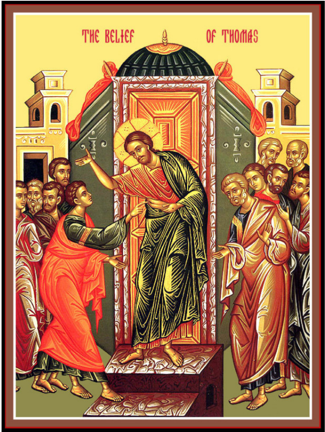
Κυριακή του Θωμά