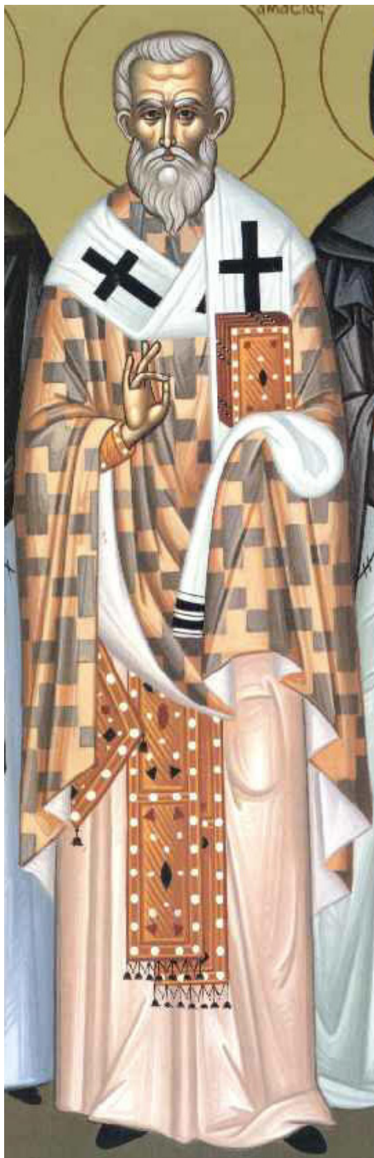
Άγιος Βασίλειος Ιερομάρτυρας Επίσκοπος Αμασειάς