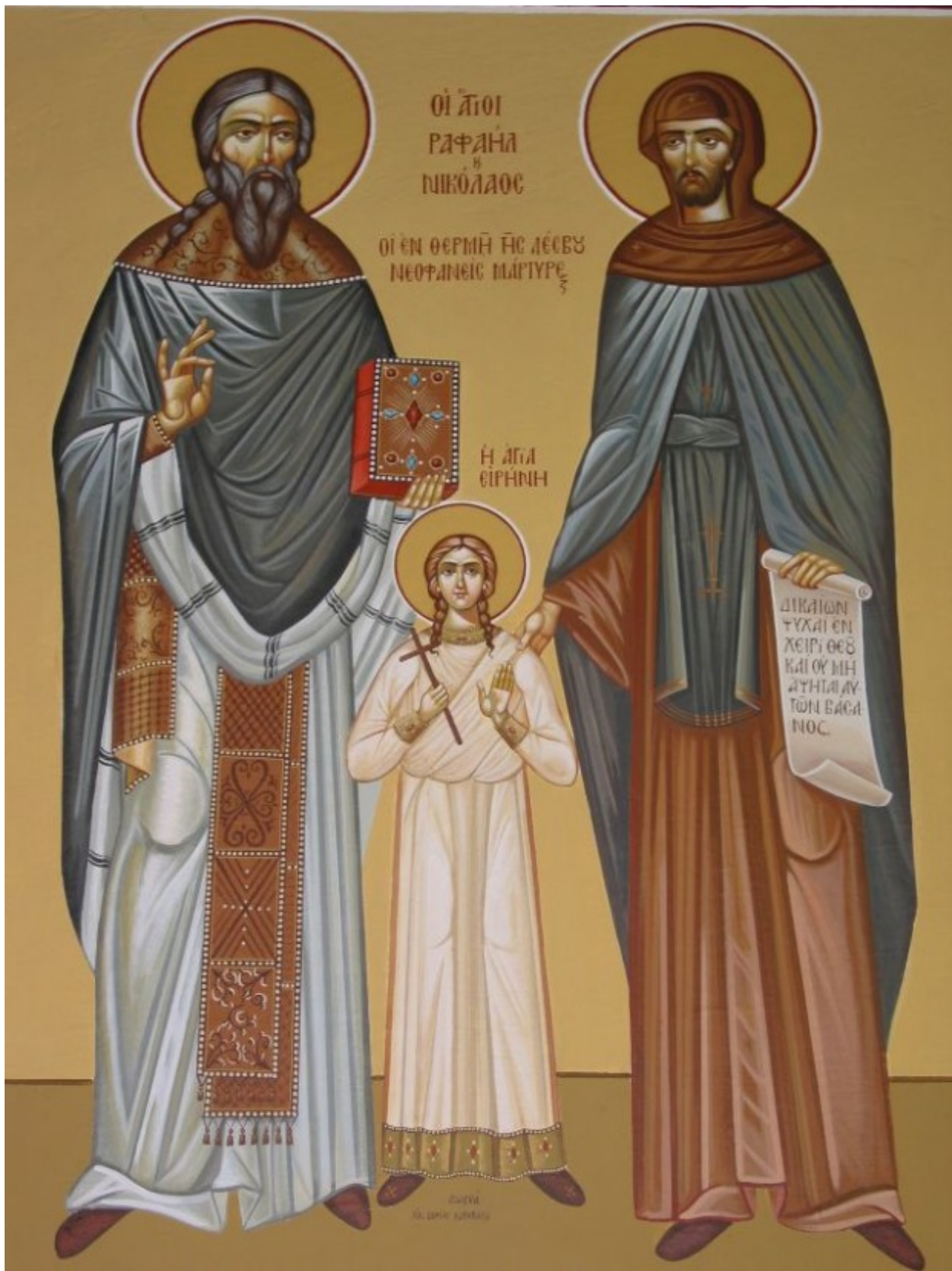
Άγιοι Ραφαήλ, Νικόλαος, Ειρήνη και οι συν αυτοίς