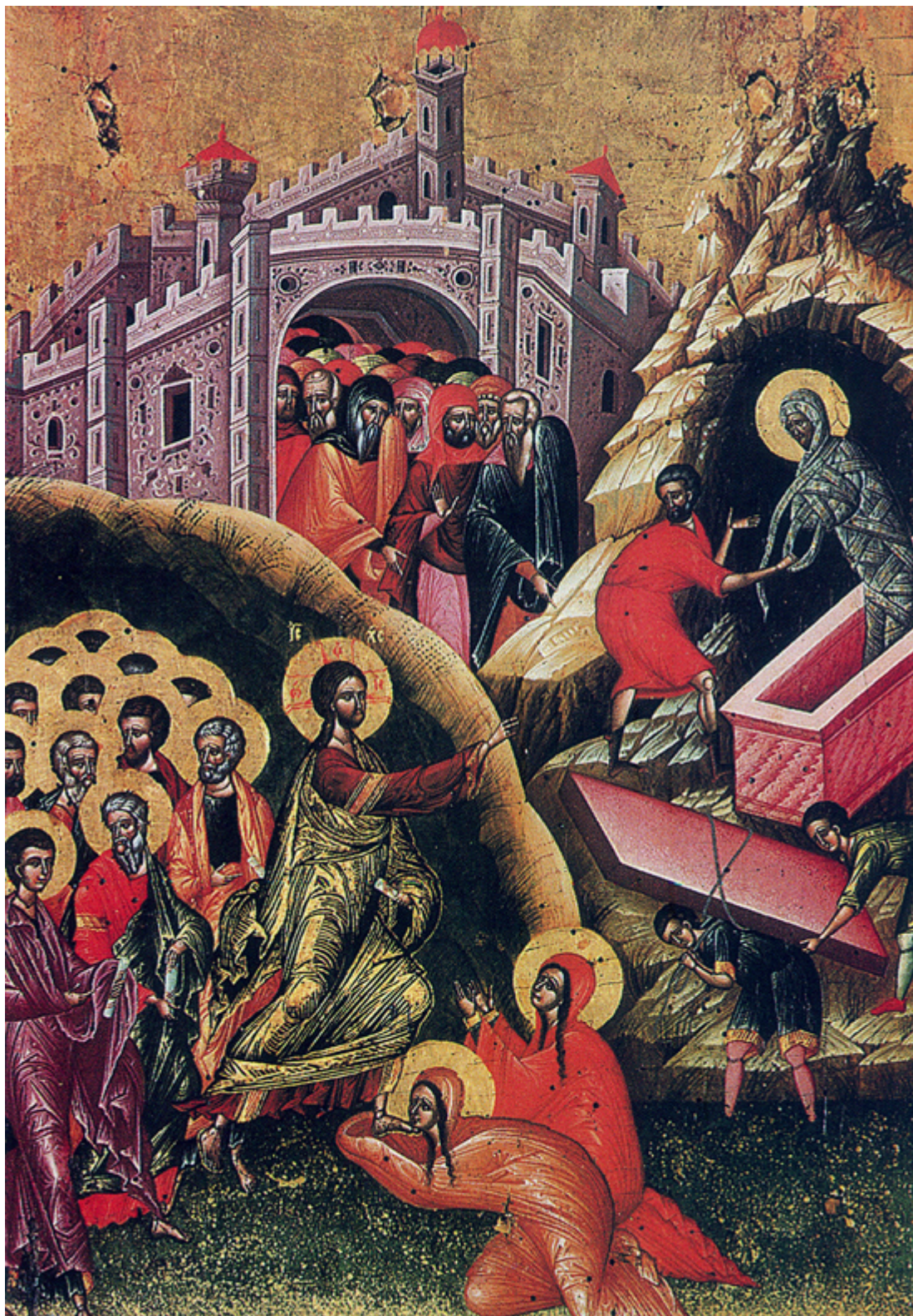
Η έγερση του δικαίου Λαζάρου. 16ος αι. Ι.Ναός Ευαγγελισμού, Βερατίου Αλβανίας