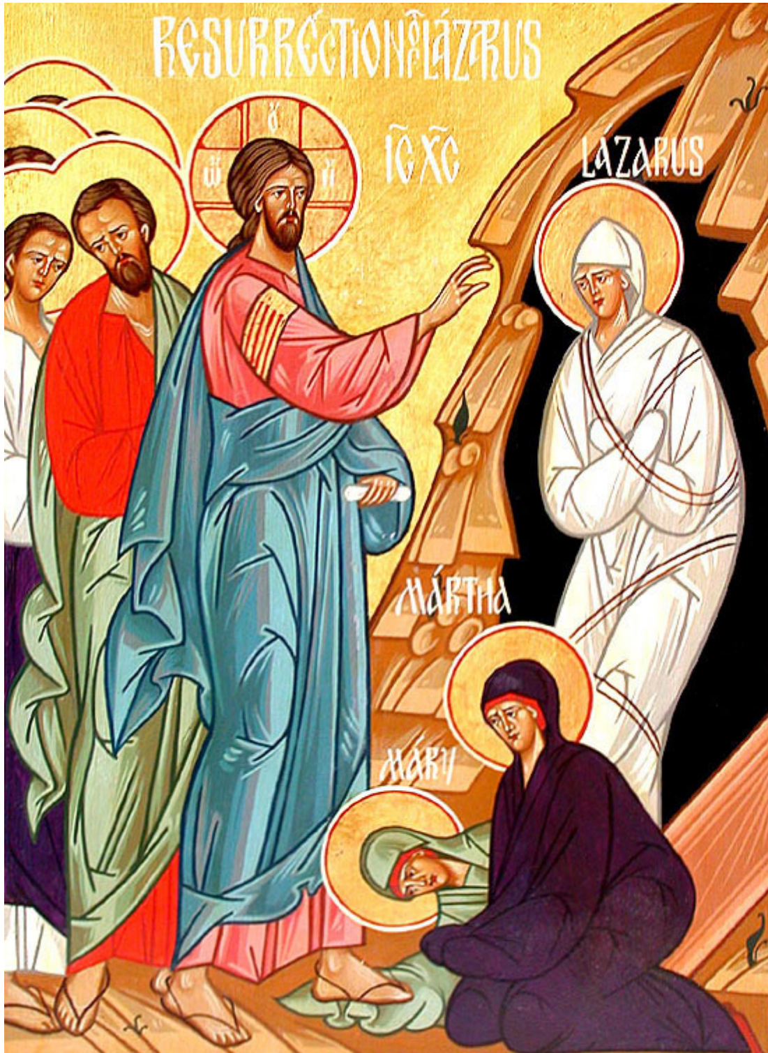
Ανάσταση του Λαζάρου