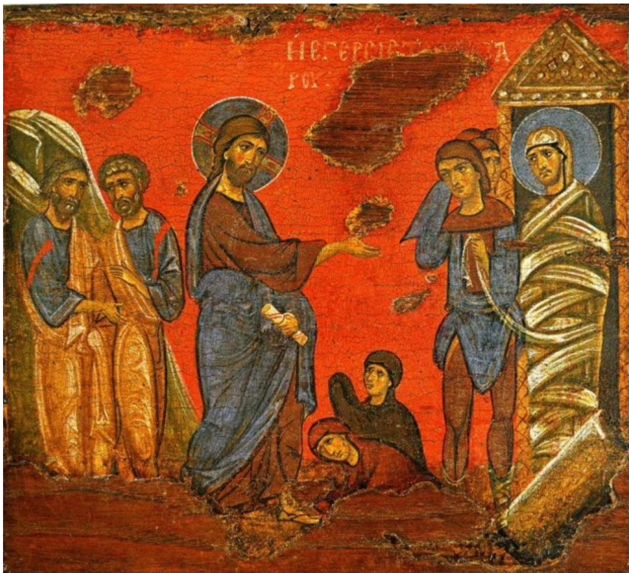
Ανάσταση του Λαζάρου