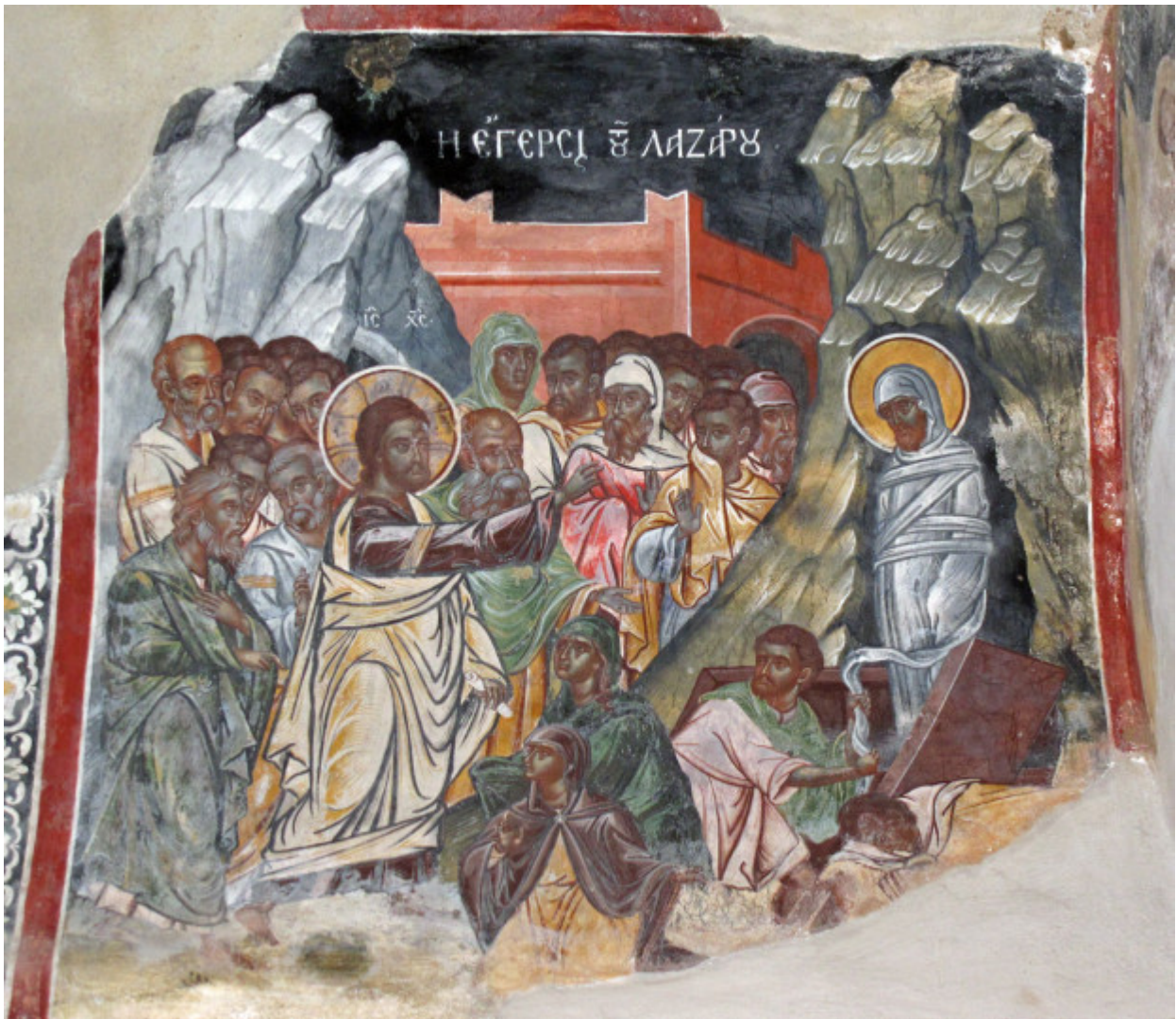
Ανάσταση του Λαζάρου