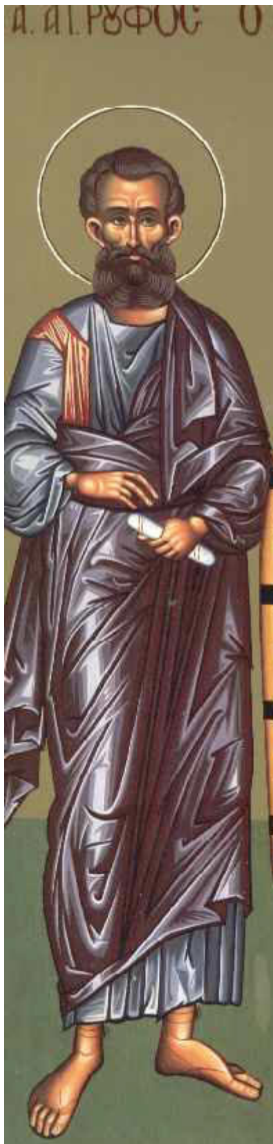
Άγιος Ρούφος ο Απόστολος από τους Ο΄