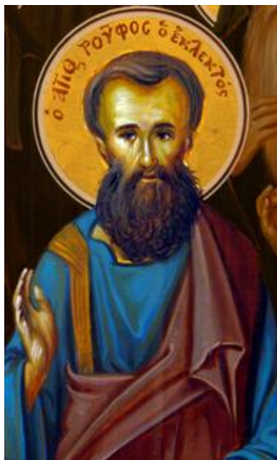
Άγιος Ρούφος ο Απόστολος από τους Ο΄