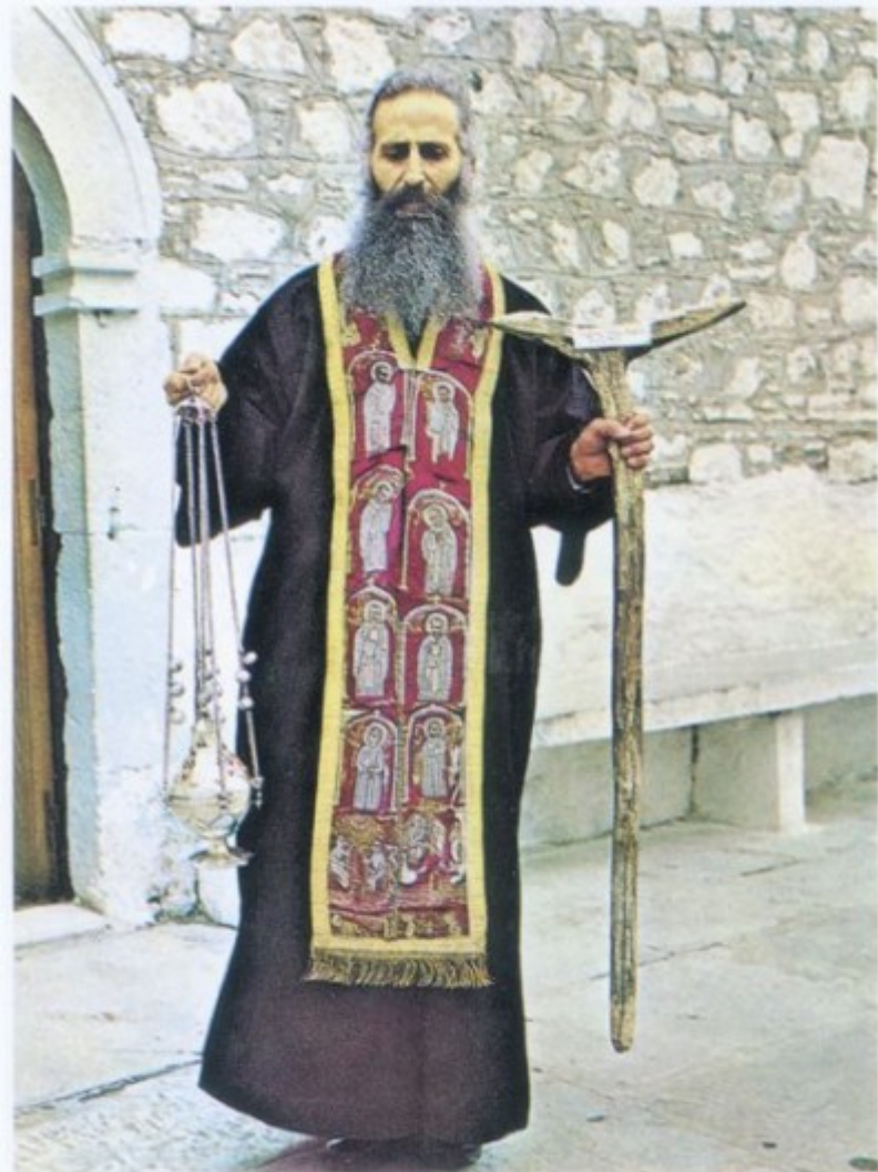
Ο Γέροντας Ίάκωβος, φορώντας τό πετραχήλι του Όσιου Δαβίδ κρατάει τό θυμιατό και τή Ράβδο του Όσιου (1976).

πλέον κι αυτού αγίου Γέροντος Παΐσιου, η οποία περιέχεται στον πρόλογο του βιβλίου του για τον Χατζη-Γιώργη, σύμφωνα με την οποία «οι απόγονοι πάντοτε έχουν ιερό καθήκον να γράφουν τα θεία κατορθώματα των αγίων Πατέρων της εποχής τους και τον φιλότιμο αγώνα τους για να πλησιάσουν τον Θεό», προσπαθήσαμε με τη βοήθεια του Θεού και επικαλούμενοι την ευχή του μακαριστού αγίου Γέροντος Ιακώβου, να γράψουμε, όσο το δυνατό πιο συνοπτικά, το κείμενο αυτό, το αφιερωμένο στη μνήμη του μακαριστού Γέροντος.