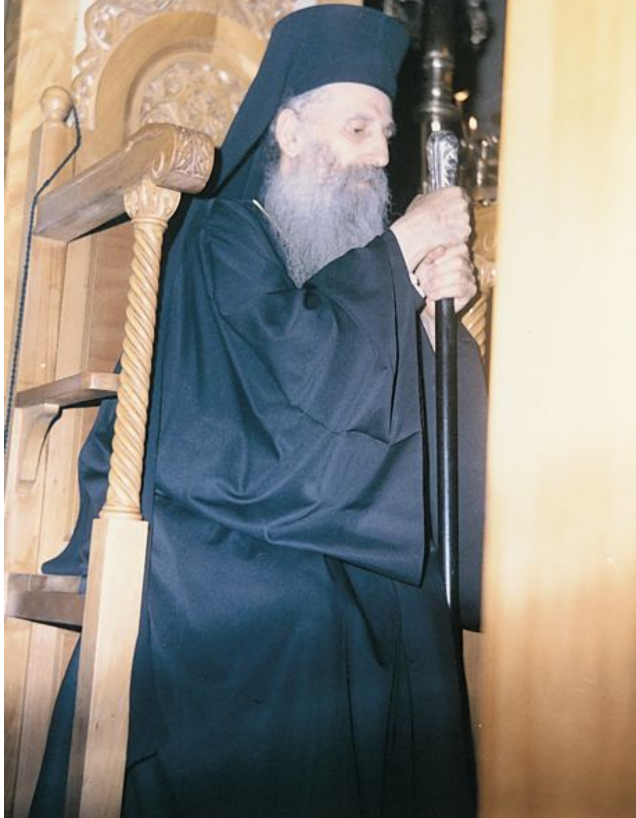
Τα πρώτα βήματά του