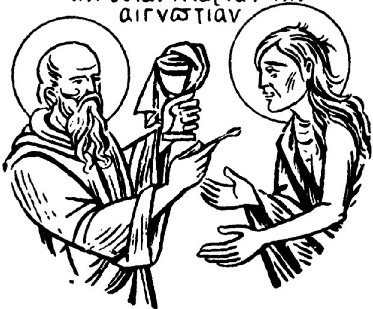
Οσία Μαρία η Αιγυπτία και Ὁσιος Ζωσιμάς