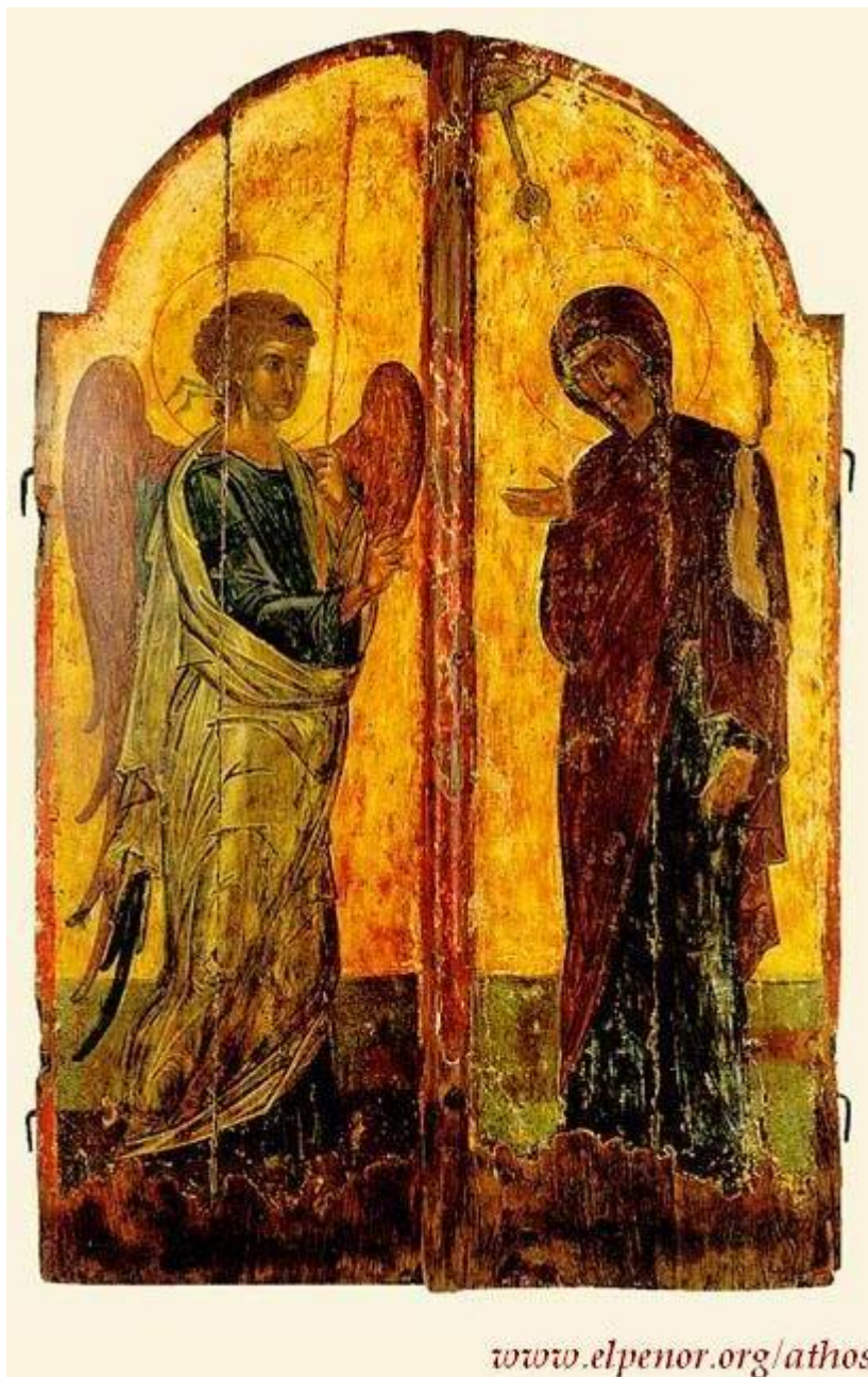
Ευαγγελισμός της Υπεραγίας Θεοτόκου - Βημόθυρα - 14ος-15ος αι. μ.Χ. - Μονή Σίμωνος Πέτρας, Άγιον Όρος