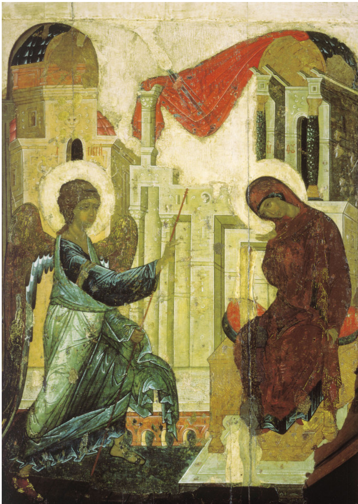
Ευαγγελισμός της Υπεραγίας Θεοτόκου, Αντρέι Ρουμπλιόβ, Ναός του Ευαγγελισμού, 1405