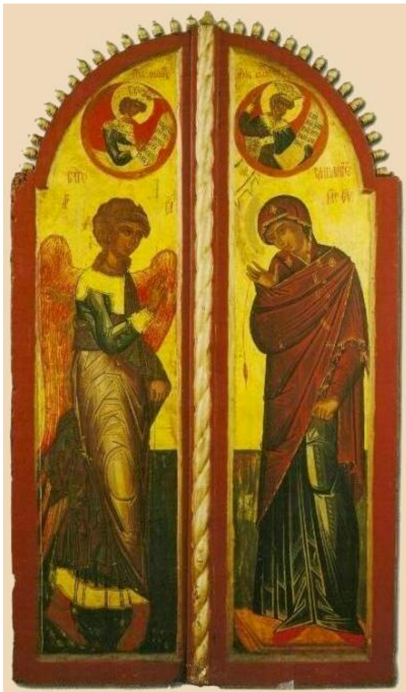
Ευαγγελισμός της Υπεραγίας Θεοτόκου - Βημόθυρα - Ιερό Χιλιανδαρινό Κελλί Μαρουδά, έργο Γεωργίου Μητροφάνοβιτς, 1653/4