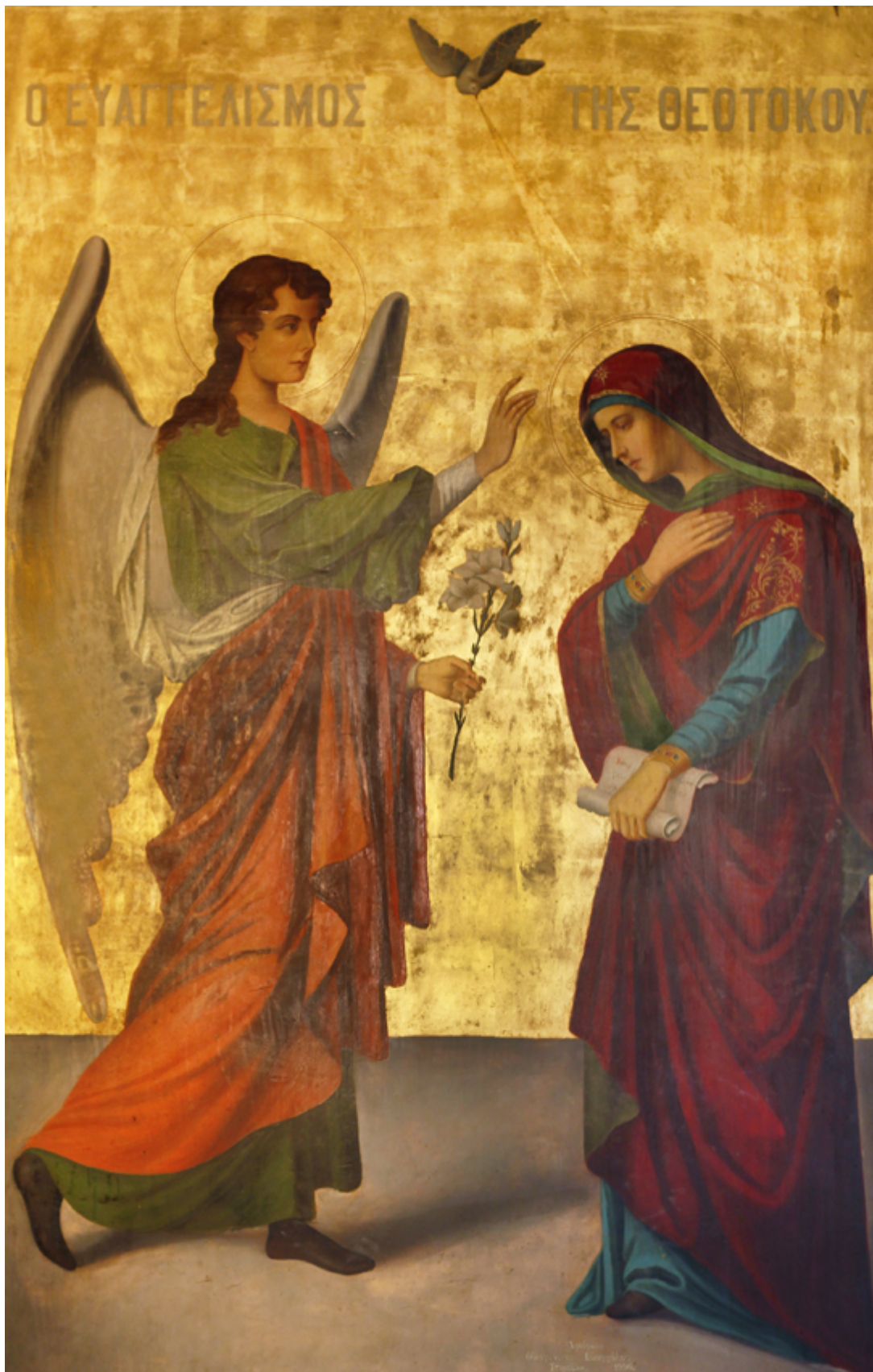
Ευαγγελισμός της Υπεραγίας Θεοτόκου - Ι.Ν. Ζωοδόχου Πηγής, Λαρίσης ( http://www.panagialarisis.gr )