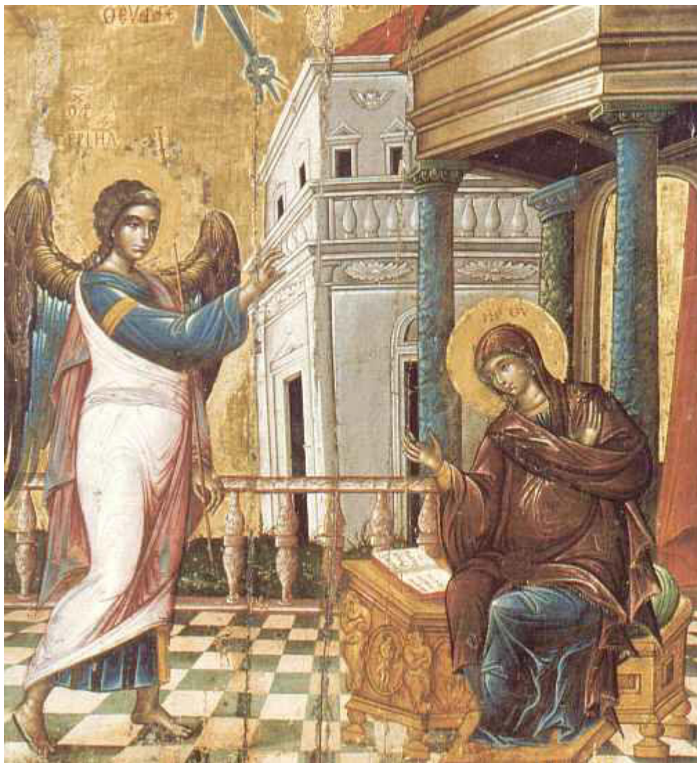
Ευαγγελισμός της Υπεραγίας Θεοτόκου