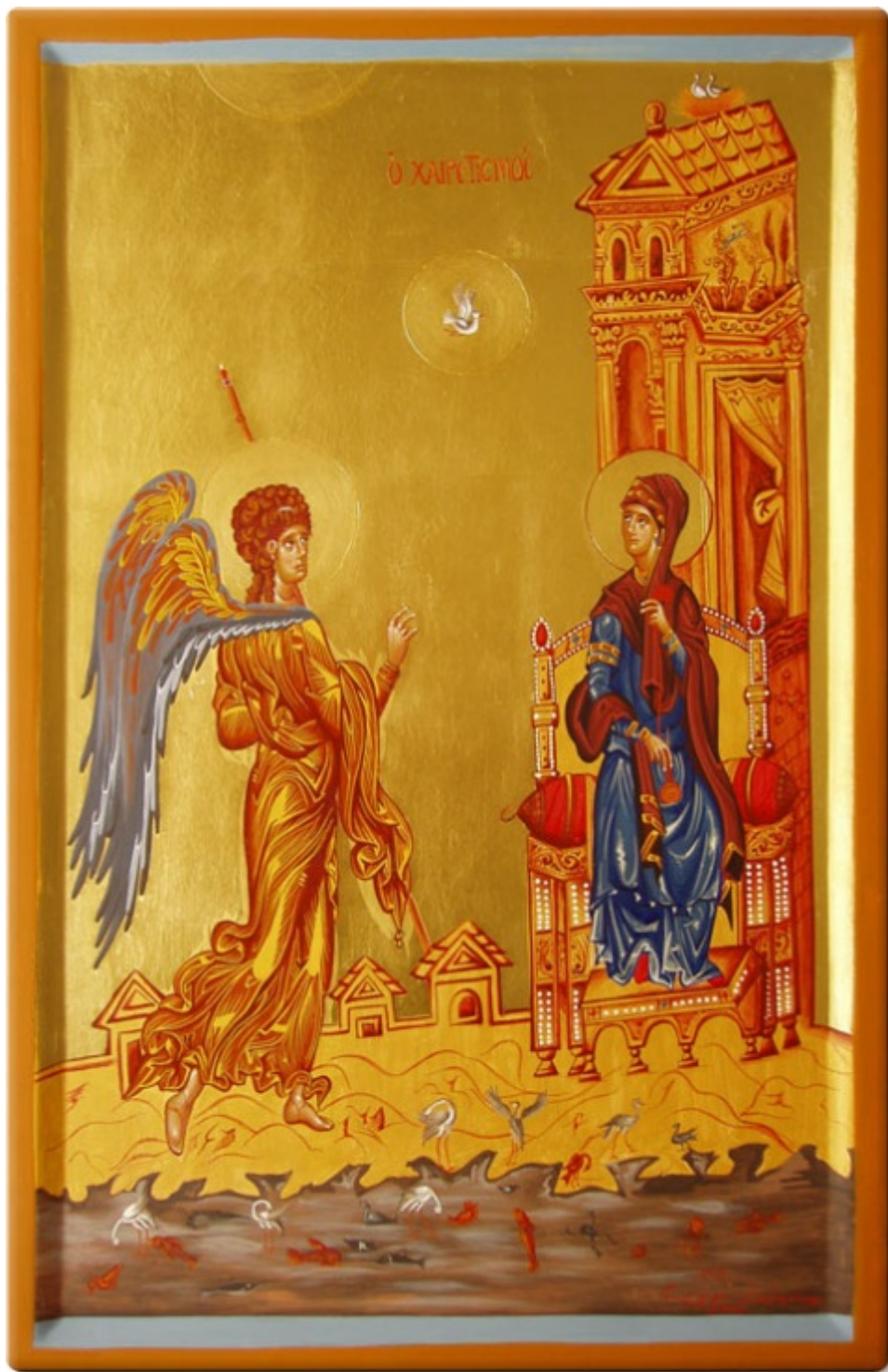
Ευαγγελισμός της Υπεραγίας Θεοτόκου - Πιστό αντίγραφο εικόνας που βρίσκεται στην Μονή Αγίας Αικατερίνης στο Σινά (12ος