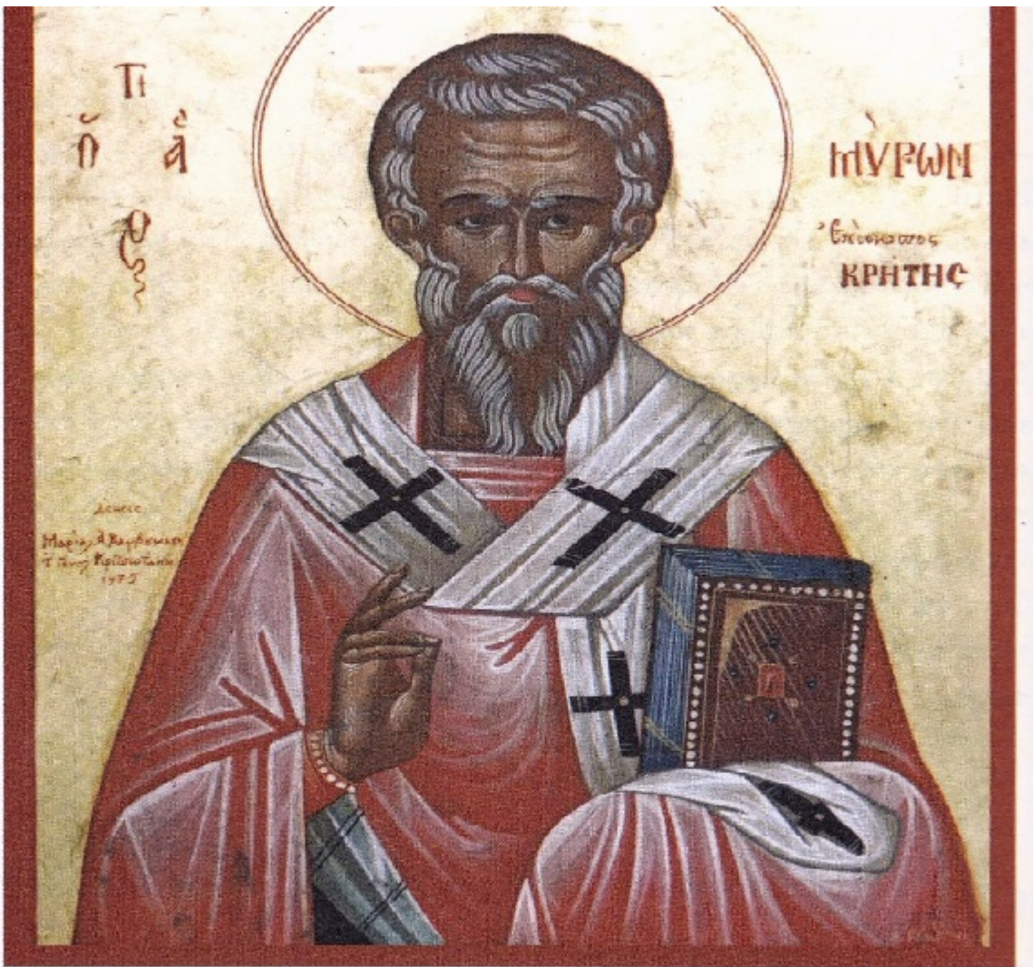
Ὁ Ἅγιος Μύρων, Ἐπίσκοπος Κρήτης. Φωτοτυπὴ Εἰκῶν τοῦ Ἁγίου ἀποκειμένη εἰς τὸν φερρόνυμον ἱερόν Ναόν τῆς ὁμωνύμου Καρσιόλειως. Ἔργον τοῦ Ἀγιογράφου Δημητρίου Σαριδάκη. Ἔτος 1975.