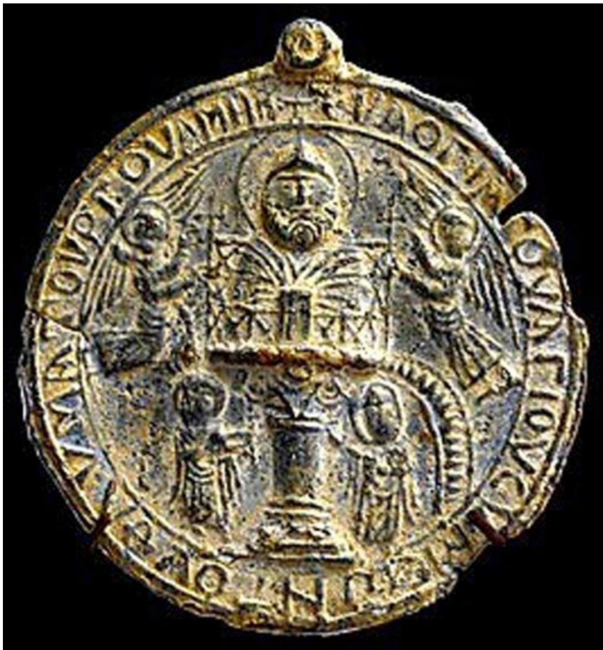
Βυζαντινή ευλογία του Οσίου Συμεών του Θαυμαστορείτου.