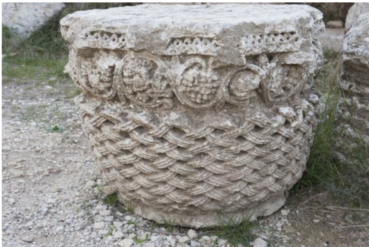
Βυζαντινό κιονόκρανο στον χώρο που ασκήτευσε ο Όσιος Συμεών ο Θαυμαστορείτης.