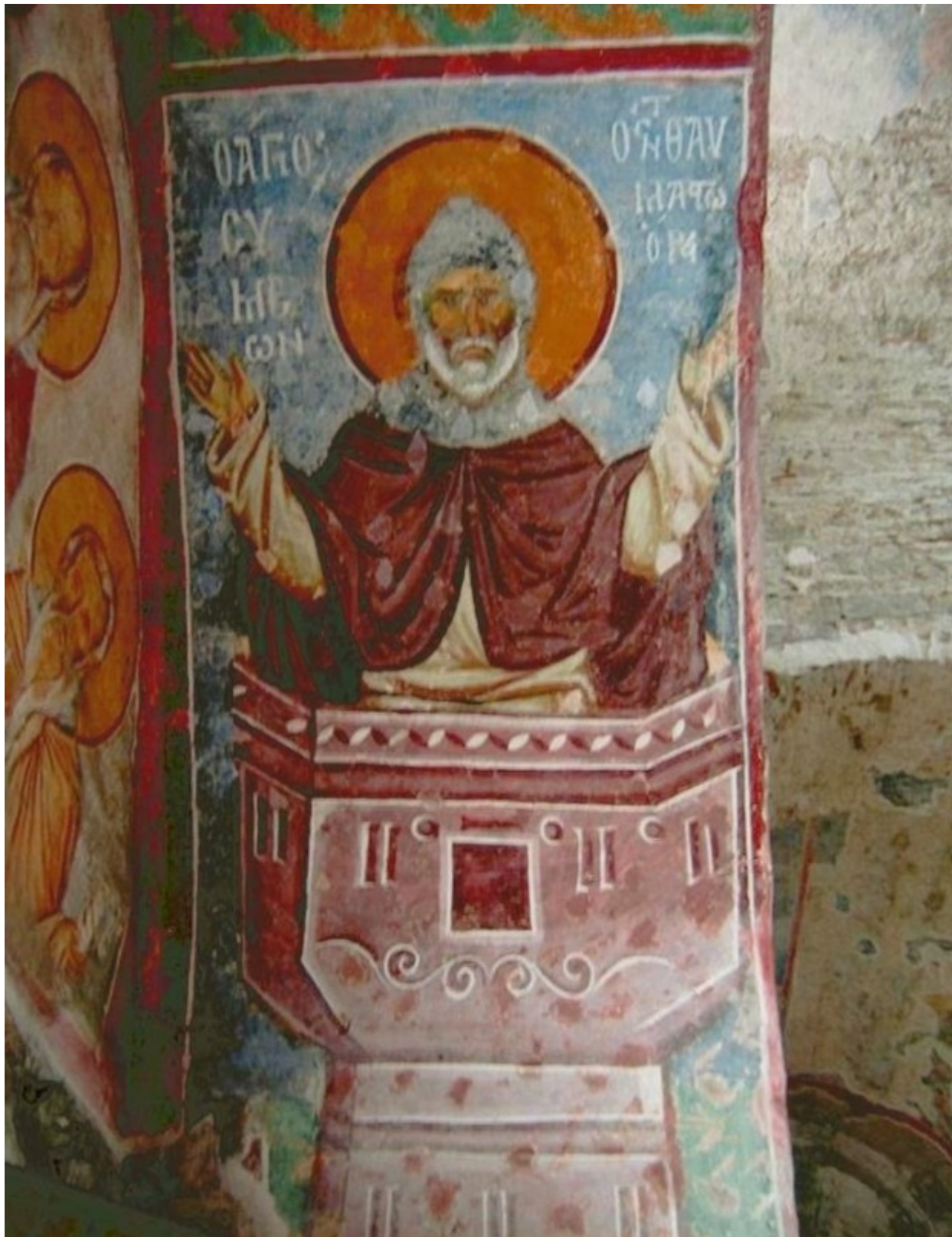
Ο Όσιος Συμεών ο Θαυμαστορείτης. Τοιχογραφία στην Αγία Σοφία Τραπεζούντας Πόντου.

Τον βίο του συνέταξε ο μαθητής του και κατοπινός επίσκοπος Κύπρου Αρκάδιος και ο Νικηφόρος Ουρανός. Πέθανε σε ηλικία εβδομήντα πέντε ετών το 596. Η κάρα του φυλάσσεται στην Ιερά Μονή Νεάμτς (Mănăstirea Neamț) της Ρουμανίας. Η κτητορική επιγραφή στην κορώνα στην οποία είναι τοποθετημένη η κάρα είναι του