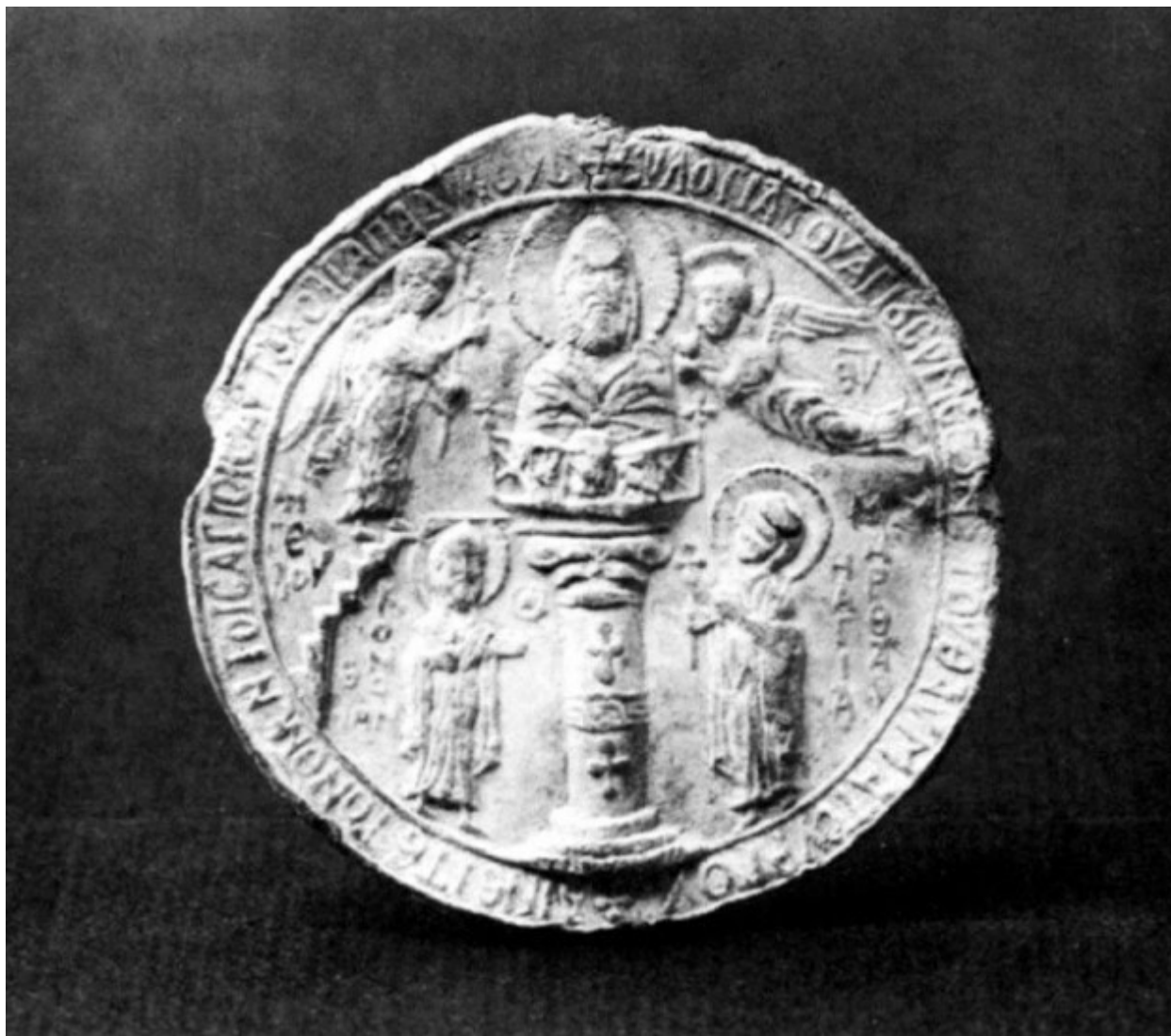
Βυζαντινή ευλογία του Οσίου Συμεών του Θαυμαστορείτου.