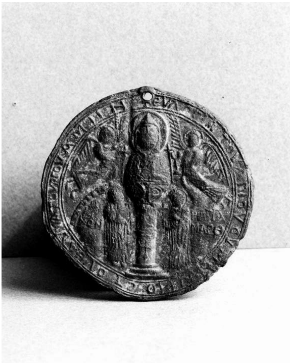
Βυζαντινή ευλογία του Οσίου Συμεών του Θαυμαστορείτου.