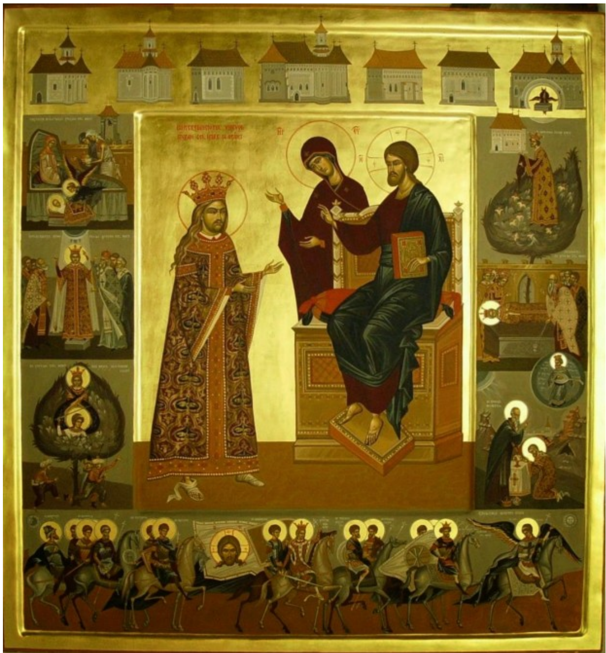
Σύγχρονη εικόνα με τον βίο του Μέγα Στέφανου και Αγίου.