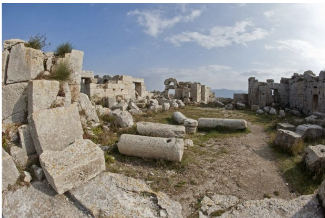
Τα ερείπια των λίθινων κτιρίων και εκκλησιών που είχαν χτιστεί γύρω από την κολώνα που ασκήτευσε ο Όσιος Συμεών ο Θαυμαστορείτης.

Το 1177 ο μοναχός Ιωάννης Φωκάς σε προσκυνηματική του ιεραποδημία στη Συροπαλαιστίνη περιγράφει “εν συνόψει τον απ’ Αντιοχείας μέχρις Ιεροσολύμων κάστρων και χωρών Συρίας, Φοινίκης και των κατά Παλαιστίνη Αγίων Τόπων