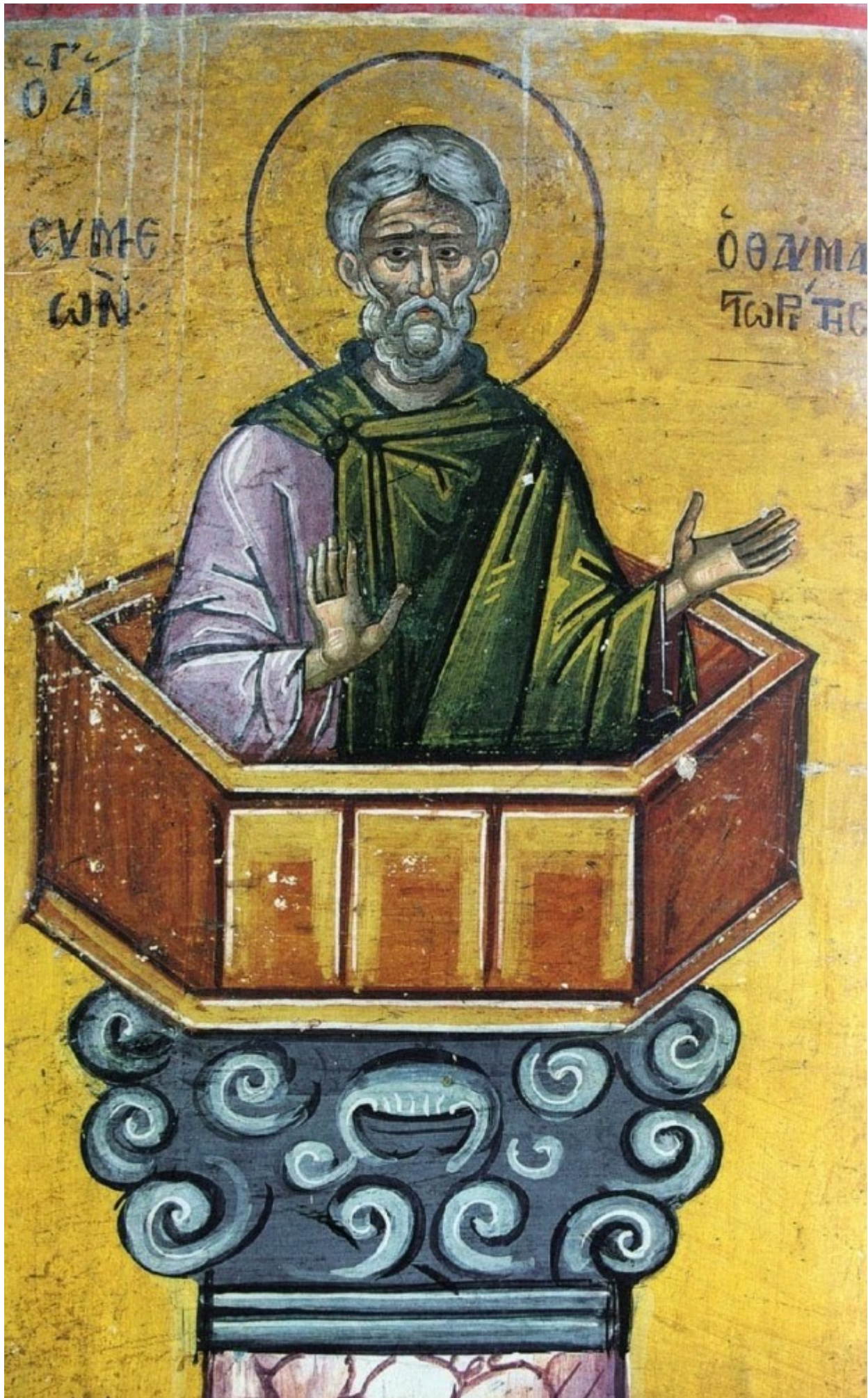
Ο Όσιος Συμεών ο Θαυμαστορείτης.