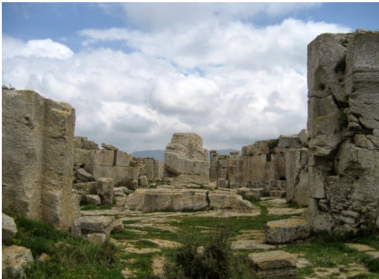
Στο κέντρο η βάση της κολώνας, όπου ασκήτευσε ο Όσιος Συμεών ο Θαυμαστορείτης (η φωτογραφία και αυτές που ακολουθούν από εδώ).

Στυλίτης. Αποσύρθηκε σε περιοχή έξω από την Αντιόχεια. Τα θαύματα που του αποδόθηκαν τον έκαναν να ονομαστεί ο τόπος άσκησής του, ως Θαυμαστό Όρος. Σύντομα γύρω του, συγκεντρώθηκαν αρκετοί νέοι ασκητές ως μαθητές του, ενώ προσείλκυσε και πολλούς προσκυνητές. Ενώ αρχικά διέμεναν σε καλύβες, οι μαθητές του σύντομα κατασκεύασαν λίθινο οίκημα με ναό για την κάλυψη και των λατρευτικών αναγκών τους.