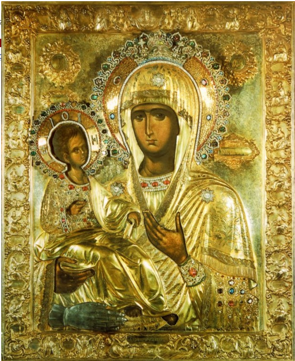
Παναγία η Τριχερούσα