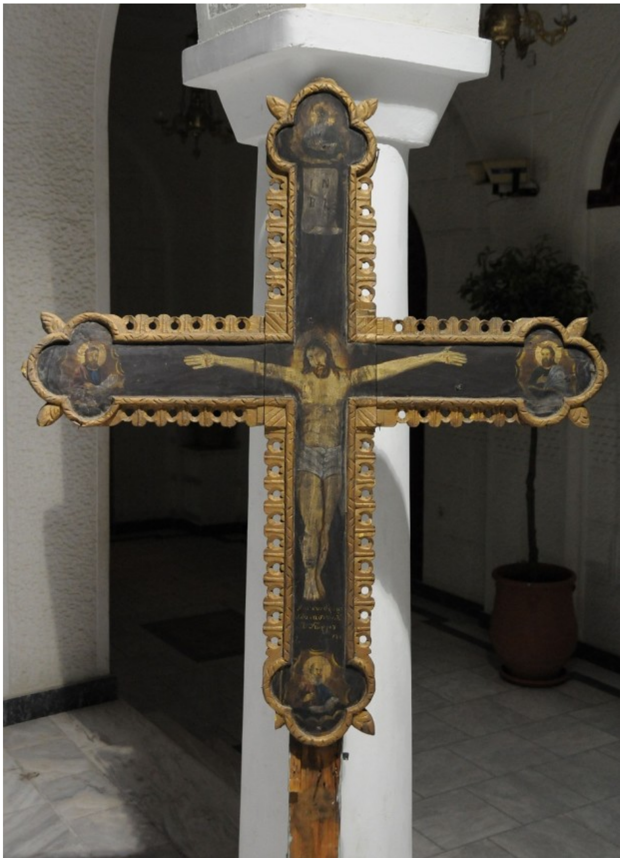
Ο Εσταυρωμένος - 1889 μ.Χ. - Ι.Ν. Ζωοδόχου Πηγής, Λαρίσης ( www.panagialarisis.gr )