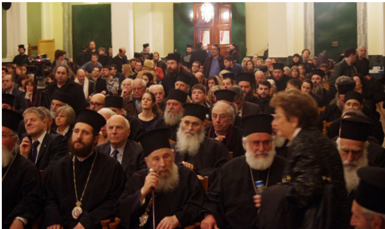
Άποψη από την κατάμεστη αίθουσα της παλαιάς Φιλοσοφικής Σχολής.