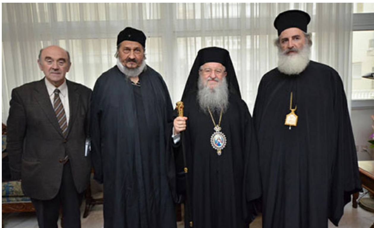
Μετά το πέρας της Θ. Λειτουργίας ο Παναγιώτατος Μητροπολίτης Θεσσαλονίκης κ. Άνθιμος με τους Σεβασμιωτάτους Μητροπολίτες πρ. Ερζεγοβίνης Καθηγητή κ. Αθανάσιο Γιέφτιτς, Αρκαλοχωρίου Καθηγητή κ. Ανδρέα Νανάκη και τον Κοσμήτορα της Θεολογικής Σχολής Μιχαήλ Τρίτο.