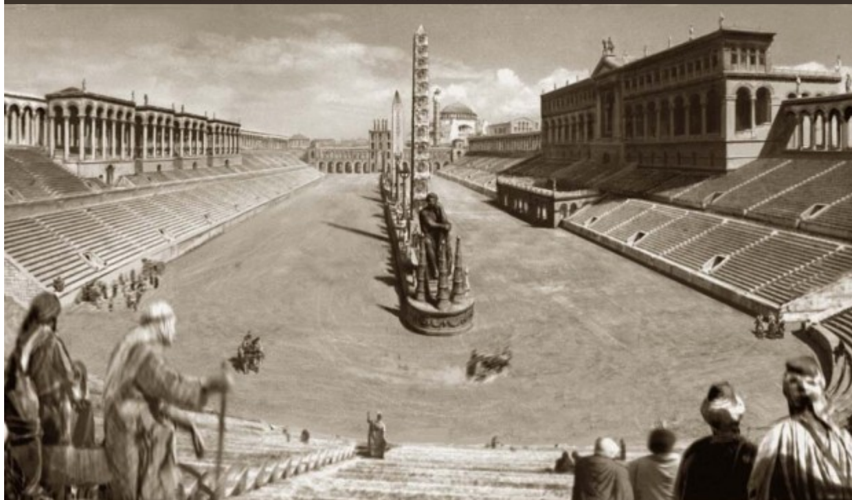
Vue en perspective de l'hippodrome de Constantinople.