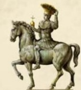
COLONNE HONORIFIQUE DE JUSTINIEN IRIGEE EN L AN 543