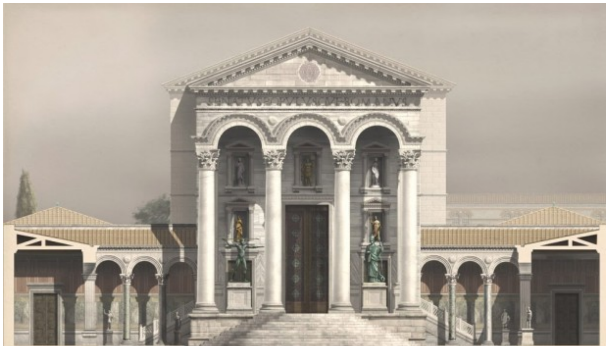
PREMIER SÉNAT AVANT LA SÉDITION DE NIKA CONSTANTINOPLÉ