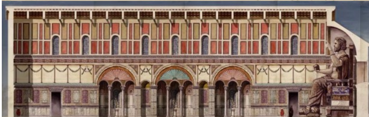
COVPE DV PALAIS DE LAVSOS V EME SIECLE CONSTANTINOPE