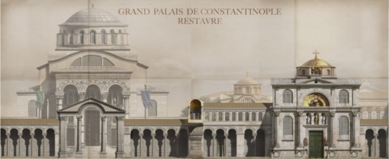
PALATIUM MAGNAURA SENAT