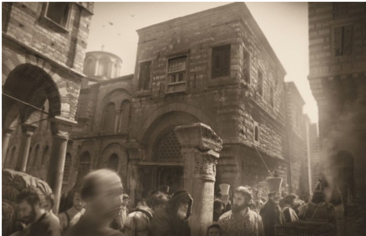
Scène évoquant la vie trépidante d'une rue à Constantinople au XVème siècle.