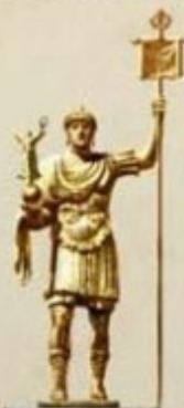
COLONNE DIT DE LEON