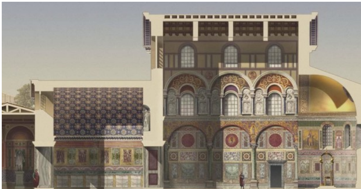
coupe coté Nord