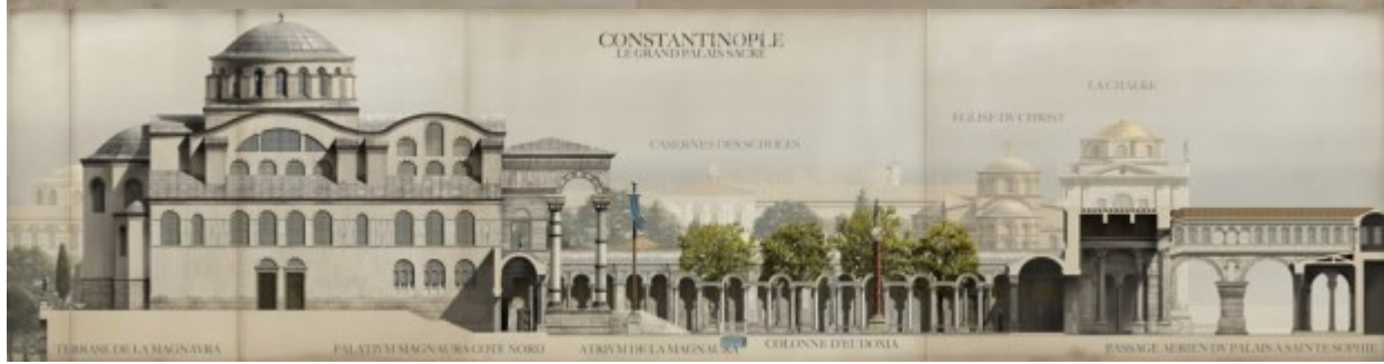
CONSTANTINOPE LE GRAND PALAIS SACRE