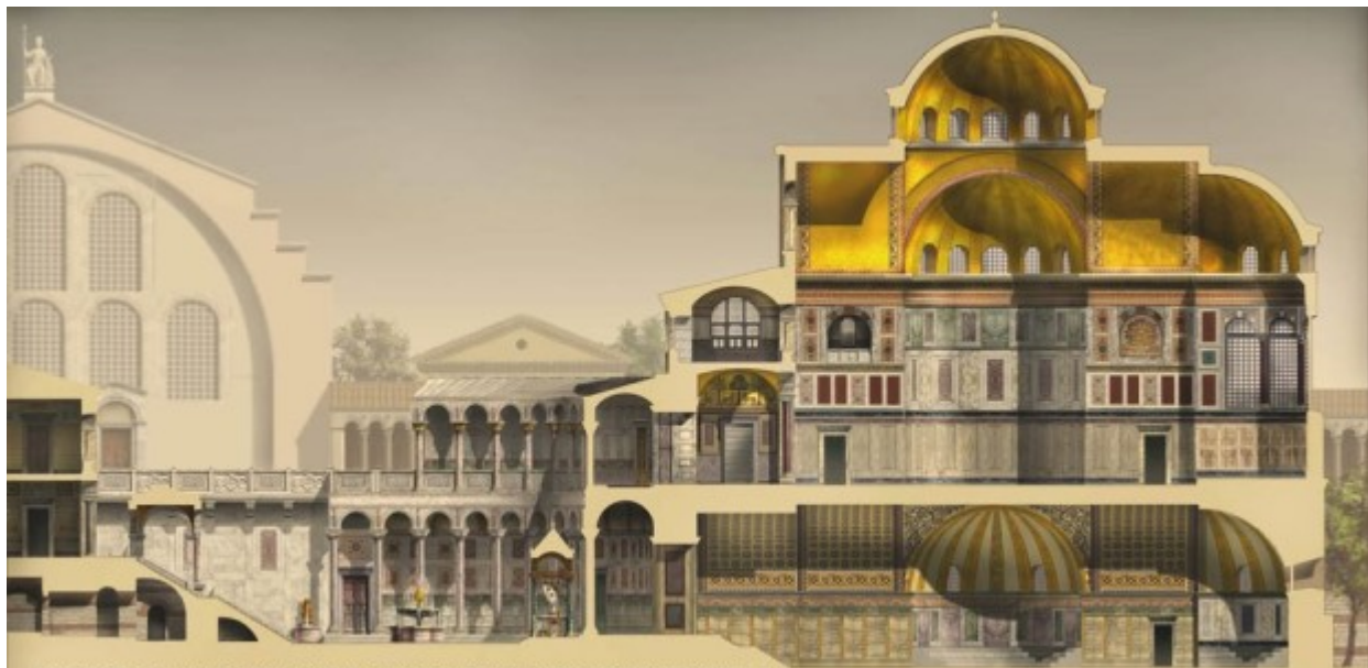
COUPE DU PALAIS DU TRICORNE CONSTRUIT PAR L'EMPEREUR THEOPHILE GRAND PALAIS DE CONSTANTINOPLE.