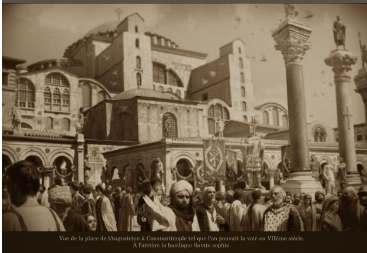
Vue de la place de l'Augusteion à Constantinople tel que l'on pouvait la voir au VII ème siècle. À l'arrière la basilique Sainte Sophie.