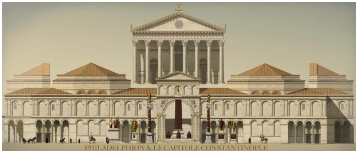
PHILADELPHION & LE CAPITOLE CONSTANTINOPE