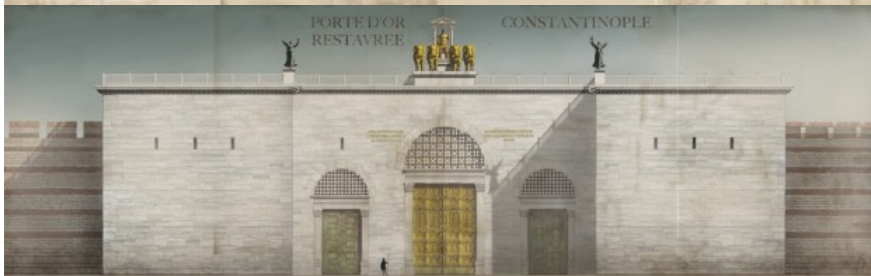
PORTE D'OR RESTAVREE CONSTANTINOPE