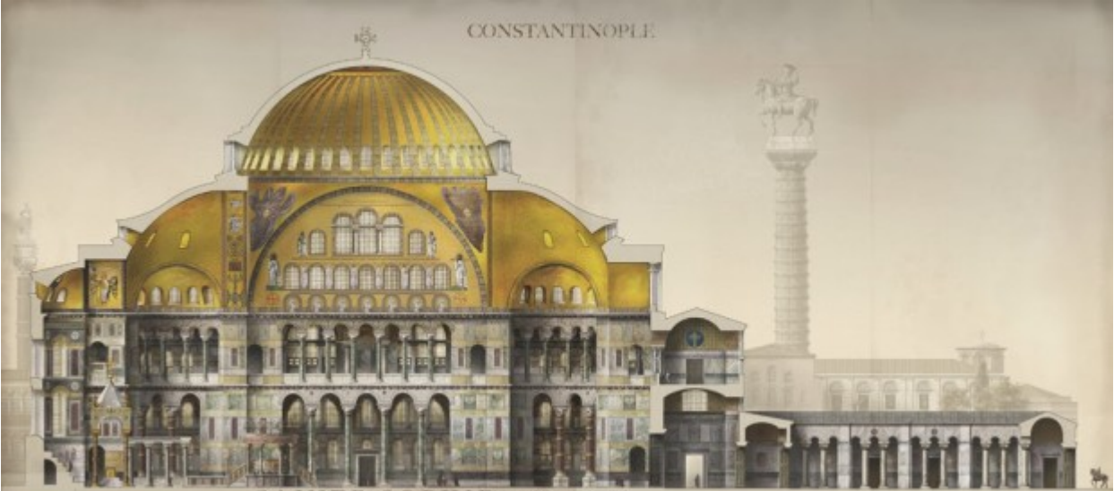
SAINTE SOPHIE coupe est ouest