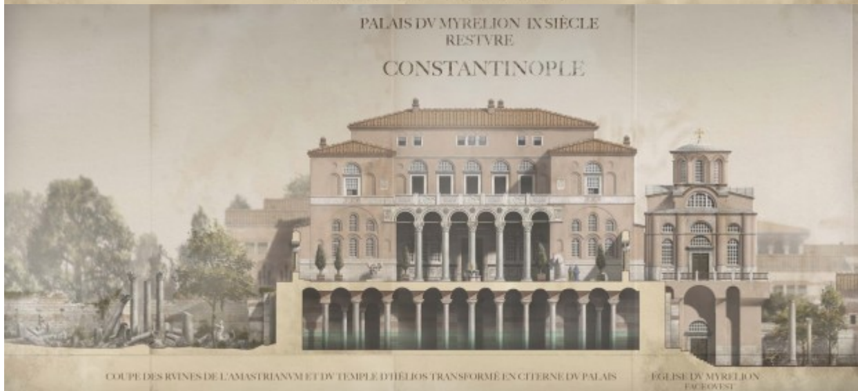
PALAIS DV MYRELION IX SIÈCLE RESTRVRE