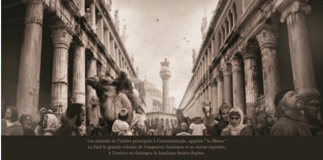
vue centrale de l'artère principale à Constantinople, appelée "la Mésse" au fond la grande colonne de l'empereur Justinien et sa statue équestre, à l'arrière on distingue la basilique Sainte Sophie.

Σύμφωνα με τη λεζάντα, βλέπουμε μία άποψη της "Μέσης", της κεντρικής λεωφόρου της βυζαντινής Κωνσταντινούπολης, ενώ στο βάθος η περιβόητη στήλη του Ιουστινιανού με το έφιππο άγαλμα του Ιουστιανού στην κορυφή και ακόμα μακρύτερα ο τρούλος της Αγίας Σοφίας.