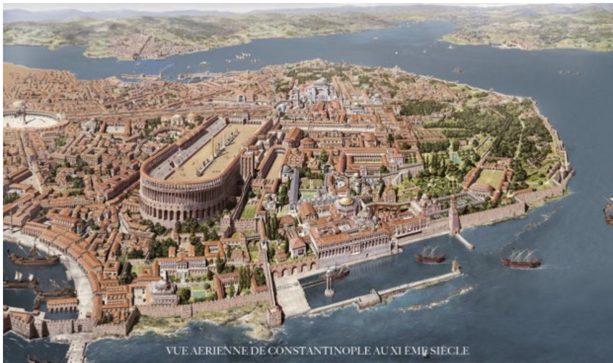
VUE AERIENNE DE CONSTANTINOPLE AU XI EM E SIECLE