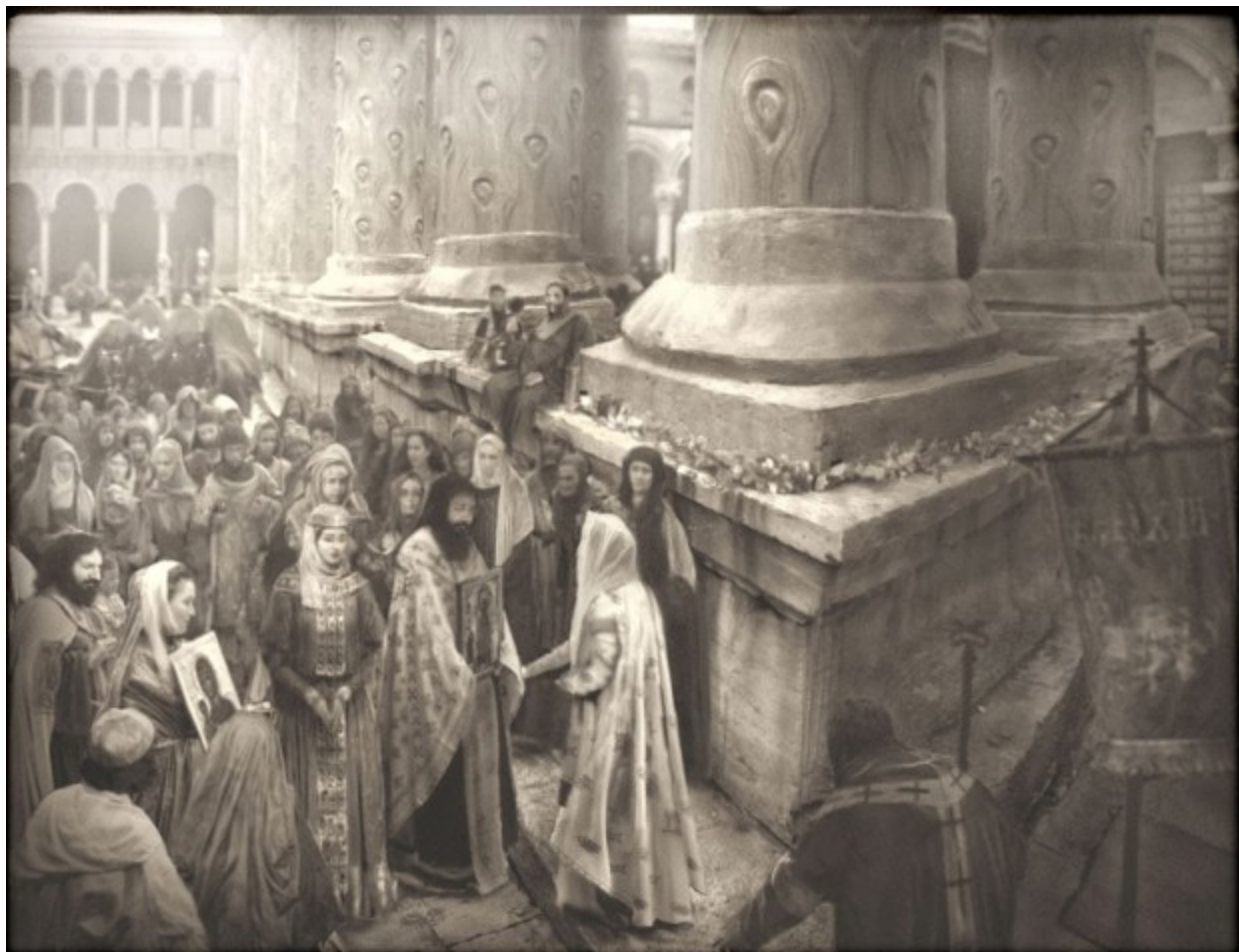
Procession religieuse, autour de l'arc de triomphe de l'empereur Théodose le grand.